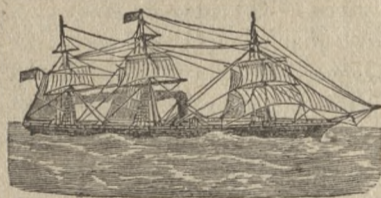
ZARAZEM JEST AGENTEM

wszystkich kompanii kolejowych i linii okrętów parowych i sprowadza pasażerów ze starego kraju na najlepszych okrętach i po umiarkowanej cenie.