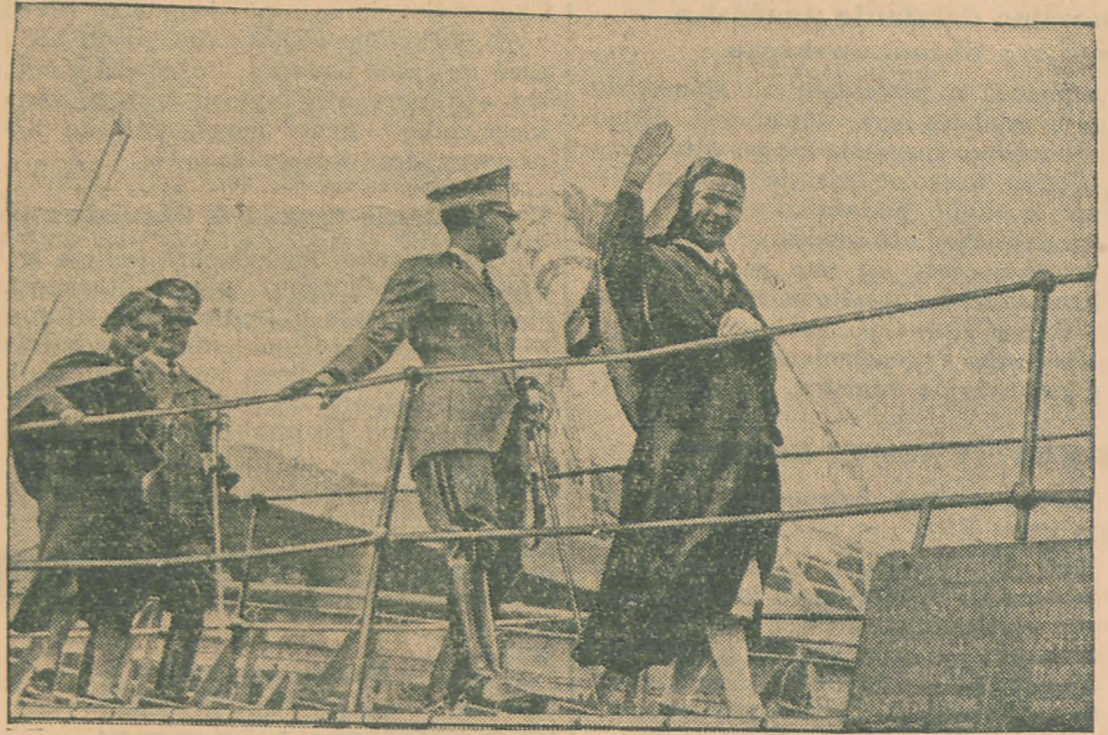
Żona włoskiego następcy tronu, ks. Marja - Josę, która jakiś czas przebywała na froncie abisyńskim w charakterze sanitariuszki, powróciła obecnie do kraju. Na zdjęciu widzimy ją w momencie, gdy opuszcza statek w Neapolu.