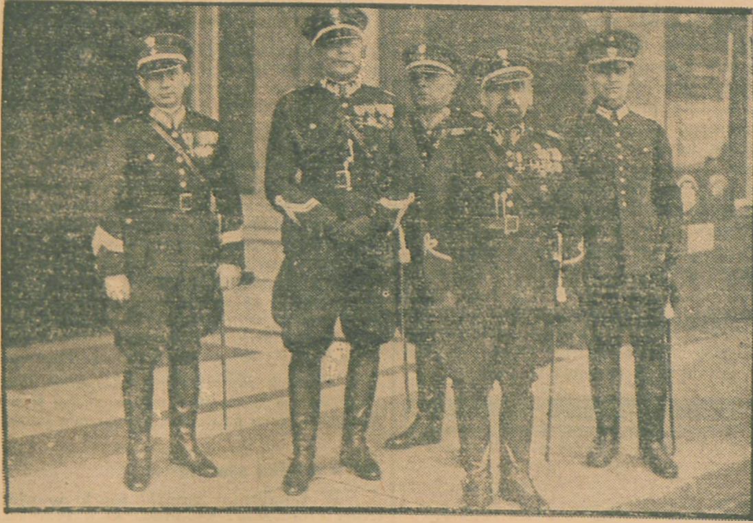
Główny Komendant Policji Państw. gen. Zamorski (drugi od prawej) przybył do Berlina, gdzie zapozna się z najnowszymi metodami pracy policji niemieckiej.