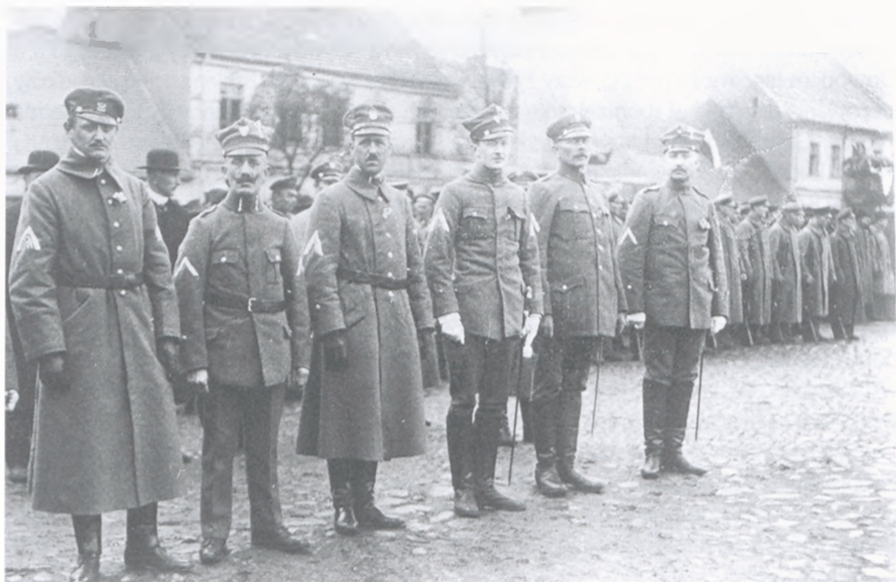
Dowódcy Straży Ludowej w powiaty grodziski i nowotomyski podczas zaprzysiężenia w Opalenicy 1919 r.

wyzwalania Chodzieży, Inowrocławia, Szubina i Wolsztyna. W następnych dniach doszło do walk zaczepnych ze strony polskiej, m. in. na froncie północnym – boje o Żnin, Łabiszyn, Złotniki i Szubin. Na froncie zachodnim powstania opanowana została Kopanica, nie zdobyto jednak Zbąszynia. Z kolei na froncie południowym korzystnie zakończyły się walki w obronie Osiecznej.