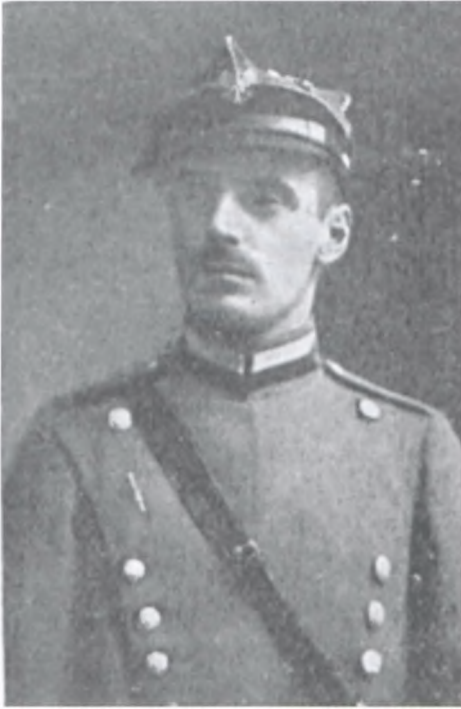
Płk. Władysław Anders jako dowódca 15. Pułku Ułanów Poznańskich

jednostek kawalerii, a z dniem 1 kwietnia 1937 r. 2. Samodzielna Brygada Kawalerii zmieniła nazwę na Kresowa Brygada Kawalerii. Wówczas brygada z trzypułkowej stała się czteropułkową. Po dokonaniu reorganizacji brygady gen. bryg. Władysław Anders 13 kwietnia 1937 r. został wyznaczony na stanowisko dowódcy czteropułkowej Nowogródzkiej Brygady Kawalerii z miejscem postoju dowództwa w Baranowiczach. Generał objął to stanowisko 4 maja 1937 r. W dniach 23-25 marca 1939 r. nastąpiła mobilizacja Nowogródzkiej Brygady Kawalerii, a do 28 marca 1939 r. brygada została przetransportowana w rejon Sierpca na Mazowszu. Brygada weszła w skład Armii „Modlin” i otrzymała zadanie osłony kierunku Lidzbark-Płock. Brygada znajdując się na lewym skrzydle armii otrzymała odcinek obrony szerokości niemalże 40 km, co przekraczało możliwości nawet czteropułkowej brygady kawalerii wzmocnionej dwoma batalionami piechoty.