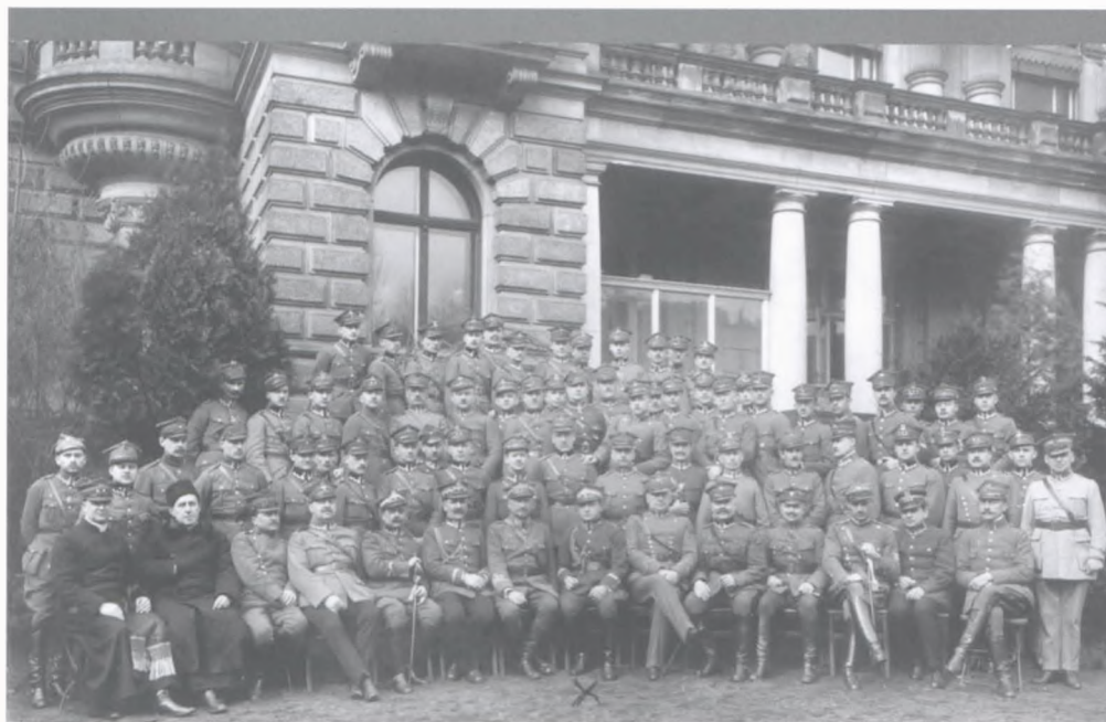
Oficerowie Dowództwa Głównego ( marzec 1920) .