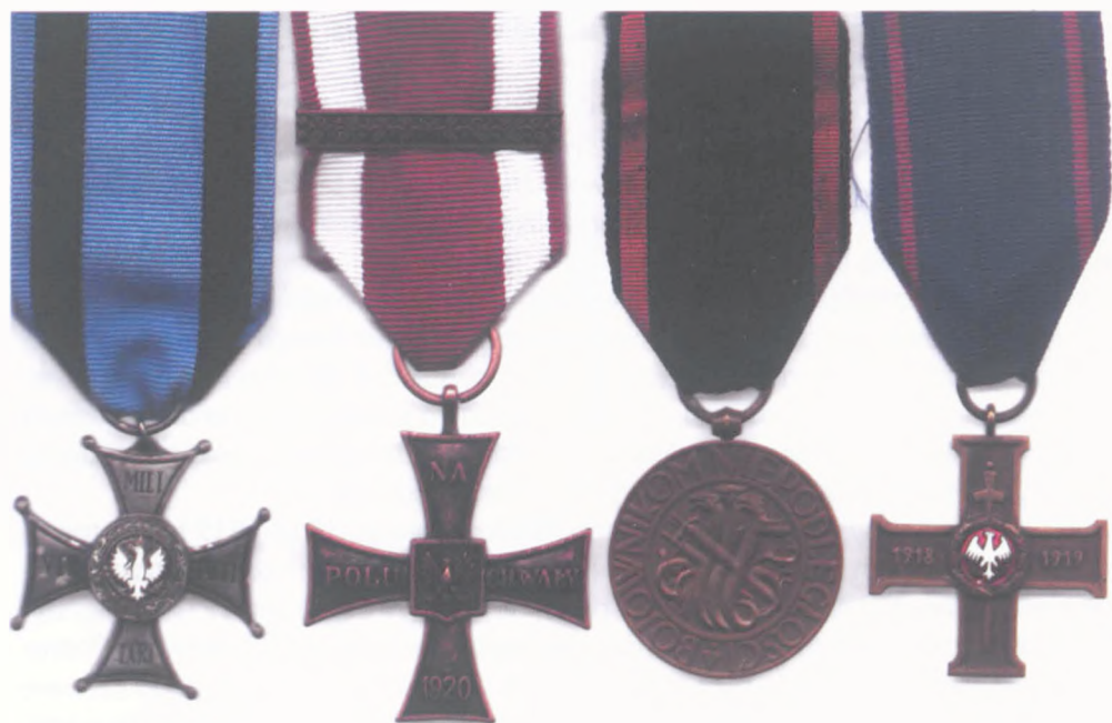
U honorowania wpisujące się w powstańcze biografie...