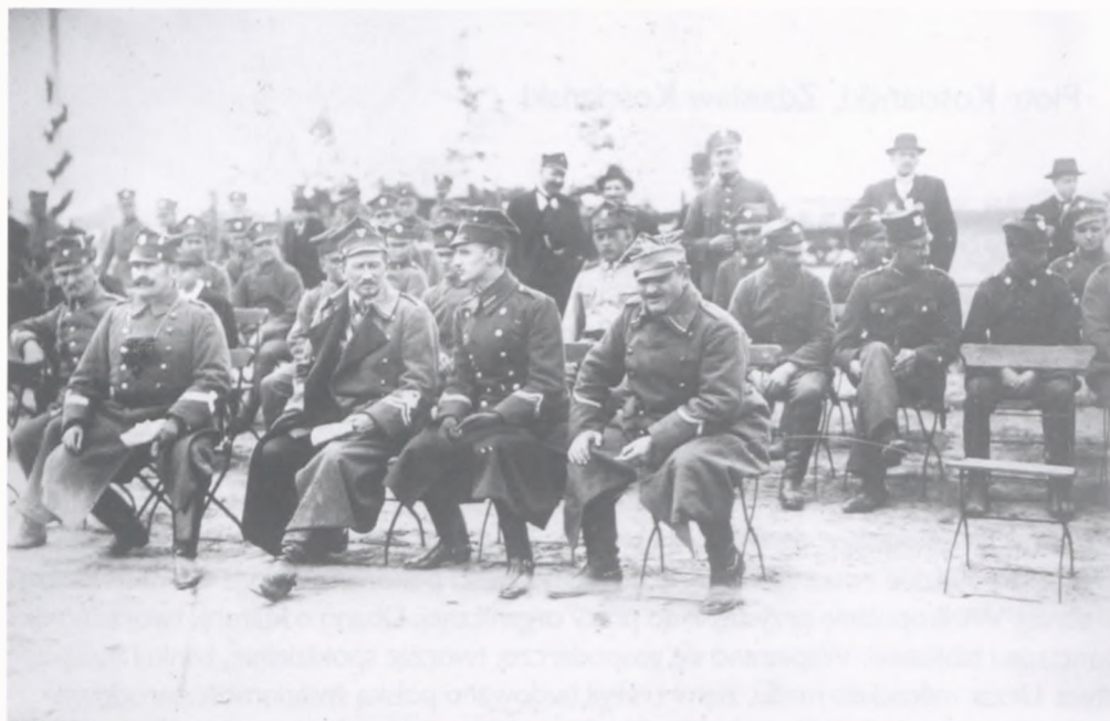
Gen. J. Dowbor Muśnicki wraz z oficerami Sztabu Głównego, m.in. Julianem Lange, Władysławem Andersem podczas przerwy w uroczystościach 1919