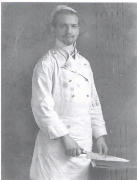
Edmund Klemczak

Bibliografia: Z. Kościański, Klemczak Edmund (1886-1939), (w:) Powstańcy wielkopolscy. Biogramy uczestników powstania wielkopolskiego 1918-1919, t. IV, red. B. Polak, Poznań 2008, s. 77.