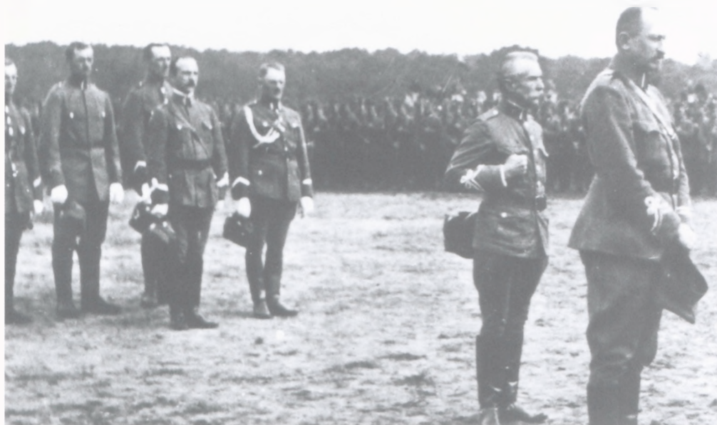
Przysięga 6 pułku strzelców wielkopolskich. 9 sierpnia 1919 r. Pierwszy z prawej gen. Józef Dowbor-Muśnicki

w powiecie odolanowskim i okolicy Kobylejgóry w powiecie ostrzeszowskim, podczas których zlikwidowano znajdujące się tutaj posterunki niemieckie, wykonujące napady na tereny pozostające pod polską kontrolą.