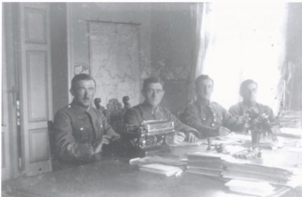
Oficerowie sztabu Grupy „Leszno” 1919.

szereg oddziałów dla wypoczynku i szkolenia, a także zorganizować z nich zwarte pułki w ramach przyjętego schematu organizacyjnego Wojska Wielkopolskiego.