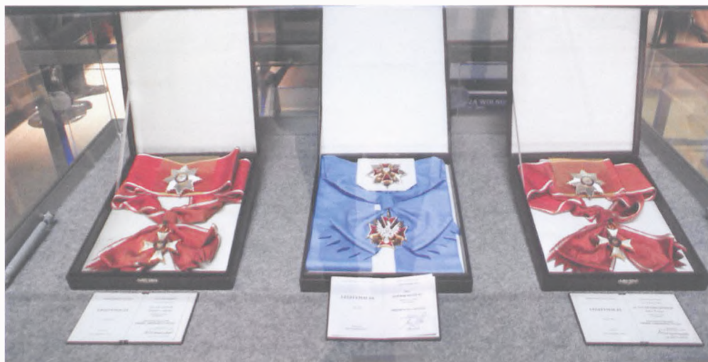
Ekspozycja Orderu Orła Białego i Krzyży Wielkich Orderu Odrodzenia Polski - odznaczeń generałów Stanisława Taczaka i Józefa Dowbor Muśnickiego w poznańskim Muzeum Powstania Wielkopolskiego