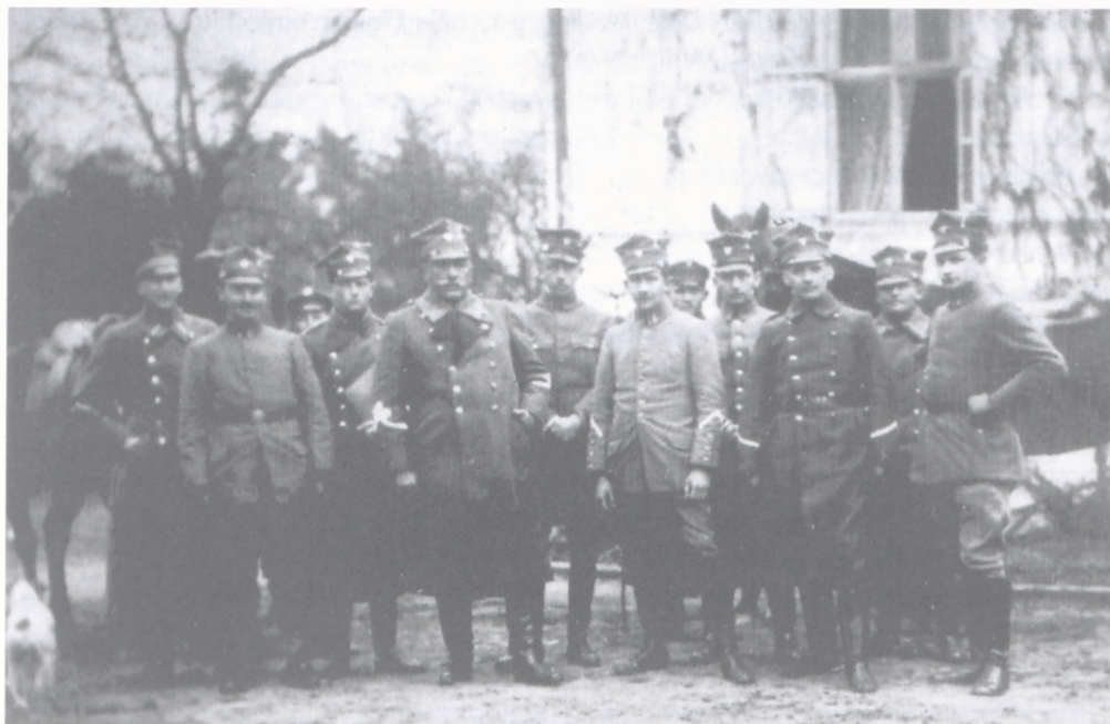
Ppłk. Kazimierz Grudzielski wśród oficerów sztabu północnego frontu Powstania

giej jednak strony był to gruntownie wykształcony oficer sztabowy z ogromną praktyką, świetny organizator, zwolennik regularnej armii o żelaznej dyscyplinie. Przywiązywał szczególne znaczenie do właściwej organizacji wojska, akcentując w swoich publikowanych „Myślach wojskowych”, iż „klucz zwycięstw leży w znajomości zawilego zagadnienia organizacji”, a „na polu bitwy mają wartość tylko regularne armie” jako „duchowa spójnia (związanych ze sobą) w jedną ideową całość wszystkich poszczególnych jednostek wchodzących w skład armii”. Wódz naczelny – według Muśnickiego – był „mózgiem i duszą armii”, a sztab – „systemem nerwowym”.