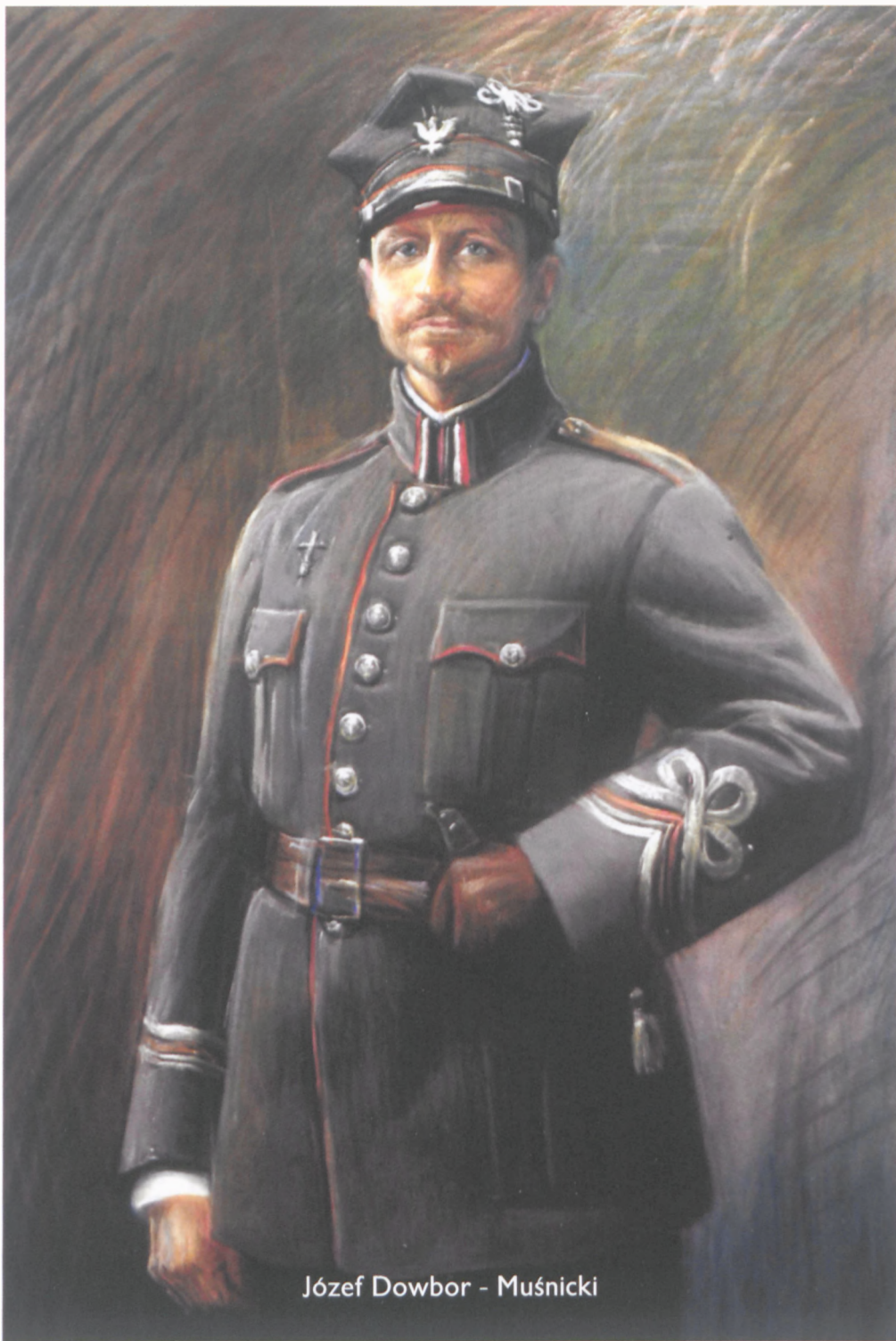
Józef Dowbor - Muśnicki