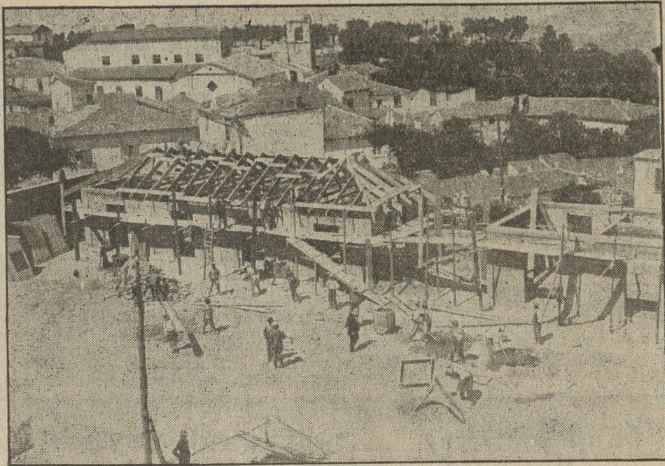
Odbudowa zniszczonego przez trzęsienie ziemi miasta Ariano.

Takiego postawienia sprawy nie można tłumaczyć inaczej, jak chęcią wywierania wpływu w okresie wyborczym na poszczególne towarzystwa rolnicze i ich członków. (E)