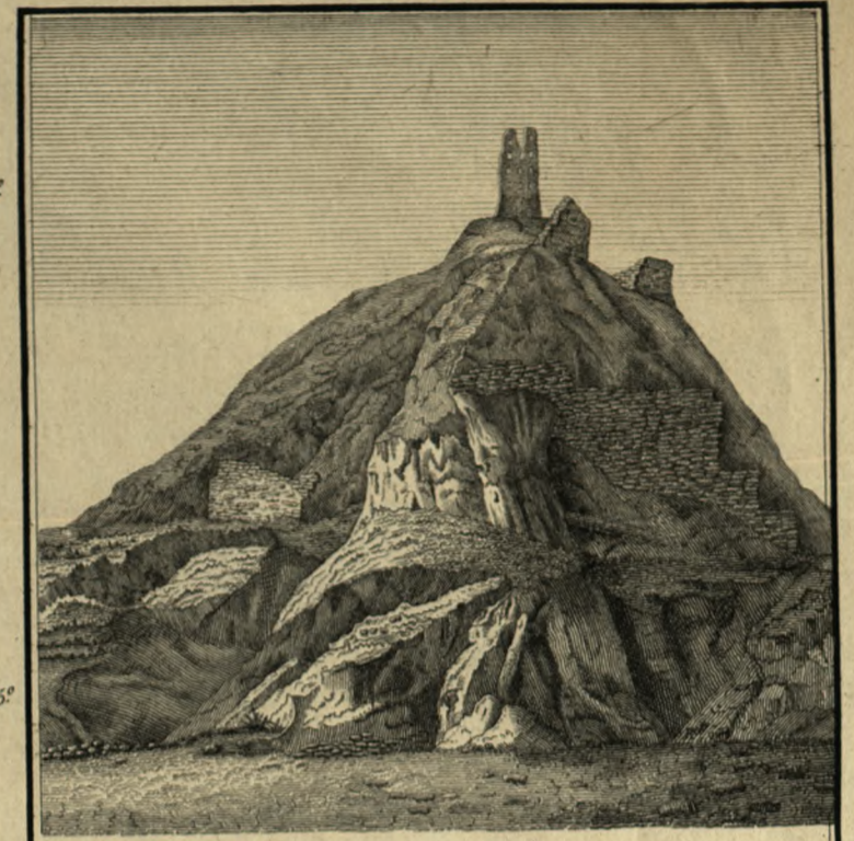
Ruines de la TOUR DE BABEL nommée aujourd'hui Birs-Nemrod. Elles s'élevaient sur le lieu où fut le quartier de Babel, appelé Barsippa. Le dernier mot signifie tour des langues, et en manuscrits ville de la dispersion des langues. On vient de trouver dans ces ruines des inscriptions cunéiformes de Nabuchodonosor qui attestent que ce temple des phéniciens, dévoré par le feu à cause de la confusion des langues et ruiné par le fléau de la tremblante de terre, fut restauré et terminé par ce conquérant.