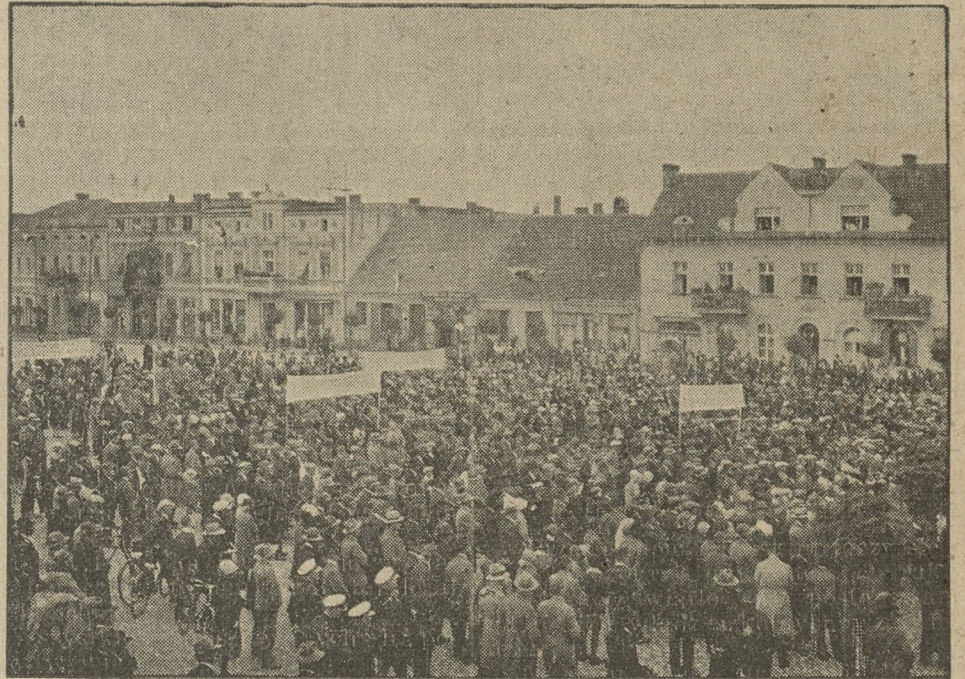
Manifestacja narodowa w Gostyniu przeciw zakusom niemieckim w dniu 7 września

186.630, a w roku 1929 — 243.442; zatem około ćwierć miliona osób opuściło w ciągu trzech lat kraj w poszukiwaniu pracy.