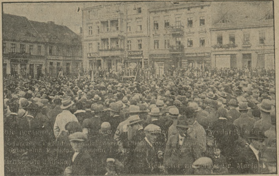
Manifestacja w grodzie Lecha, w Gnieźnie w dniu 7 września

Emigracja z Polski wykazuje w ostatnich latach stały wzrost. W 1927 wyemigrowało ogółem 147.614 osób, w 1928 —