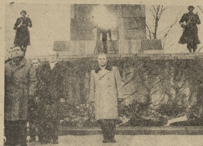
U stóp pomnika zapłonął znicz