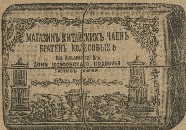
Opakowanie herbaty karawanowej.