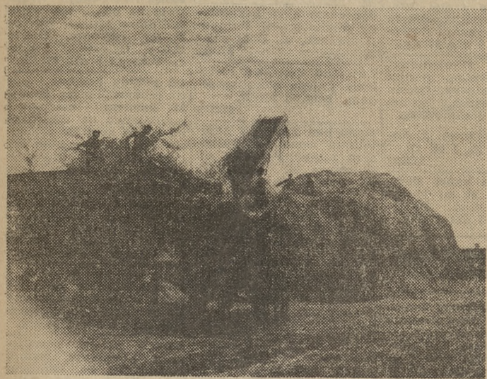
Młócenie kwalifikowanego żyta na wymianę dla kółek rolniczych i gospodarstw indywidualnych.