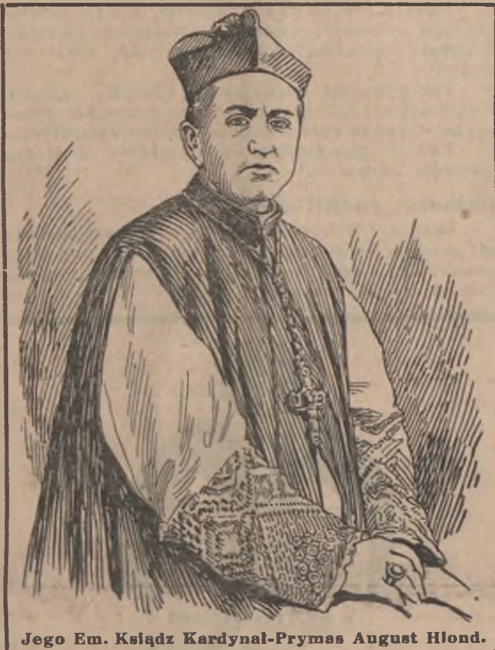
Jego Em. Ksiądz Kardynał-Prymas August Hlond.

pierwszy kapłan, ku chwale Bogu, ku zwartości i wzmocnienia ducha polskiego.