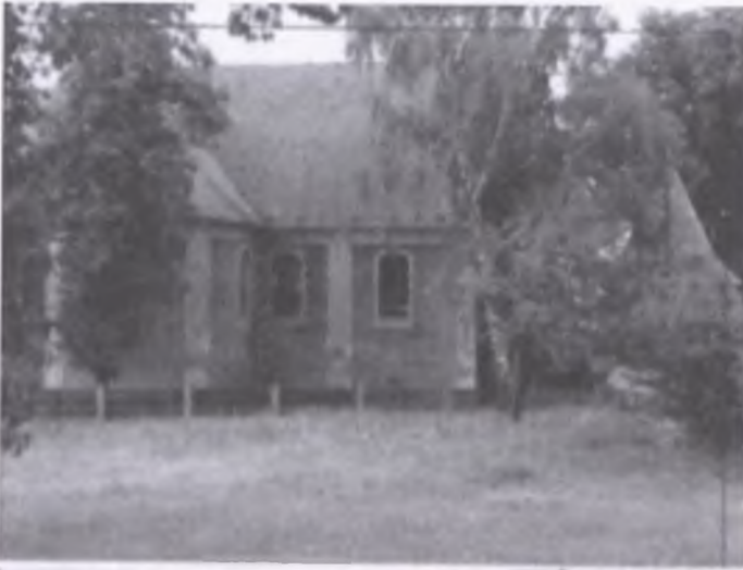
Pocztówka z wytomyskim kościołem p.w. św. Michała Archanioła .....