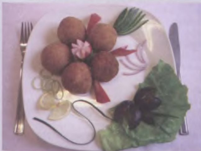
Kuleczki ryżowo - serowe