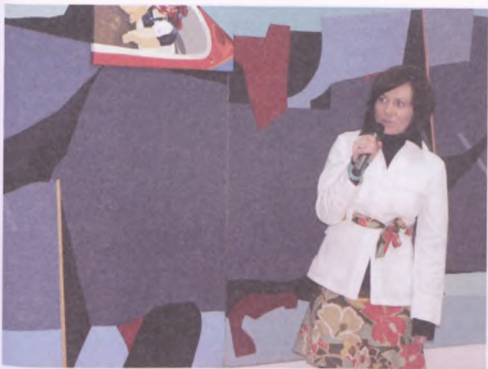
Artystka podczas otwarcia wystawy w Miejskiej i Powiatowej Bibliotece Publicznej ...