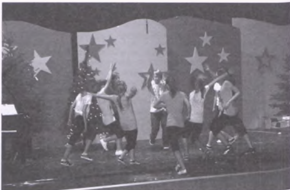
Na scenie Nowotomyskiego Ośrodka Kultury było tanecznie i kabaretowo