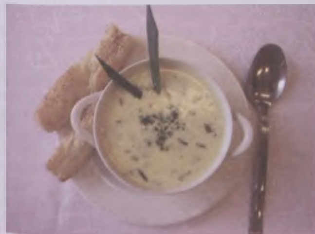
Zupa serowa ze szczypiorkiem