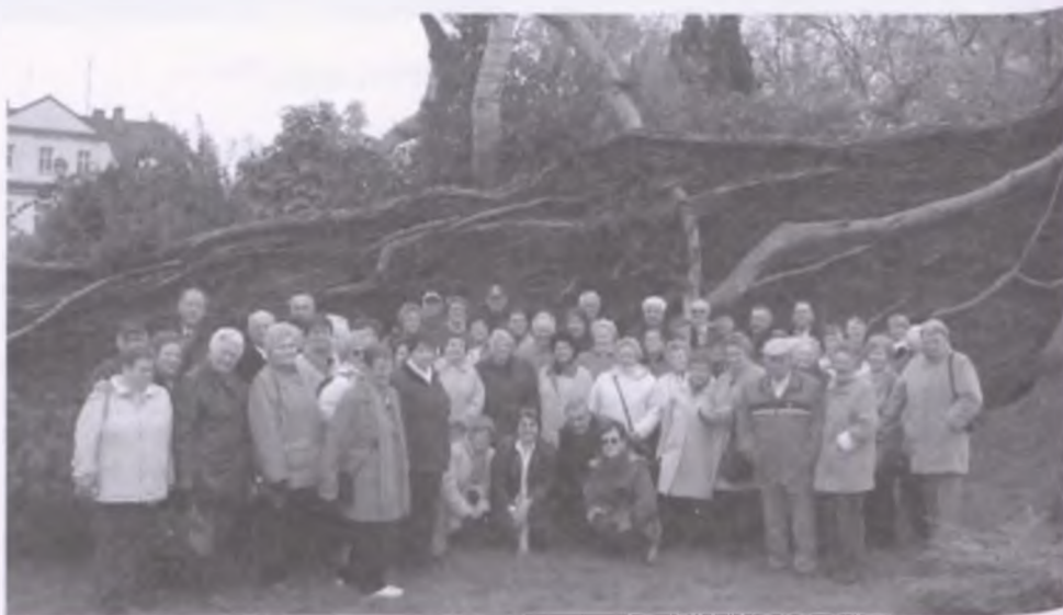
Pamiątkowa fotografia seniorów na tle największego wiklinowego kosza świata