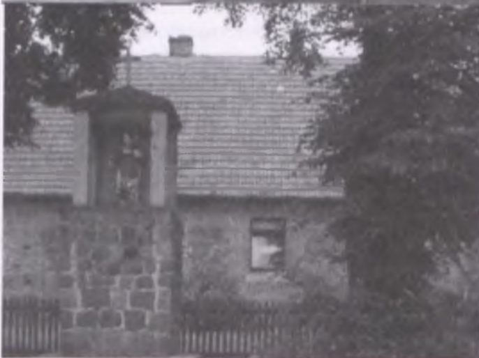
Kapliczka z figurą św. Wawrzyńca u południowego zbiegu ulic Kościelnej i Szkolnej