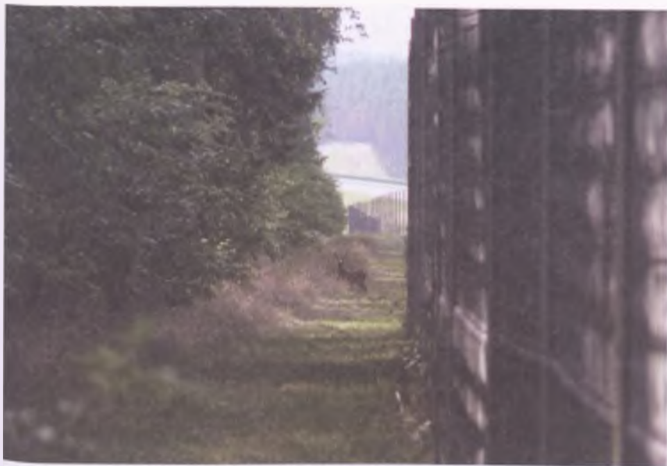
Wyprawy w poszukiwaniu przeszłości owocują również spotkaniami z przyrodą