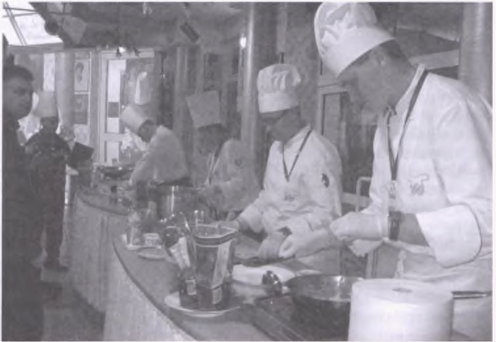
Uczestnicy konkursowych zmagają podczas przygotowywania dań z wielkopolskiego sera smażonego

Gala finałowa Konkursu na Danie z wielkopolskiego sera smażonego odbyła się 21 października 2009r. w restauracji Beverly Hills , w siedzibie Wyższej Szkoły Hotelarstwa i Gastronomii w Poznaniu. Uczestnicy gali finałowej dowiedli swego profesjonalizmu i potwierdzili wysoki poziom oraz innowacyjność prezentowanych receptur. Zmagania konkursowe stały na najwyższym poziomie. Komisja konkursowa przyznała: I miejsce – Zespołowi Szkół Gastronomicznych w Warszawie za chrusty poznańskie, II miejsce – Zespołowi Szkół Gospodarczych w Elblągu za top-serowe irish coffe ze szparagów i borowików ubrane croutonową truflą i III miejsce – Zespołowi Szkół Gospodarczych w Elblągu za tostadę wołowo – serową z sałatką pesto aromatyzowaną sosem z czarnej porzeczki.