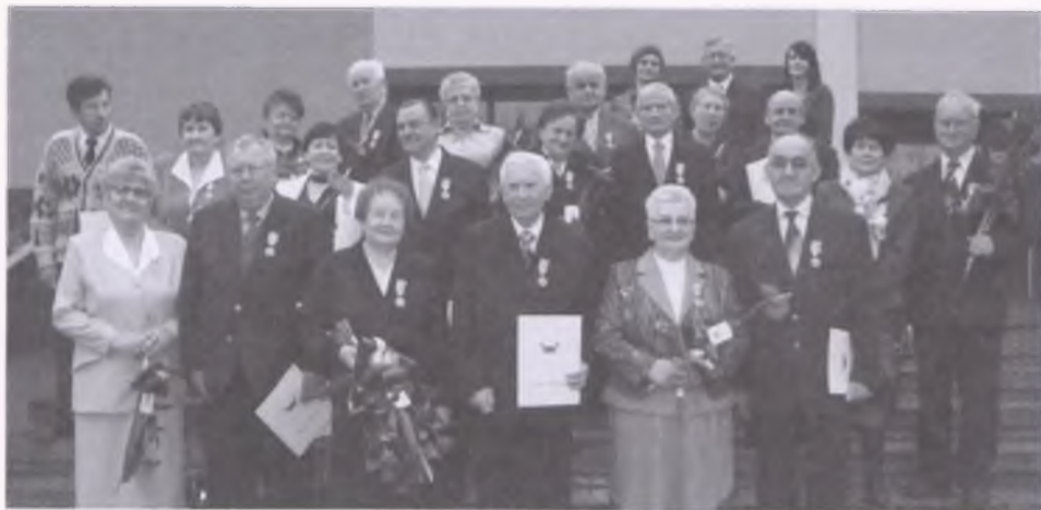
Złoci jubilaci – na pamiątkowych fotografiach