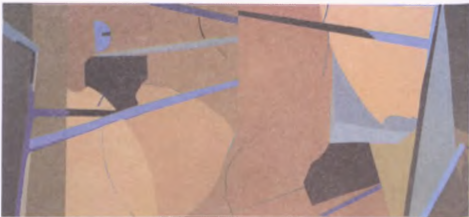
bez tytułu/olej na płótnie/314x150 cm