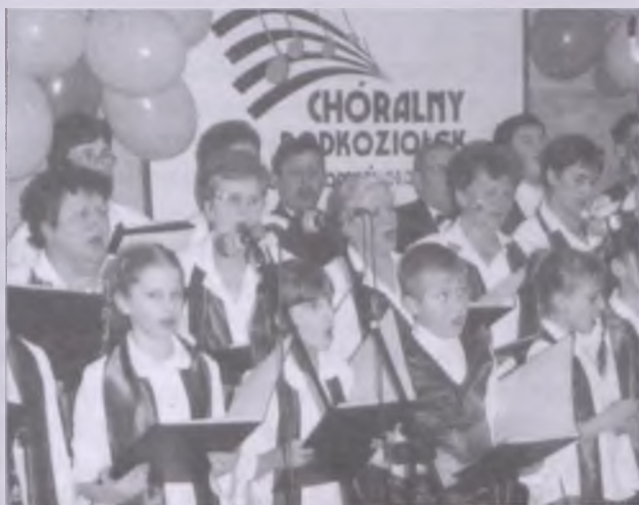
Zespół Wytomyślanie podczas występu w ramach Chóralnego Podkoziółka w Nowotomyskim Ośrodku Kultury