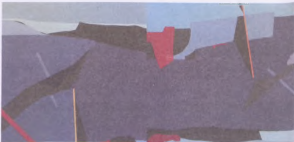
bez tytułu/olej na płótnie/ 314x145 cm