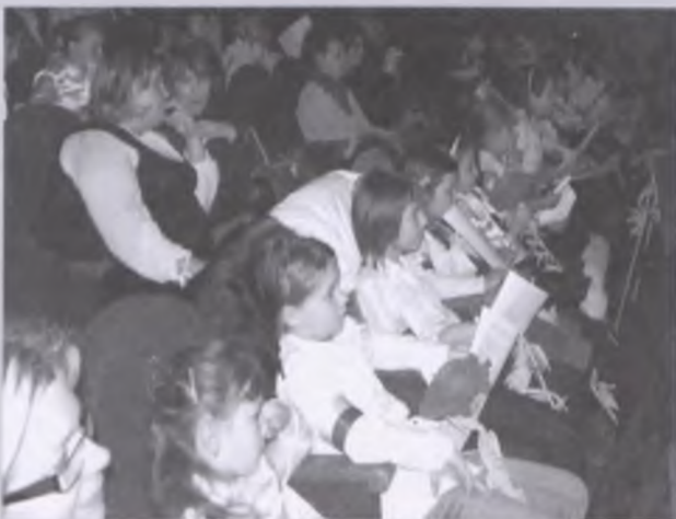
Wykonawcy potrafili zachęcić publiczność do wspólnego śpiewania