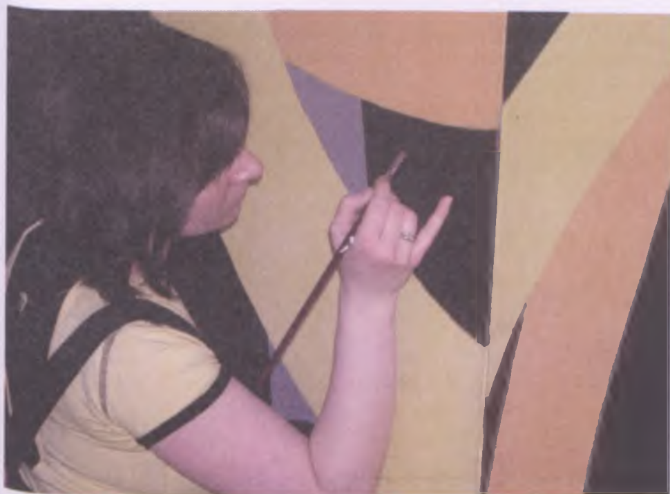
... i podczas pracy