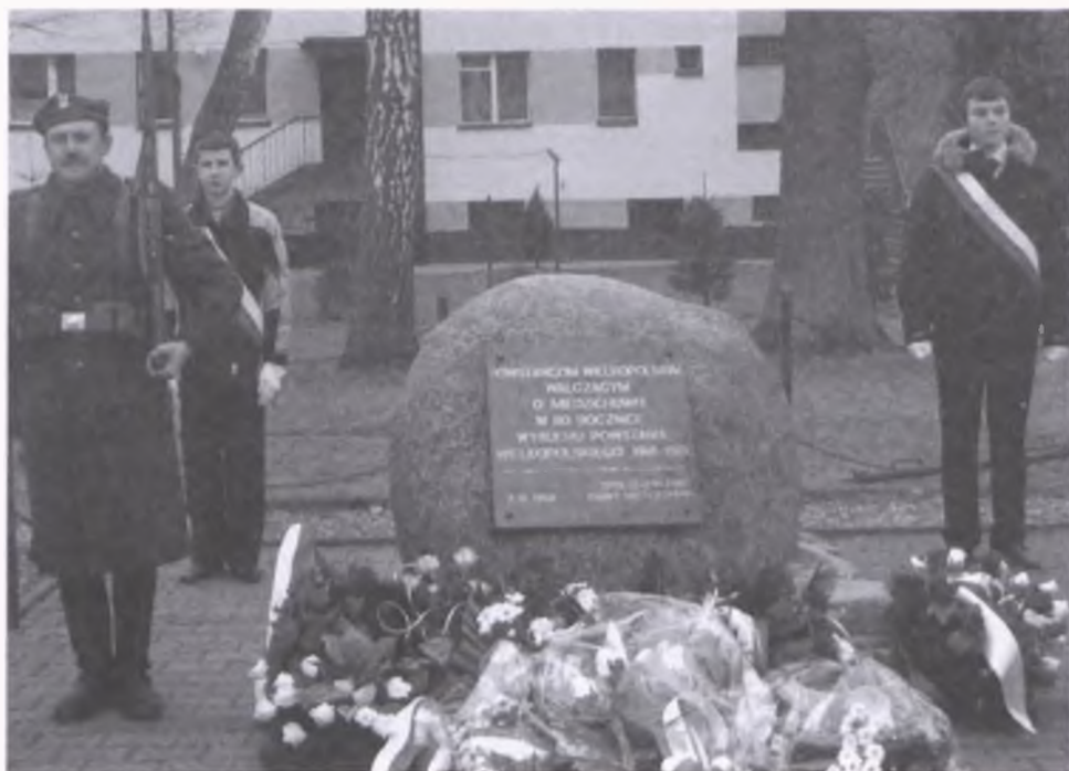
Miedzichowo - odsłonięcie obelisku 2 września 1998 r.

go Tomysła, w lewym, górnym narożu symboliczny krzyż powstańczy z rozetką i szablą.