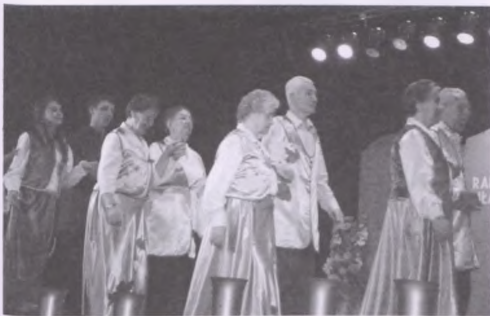
Seniorzy z Domu Dziennego Pobytu podczas tanecznego występu