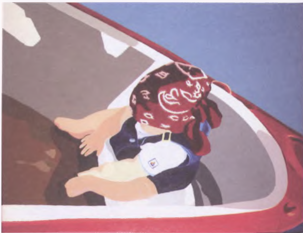
Przykład malarstwa figuratywnego - Sara