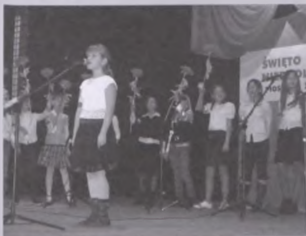
Piękne kwiaty wykonane przez uczniów Szkoły Podstawowej nr 2 w Nowym Tomysłu stanowiły element dekoracyjny - ilustracyjny do pieśni Po ten kwiat czerwony