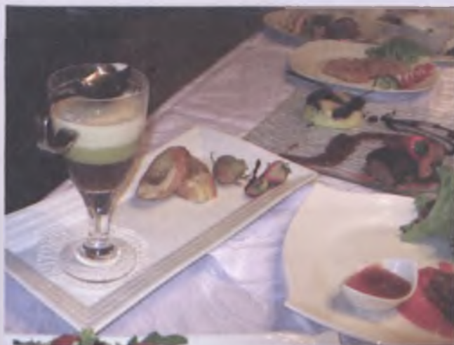
Top-serowe irish coffe