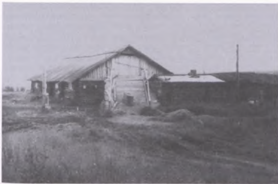
4. Typowe zabudowania miejscowe, budynek parterowy z magazynem siana i słomy na poddaszu - na które prowadzi specjalny podjazd, miejscowość Wotcza, stan z czerwca 1940 roku.

- ma oddać dwójkę dzieci obcym. Nikt, kto nie był w takiej sytuacji, nie zrozumie ani matki, ani dziecka. Nie zrozumie tragedii, jaka rozgrywała się w ich sercach. Już w drodze mama nam powiedziała - tam, dokąd was prowadzę nie będziecie już głodni, a jak tylko będziemy mogli, zabierzemy was.