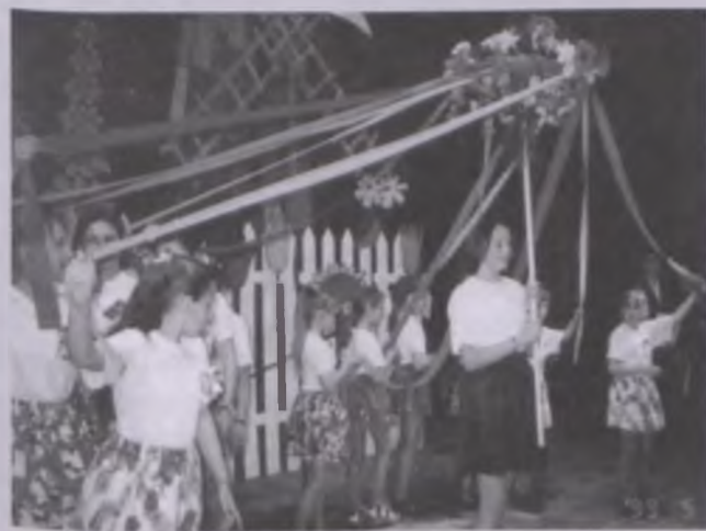
Dzieci z Wytomyśla podczas przedstawiania obrzędu powitania wiosny, Turniej Wsi w NOK-u.