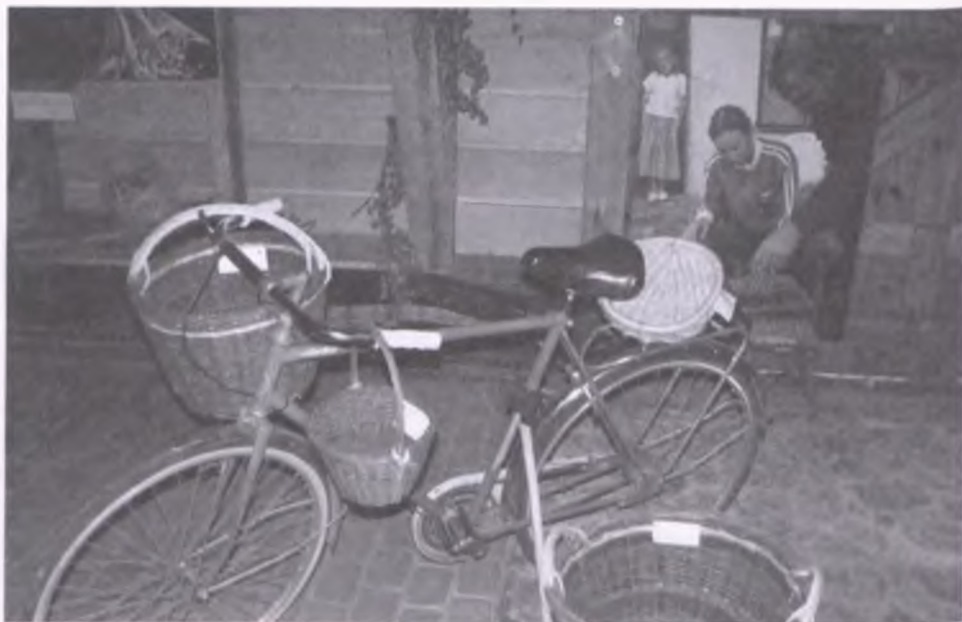
Na ekspozycję składały się zdjęcia oraz wiklinowe kosze wyplatane nad Wisłą

Sękowej. Na wystawie zaprezentowany został dorobek badań etnograficznych z zakresu plecionkarstwa, prowadzonych w ramach tego projektu. Podczas otwarcia wystawy zorganizowany został pokaz wyplatania wyrobów ze słomy. Ekspozycji towarzyszył też pokaz filmu dokumentalnego, powstałego w ramach projektu. Wystawa prezentowana była do 9 listopada, a towarzyszyły jej bezpłatne warsztaty wikliniarские przeprowadzone w dniach 23-25 października oraz 6-8 listopada.