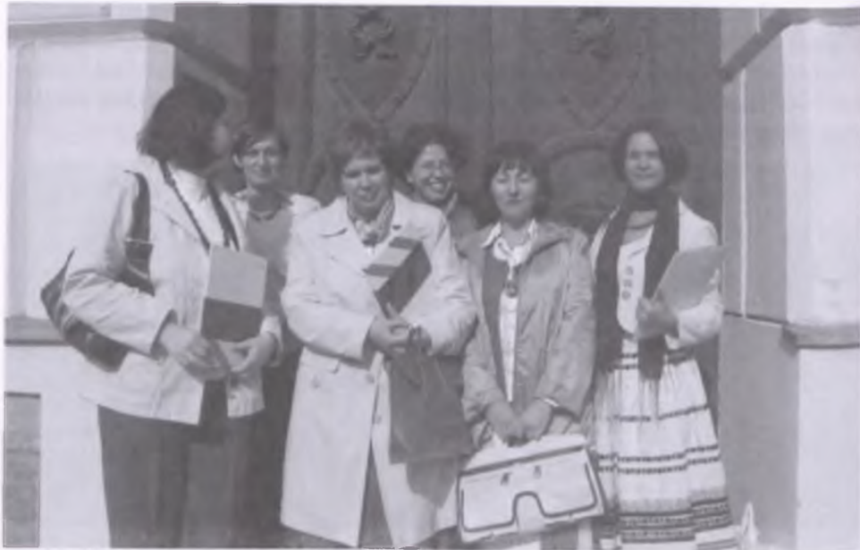
Wśród uczestników I rundy Programu Rozwoju Bibliotek znalazły się biblioteki z powiatu nowotomyskiego

leinformacyjny ufundowany przez Fundację Billa i Melindy Gatesów. Wykorzystanie tej szansy, jaką jest udział w programie, okazało się możliwe dzięki życzliwości lokalnego samorządu, bez której starania nowotomyskiej biblioteki o udział w programie byłyby bezowocne. Wsparciem unowocześniającej swe oblicze bibliotece ma służyć gminna koalicja na rzecz bibliotek, w skład której wchodzi lokalni partnerzy, m. in. przedstawiciel organizacji pozarządowej (w tym przypadku Nowotomyskiego Towarzystwa Kulturalnego) oraz pracownik Urzędu Miejskiego. W samym zaś procesie rekrutacji promowana była aktywność społeczna i kulturalna biblioteki.