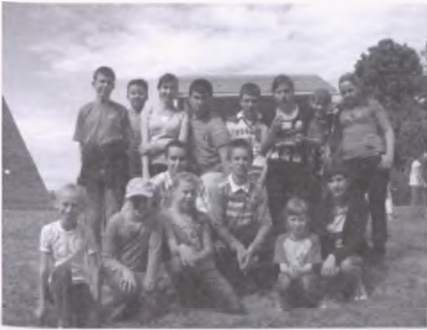
Przedstawiciele Młodzieżowej Grupy Artystycznej z uczestnikami rajdu rowerowego Mamy dzieciom , 25 maja 2008 r.

towanym na ten cel, z inicjatywy ks. proboszcza Wojciecha Szalaty, domu parafialnym przy kościele. W przypadku organizowania spotkań dla większego grona odbiorców, młodzież może wykorzystać pomieszczenia sali wiejskiej.