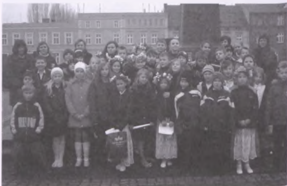
Po występie w Nowotomyskim Ośrodku Kultury dzieci wraz z opiekunami udały się pod pomnik Powstańców Wielkopolskich

Pod takim hasłem odbyły się uroczyste obchody Święta Niepodległości w Szkole Podstawowej w Wytomyślu. Dzień 9 listopada w całości poświęcony był wychowaniu patriotycznemu. Społeczność szkoły wzięła udział w montażu słowno - muzycznym,