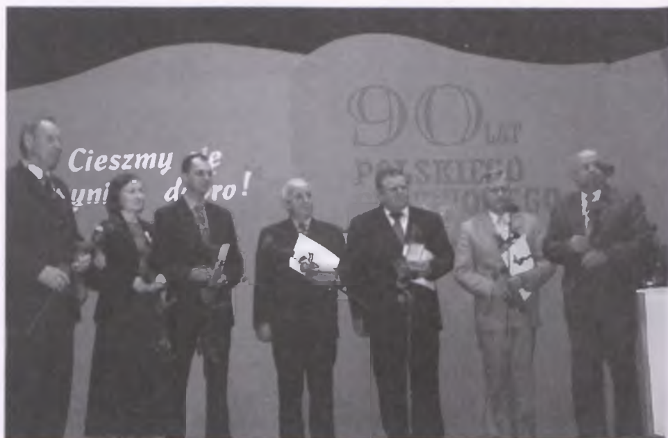
Podczas uroczystości wręczone zostały odznaczenia i wyróżnienia