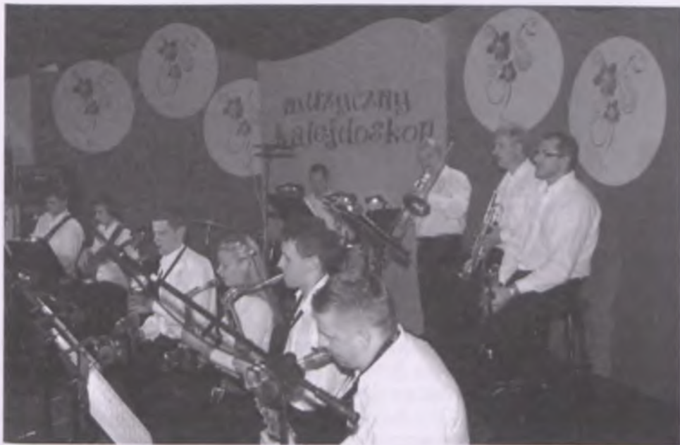
Karol Band niezawodnie od lat zaprasza do wspólnego muzykowania