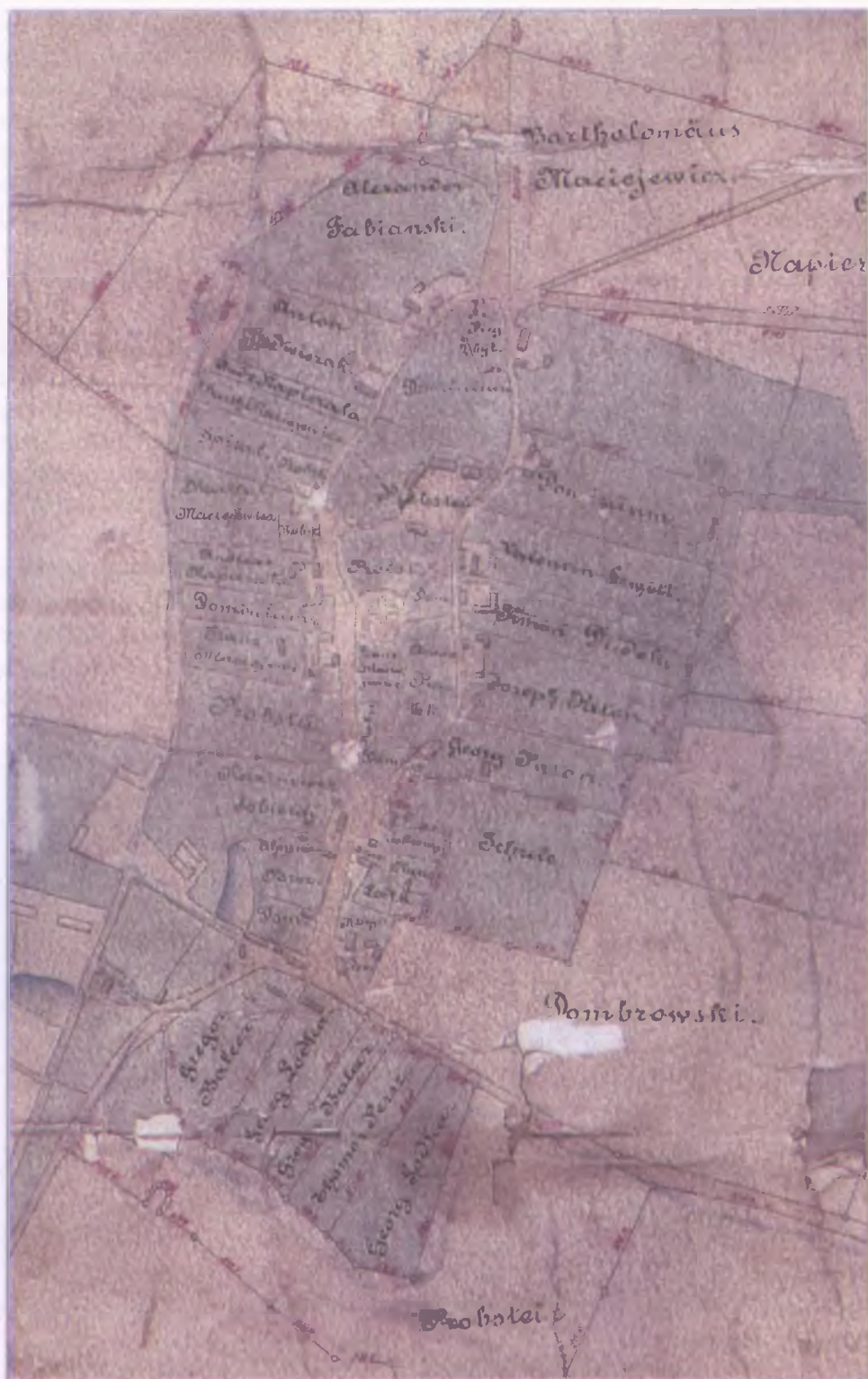
Centrum Wytomyśla na planie z 1880 r.