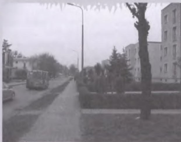
...drzewa umierają stojąc...