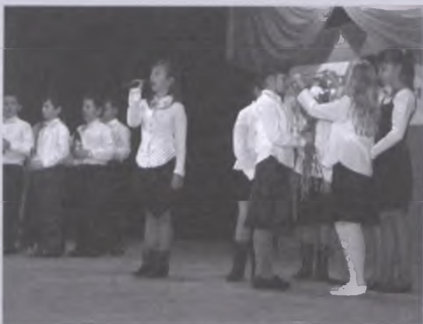
Uczniowie Szkoły Podstawowej w Wytomyślu zachwycili publiczność wykonaniem powojennej piosenki Gdzie są kwiaty z tamtych lat