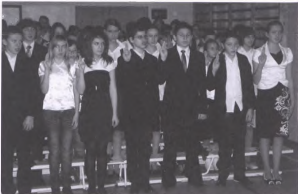
Pasowanie na gimnazjalistę – pierwszoklasiści złożyli ślubowanie i otrzymali certyfikaty