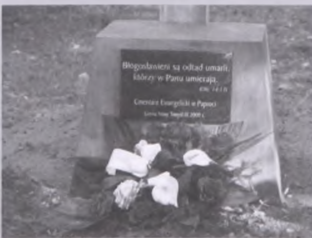
Tablica memorialna na cmentarzu w Paproci