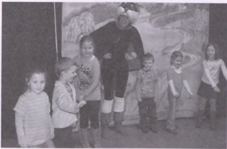
Aktorzy wprowadzili dzieci w świat bajek