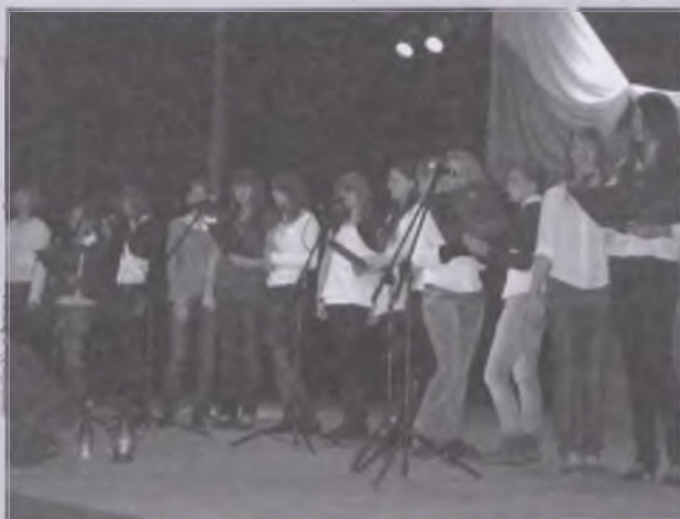
W wykonaniu nowotomyskich gimnazjalistów szczególnie pięknie zabrzmiiała znana pieśń Polskie kwiaty