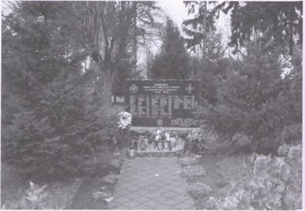
Bolewice - tablica pamiątkowa przy kościele parafialnym