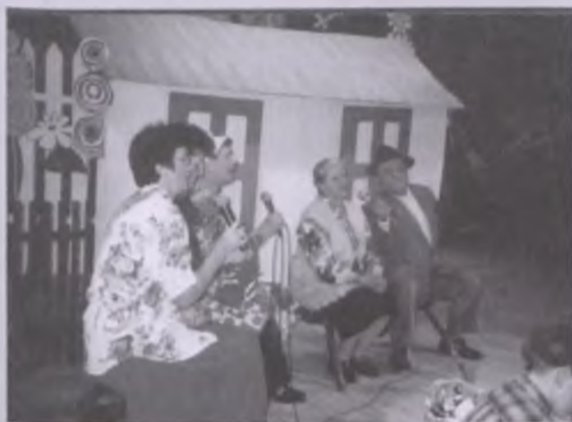
Wytomyślanie podczas konkurencji turniejowej Piosenka ławeczkowa , Turniej Wsi w NOK-u