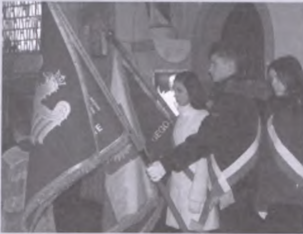
Sztandary szkolne podczas Mszy św. w kościele parafialnym - 10 lutego 2009 r.