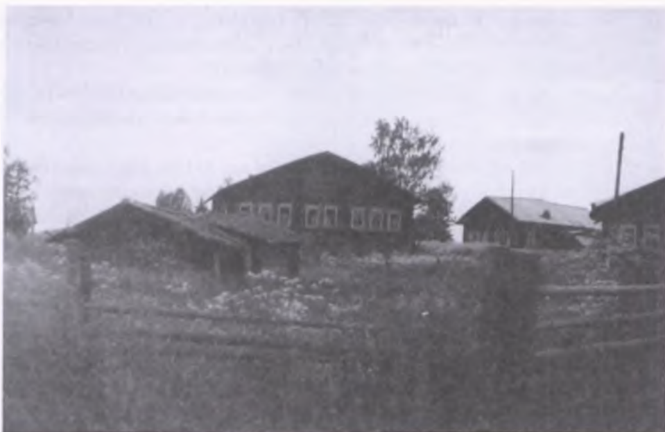
3. Widok na zabudowania w miejscowość Wotcza, w 1990 roku, kiedy wykonano to zdjęcie, wiele domów - tak jak ten na wprost na fotografii - było już opuszczonych

mniał o rodzinie. W warunkach Rosji Sowieckiej i przeprowadzanych obowiązkowych poborów do wojska, na wsiach ciągle brakowało mężczyzn do pracy, zwłaszcza, posiadających jakieś umiejętności, jak w przypadku ojca znajomość ciesielstwa. Ojciec dostał konia tylko po to, aby przywieźć swój bagaż. Tymczasem zabrał najbliższą rodzinę.