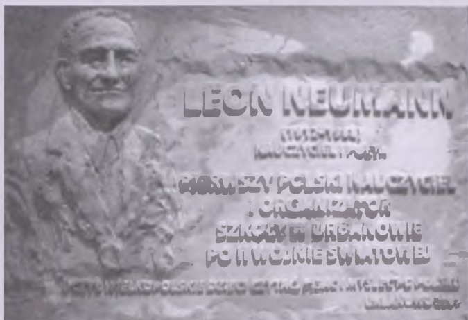
Tablica poświęcona pamięci Leona Neumanna