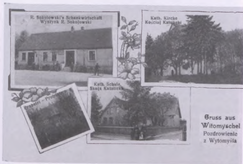
Wytomyśl na pocztówce z około 1910 r.

Pierwszy kościół, podobnie jak kolejne dwie świątynie, zbudowany był z drewna. Świątynie często ulegały pożarom lub popadały w ruinę. Ok. 1725 r. pierwszy kościół spłonął w pożarze wsi, a ówczesny dziedzic Wytomyśla Ludwik Szodrski, wojewoda poznański, odbudował na nowo świątynię (także z drewna) w 1729 r. Dzisiejszy kościół na planie krzyża zbudowany jest z cegły. W jego wzniesienie zaangażowa-