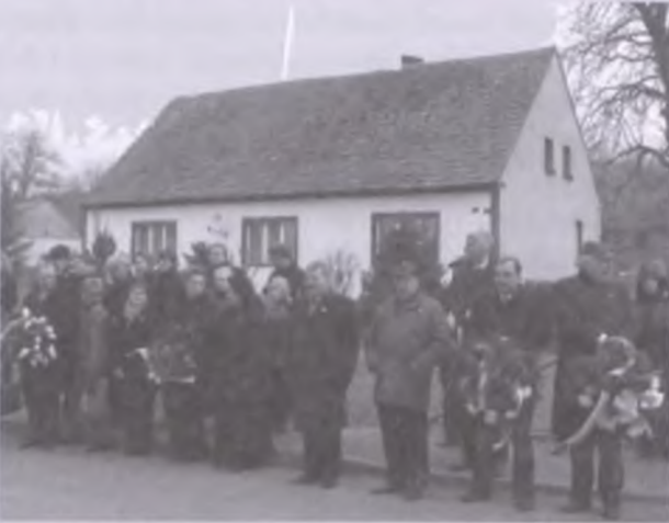
W drodze z kościoła do szkoły