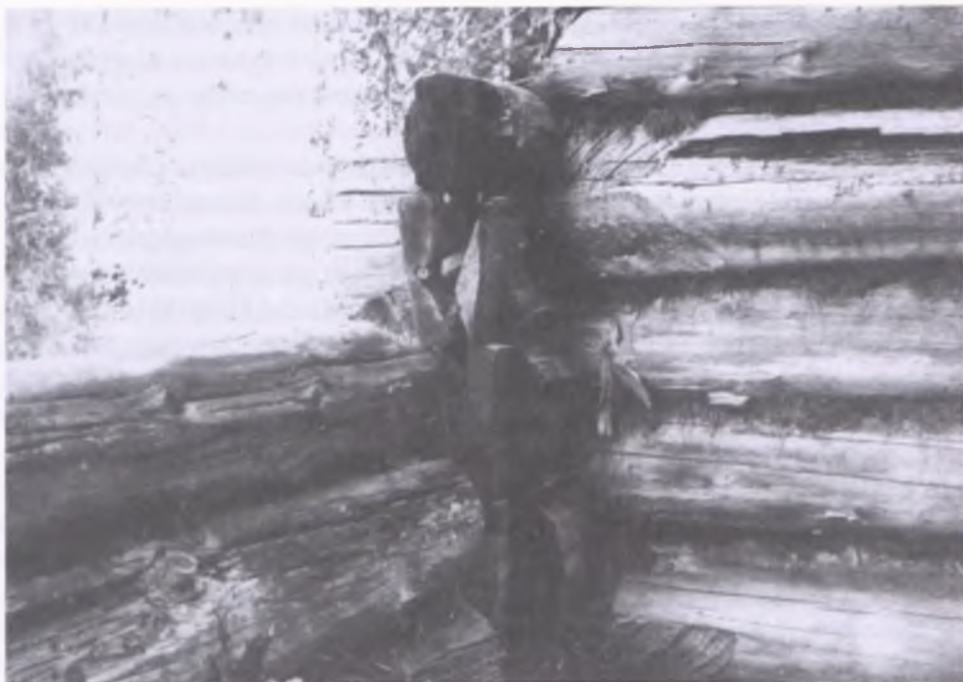
1. Konstrukcja baraku z osady pod specjalnym nadzorem NKWD - budowanych i zamieszkiwanych przez zesłańców w tajdze - stan z czerwca 1940 roku