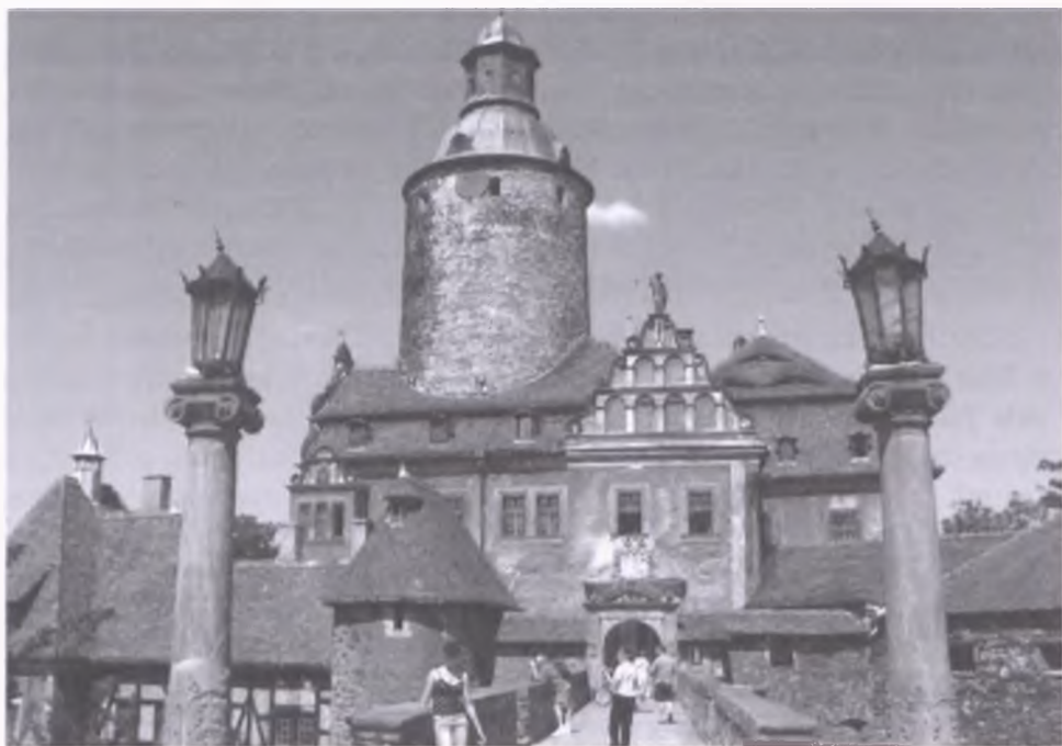
Kraj lat dziecińczych... - Lubań, na zdjęciu zamek Czocha położony nad Zalewem Leśniańskim niedaleko Lubania

ogólniak to imprezy, wygłupy. W 1985 roku wyjechałem na studia, ale kontakt z Lubaniem mam do dzisiaj, bo mieszkają tam rodzice i dwie siostry. Mam kontakt z kolegami i koleżankami.