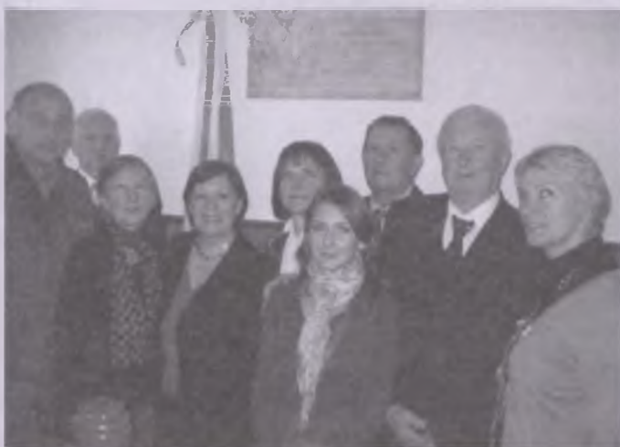
W uroczystości uczestniczyła rodzina zasłużonego nauczyciela i kierownika szkoły ...