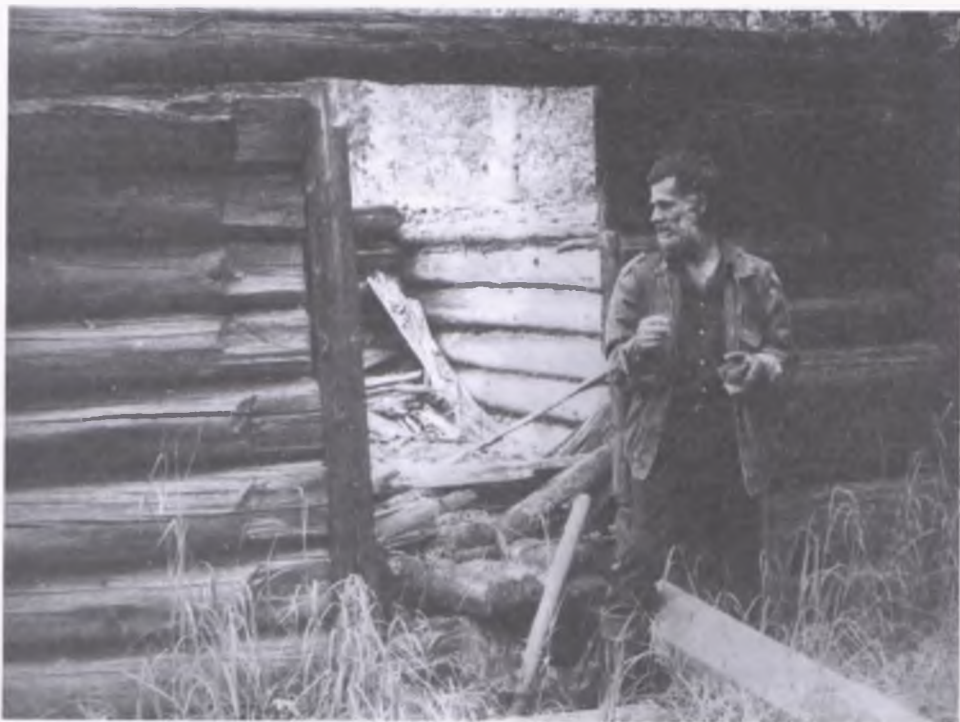
7. Autor wspomnień przy barakach w lesie, w pobliżu nie istniejącej miejscowości - przysiółka Wierch Łopju w roku 1990

naszych rodzinnych domów już nie było, te zostały zajęte przez obcych - Ukraińców, może Rosjan. My tymczasem zmieniliśmy swój status - z deportowanych, a właściwie wziętych do niewoli, na wypędzonych. Pociągiem dojechaliśmy do Kłodzka, a stamtąd dotarliśmy do Ścinawki, gdzie przyznano nam domy opuszczone przez Niemców.[...]