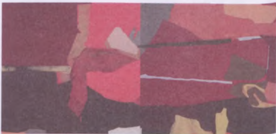
bez tytułu/olej na płótnie/ 320x135 cm