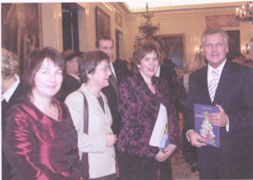
Nominacja do nagrody Prezydenta RP Sztuka Młodym była dla nas ogromnym wyróżnieniem i przeżyciem