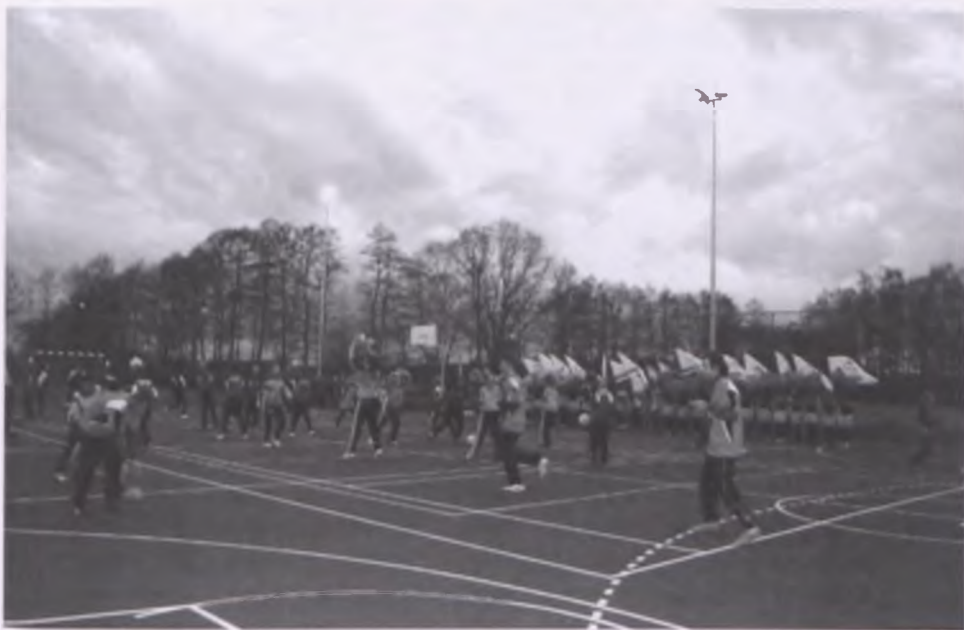
Pokaz sportowy w wykonaniu nowotomyskich gimnazjalistów zakończył uroczystość