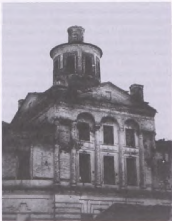
2. Wspomniana w tekście cerkiew w Wotczy - zamieniona przez bolszewików na magazyn nawozów i paliw - budynek w runie - stan z czerwca 1940 roku