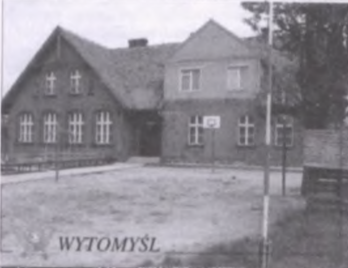
...oraz Szkołą Podstawową