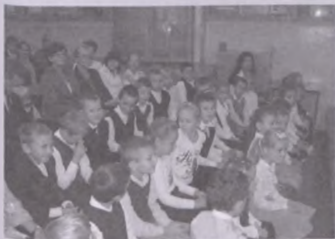
... oraz goście i uczniowie urbanowskiej szkoły