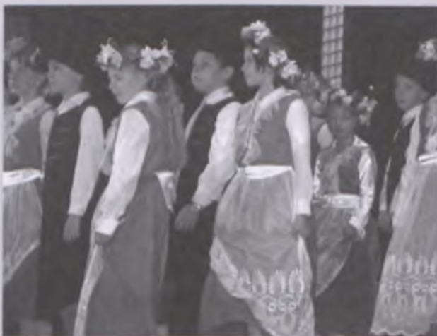
Tancerze z Wytomyślu w pięknych strojach ludowych