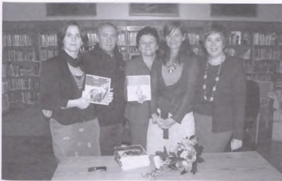
Krzysztof Wielicki był gościem bibliotecznego Klubu Miłośników Podróży Przez kontynenty

pasją jest alpinizm, którym zaraził się podczas studiów elektronicznych we Wrocławiu gdzie prężnie działał klub alpinistyczny. Podczas spotkania z klubowiczami przyznał, że na wysokościach człowiek zmaga się nie tylko z wielkim zmęczeniem, ale i strachem. Choć strach nie jest mu obcy, to nie nazywa go strachem paraliżującym, lecz kreatywnym, czyli takim, który uruchamia wyobraźnię – strachem potrzebnym i pomocnym również w wielu sytuacjach życiowych.