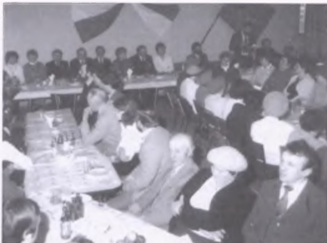
Uroczyste spotkanie w świetlicy wiejskiej z okazji 30. rocznicy reaktywowania działalności Koła Rolniczego w Wytomyślu

W Wytomyślu istnieje grupa osób, które chcą, wręcz odczuwają potrzebę, aktywizować mieszkańców na rzecz rozwoju społeczno-kulturalnego wsi. Wśród prężnie działających organizacji wymienić należy: OSP, KGW, LUKS Zenit, Caritas parafialną i Młodzieżową Grupę Artystyczną. W kalendarz wydarzeń wpisali się już corocznie organizowany Festyn Rodzinny, na którym spotykają się byli i obecni mieszkańcy Wytomyśla. Co więcej, coraz częściej pojawiają się na nim także mieszkańcy innych miejscowości. Wspólna zabawa na pewno integruje lokalną społeczność.