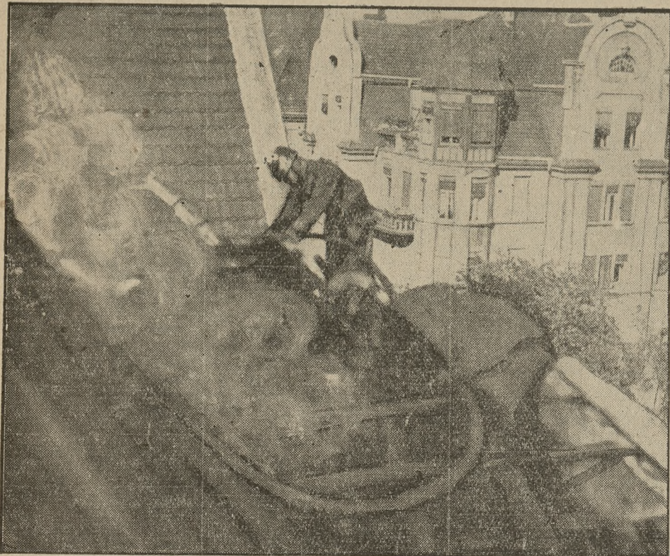
Ciężka praca strażaków, zajętych gaszeniem pożaru.

trwały kilka godzin. Straty wyrządzone przez pożar nie zostały jeszcze ustalone. Wysokość szkód ocenia się na sumę od 30 do 40 tysięcy zł. — Większe szkody powstały wskutek spalania się więzania dachu i częściowego spalania się mansard, w których ogień powstał. W rozszalałym żywiole uległy zniszczeniu akta i plany. Wielkie szkody wyrządziły również strumienie wody, którymi gaszono pożar. (k)