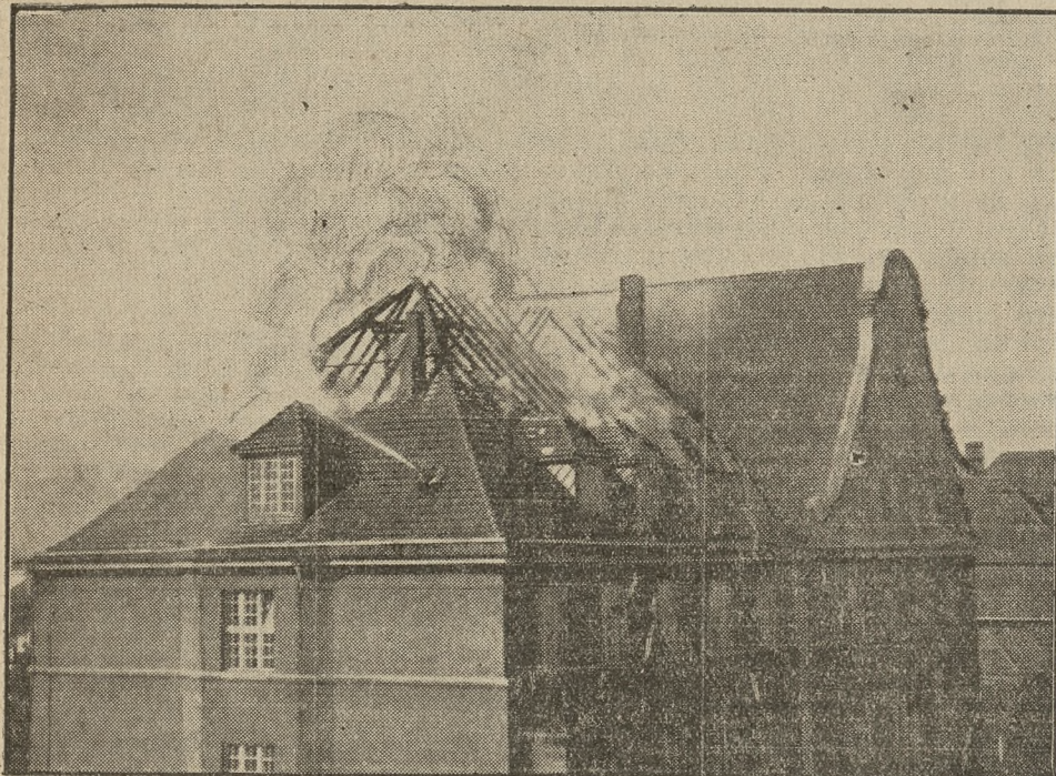
Na fotografii widzimy belkowanie dachu, trawione pożarem