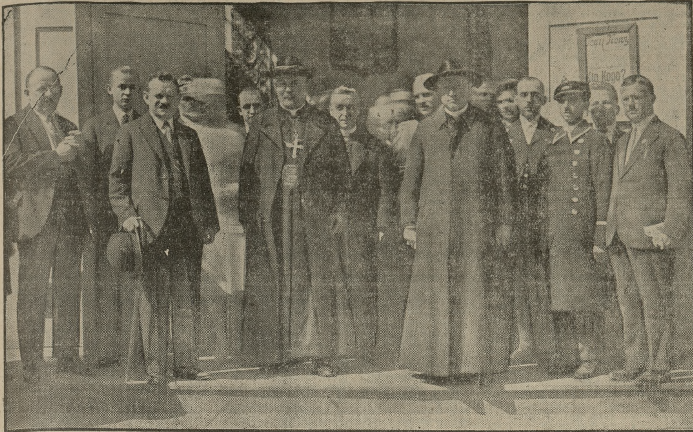
W dniu wczorajszym na P. W. K. obecny był Kardynał monachijski ks. dr. Faulhaber. Na fotografii naszej widzimy Dostojnego Gościa w towarzystwie ks. Prymasa dr. Hłopa i generalnego dyrektora P. W. K. dr. Wachowiaka przed pawilonem samorządowym.