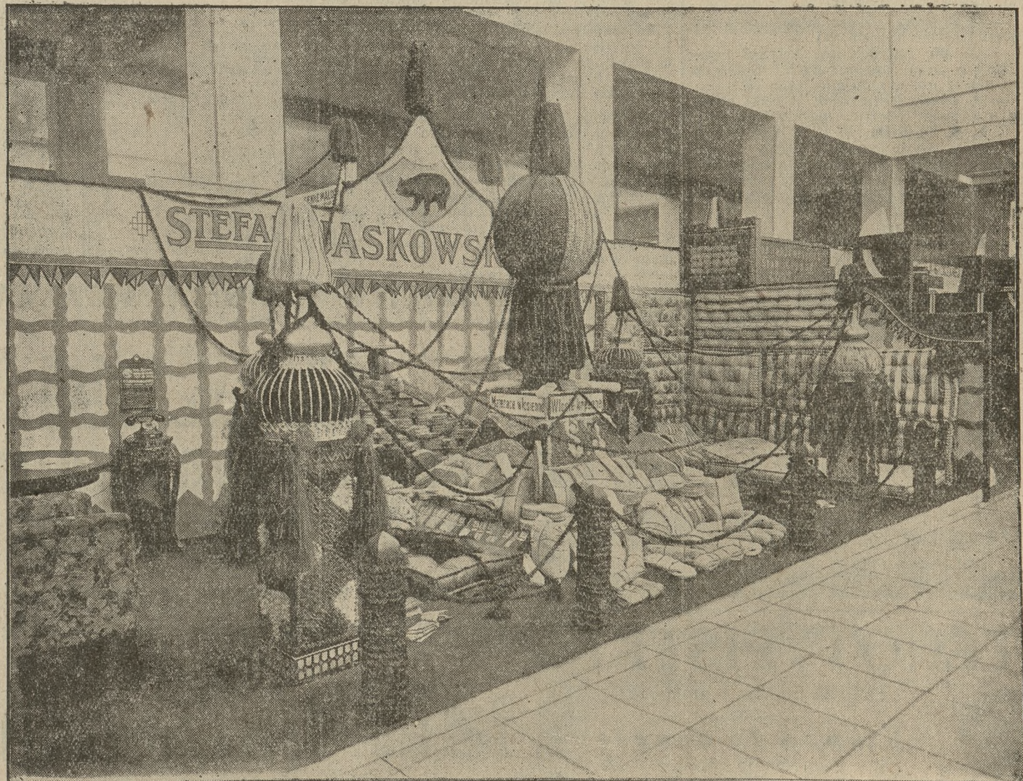
Stoisko firmy S. Jaskowski w Rawiczu, w hali konfekcyjnej na P. W. K., jedynej fabryki polskiej, produkującej wyroby z włosia końskiego.

Na otwarciu Targów Hodowlanych w dniu 20 września r. b. obecnych będzie kilku ministrów rolnictwa z szeregu państw europejskich.