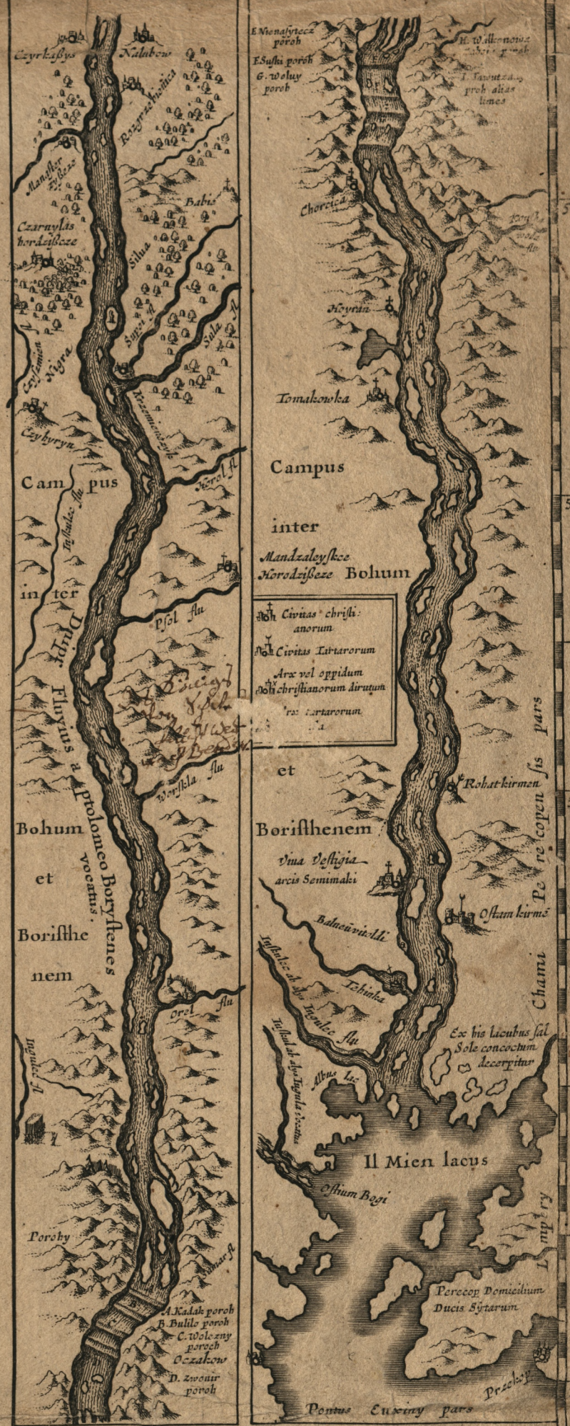
Scala milliarum ad hunc tractum Borissonen pertinens

PALVDIVS POLESIAE In hac paludibus sita sunt plurimum reperitur in loca adeo copiosissima reperitur magna in altitudine in hunc mare lacs fovant propter quod sita sunt quae sunt in horum lacuum ditionem verum non sic ut verum in non se totum capi ne latet quoniam distat ab alio alio amantibus numerosis paludibus punctis angustis in se truncis Nam si distat hae loca ut circuitus dicitur cognoscitur officium ut fluvius qui non minus 50 miliaribus Graecis rivis in se truncis distat in 120 miliaribus circuitus