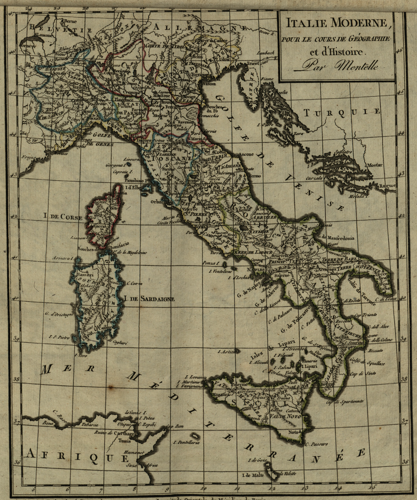
Longitude Orientale du Méridien de Paris.