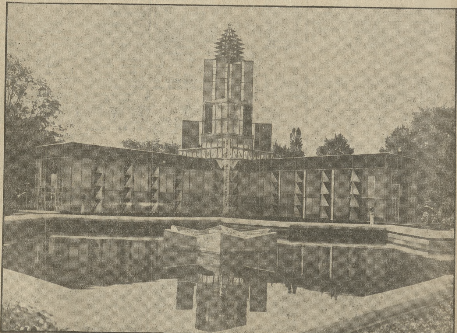
Pawilon hut szklanych przegląda się w gwiaździstym basenie nieczynnego przez chwilę wodotrysku, jednej z wielu ozdób Parku Wilsona.