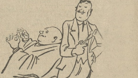
Fryzjer (roztargniony). — Ostrzyc szanownego pana? Klient: nie — zebrał włosy w warkocz i związać rózową wstążeczką. (London Opinion) S. F.