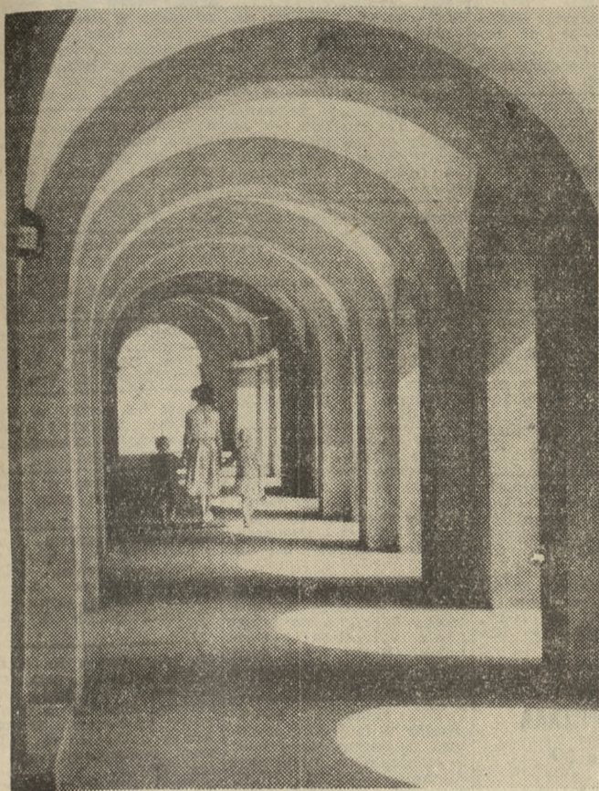
Piękno zabytkowych staromiejskich kamieniczek polega nie tylko na ich kolorowych tynkach i ozdobnych obramowaniach okien lub bram. Ileż uroku ma w sobie taki właśnie kryty ganek.