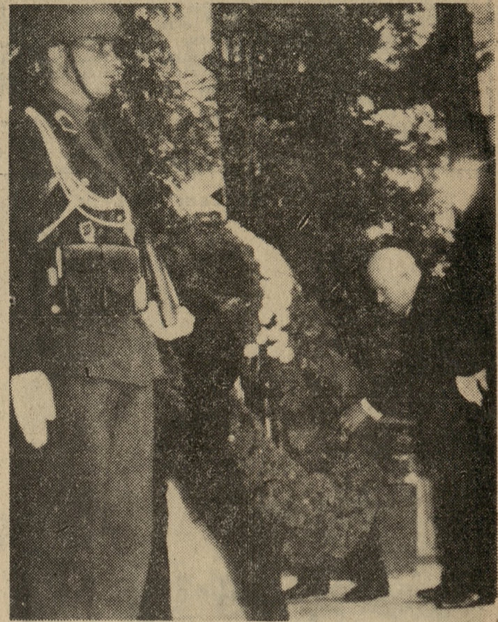
Na zdjęciu: Premier N. S. Chruszczow składa wieniec na Grobie Żołnierza w Wiedniu.

W piątek, 1 lipca br. o godz. 9.30 czasu miejscowego, rozpoczęły się w gmachu rządowym na Ballhaus Platz rozmowy między przewodniczącym Rady Ministrów ZSRR — N. S. Chruszczowem, a członkami rządu austriackiego, z kanclerzem federalnym — J. Raabem oraz wicekanclerzem — B. Pittnermannem na czele.