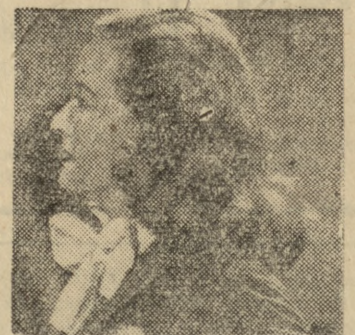
Betty Davis w filmie prod. amer. pt. „Wszystko o Ewie”

APOLLO — ul. Ratajczaka — g. 10, 12.30, 15.45, 18, 20.15 — „Madame De...” (franc. 18 l.) CZTERNASTKA — ul. Świerczewskiego — g. 9, 11.45, 14.30, 17.30, 20.30 — „Wszystko o Ewie” (USA 18 lat)