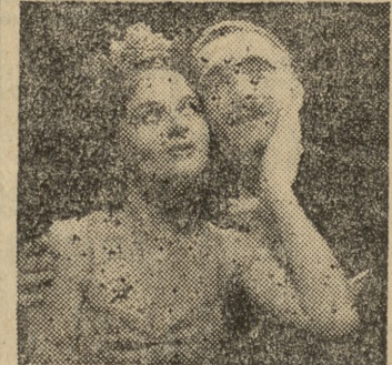
Scena z III aktu operetki „Fajerwerk”

W POZNANIU: OPERA — ul. Fredry — g. 19 — „Aida” (koniec około g. 22) POLSKI — ul. 27 Grudnia — g. 19 — „Faust” (koniec ok. g. 20.50) NOWY — ul. Dąbrowskiego — g. 19 — „Pierwszy dzień wolności” (koniec około g. 22) OPERETKA — ul. Niezłomnych — g. 19 — „Fajerwerk” (koniec około g. 22)