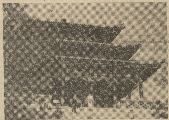
Cesarski ogród w Pekinie. Pagoda „Wiecznej wiosny” w parku „5-ciu pagód”.