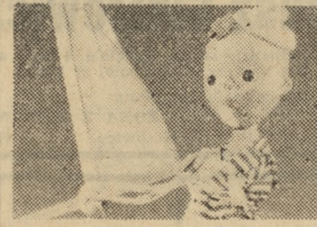
Scena z przedstawienia „Tomcio Paluszek“

W POZNANIU: OPERA — ul. Fredry 9 — g. 19 „Aida“ POLSKI — ul. 27 Grudnia — g. 19 „Śmierć komiwojzera“ NOWY — ul. Dąbrowskiego — g. 19 „Osiol i cień“ OPERETKA — ul. Niezłomnych — g. 19 „Fajerwerk“ SATYRY — ul. Armii Czerwonej g. 20 „Kobieta jest diabłem“ MARCINEK — ul. Armii Czerwonej — g. 16.30 „Tomcio Paluszek“