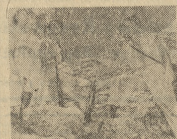
Scena z filmu „Skarby króla Salomona”

APOLLO — g. 10, 12.30, 15.30, 18 i 20.15 „Skarby króla Salomona” (amer. 10 l.)