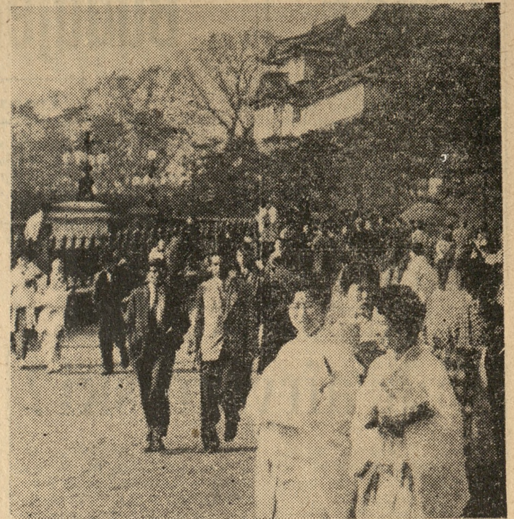
Na zdjęciu: spacer w parku przy Pałacu Cesarskim. Obok europejskich ubrań charakterystyczne odzienie niewiast. A wszystko to bardzo malownicze.