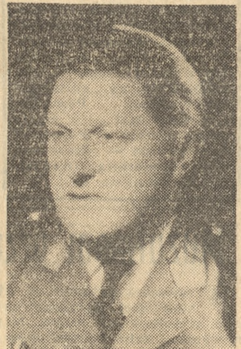
Dowódca francuskich sił lądowych Algierii gen. Jean Crepin