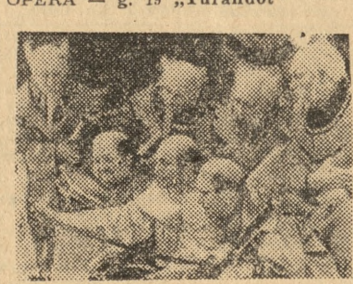
Scena z opery „Turandot” — G. Pucciniego

POLSKI — g. 16 „Lampa Allady-na” (bajka) NOWY — g. 19 „Osioł i cleń” OPERETKA — g. 19 „Fajerwerk” MARCINEK — g. 16.30 „Tygrys tańczy dla Szu-Hin” STUDIO (Dom Drukarza) — g. 17 „Królewna Snieżka” (bajka);