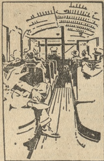
Przestronne wnętrza zapewnia podróżnym najbardziej współczesny komfort