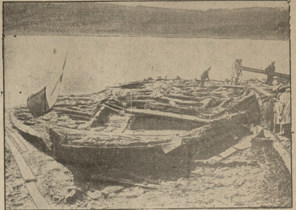
Jedna z galer cesarza Kaliguli, wydobyta ostatnio z dna jeziora Nemi