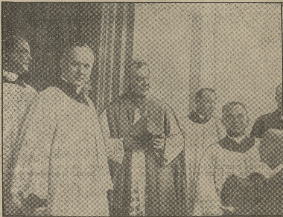
Na stopniach pałacu X. Prymasa