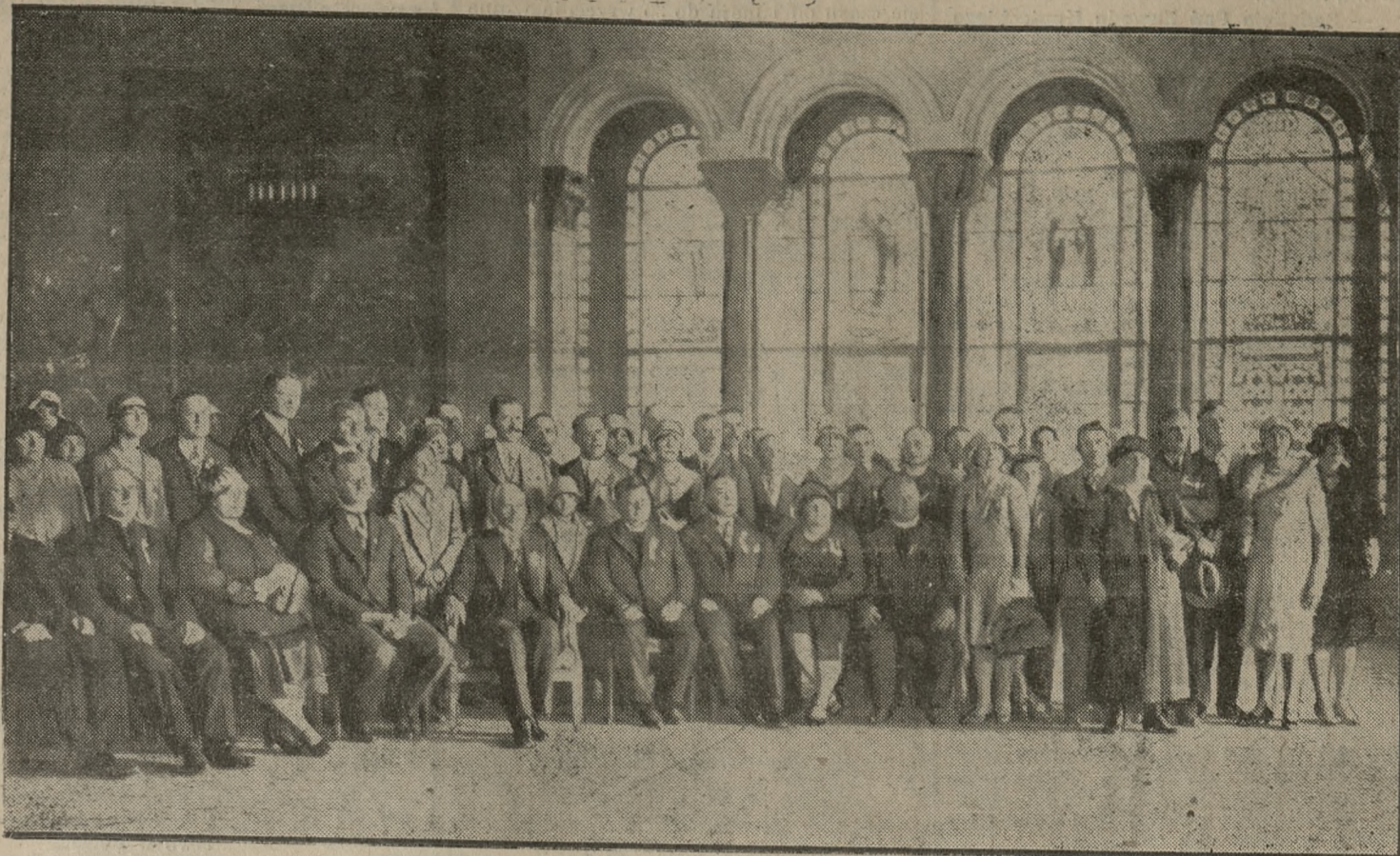
Wycieczka Zjednoczenia Polskiego Rzymsko-Katolickiego na zamku w Poznaniu