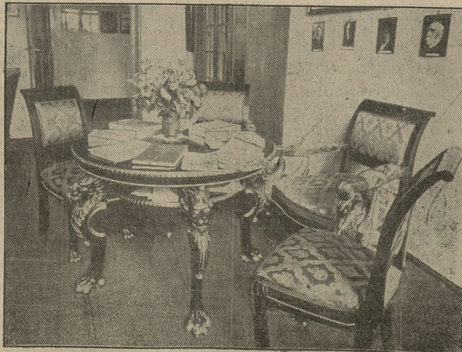
Stylowe meble, wykonane przez uczniów zawodowej szkoły OO. Salezjanów w Oświęcimie

Oryginał takiej ulotki przesłano do ministerstwa spraw zagranicznych w Warszawie, celem zainteresowania w tej sprawie rządu niemieckiego.