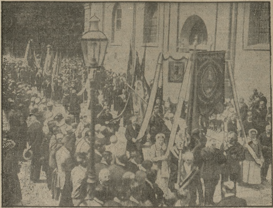
W pochodzie procesyjnym z Katedry do pałacu X. Prymasa