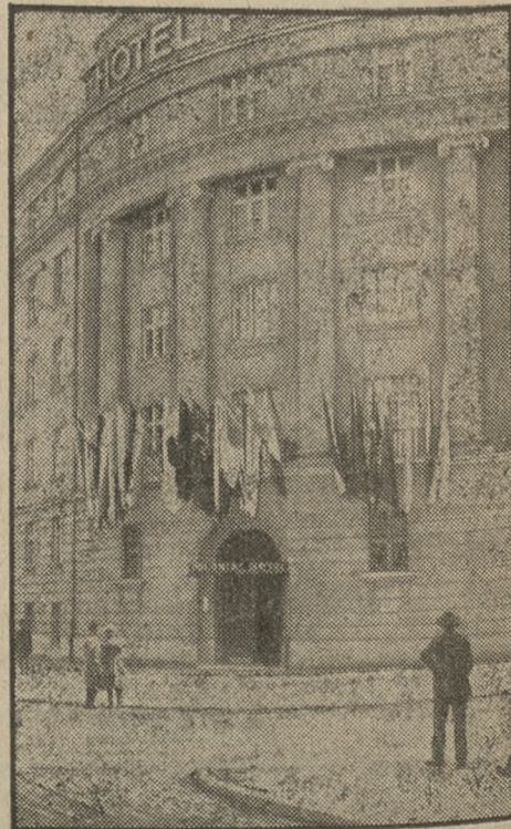
Z balkonu hotelu wystawowego „Polo- nia“ powiewają zagraniczne sztandary.

„Prager Presse“ zaznacza także, że miasto Poznań jest w pełni świadome, jak uroczyste chwile przeżywa, i dumne jest z dzieła ukończonego po dwuletniej, twardej pracy.