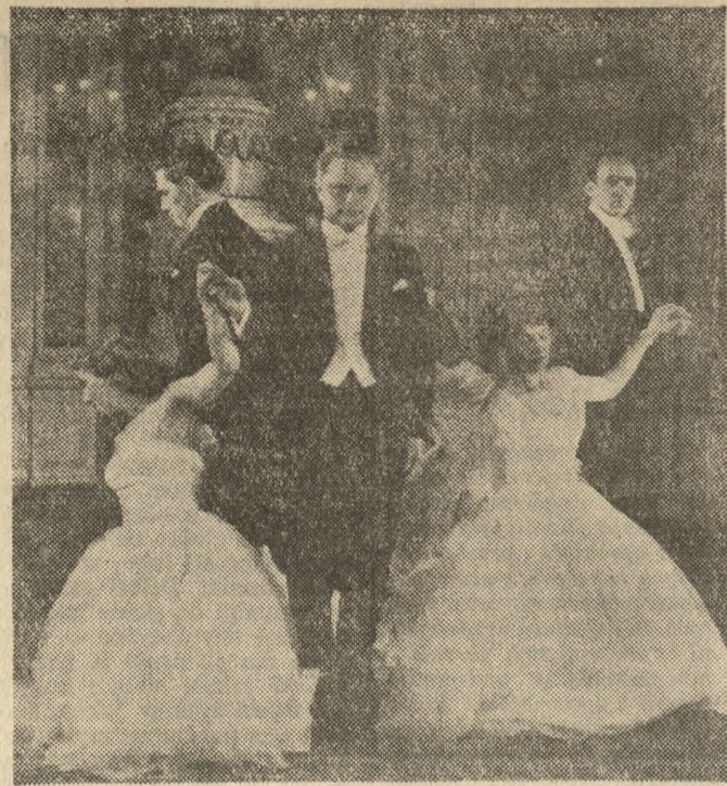
W skład polskiej grupy artystycznej na Festiwal w Moskwie weszła między innymi 8-osobowa grupa tańca towarzyskiego Wojewódzkiego Domu Kultury w Krakowie, prowadzona przez prof. Wiczyńskiego.

Tymczasem normy zużycia węgla, które nas najbardziej w tym miejscu interesują, kształtują się dość zastanawiająco. Holownik ciągnący barki z ładunkiem 900 ton, poruszający się z szybkością ok. 4 km na godzinę (pod prąd) spala 250—300 kg węgla. Z prądem natomiast przy tym samym ładunku porusza się z szybkością 10—12 km na godzinę i spala tylko 150 kg węgla. W pierwszym wypadku kilometr jazdy pochłania 60 kg węgla — w drugim 15—18 kg węgla. Parowóz natomiast, ciągnąc 570 ton ładunku (waga własna zestawu łącznie z towarem 1000 ton) zużywa w poznań-