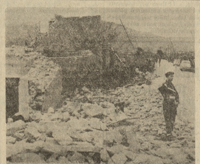
KATASTROFALNY CYKLON WE WŁOSZECH

Niezawodnie błędem byłoby mieć rolę dzisiejszej Europy, przykrawając ją do 6 państw kadubowego tworu, lecz bodajże większym jest błędem byłoby przyznawać jej stare miejsce w świecie. Zmieniły się bowiem wymiary tego kontynentu w sensie znaczenia Europy w wielkim koncercie polityki światowej. Zmienił się ciężar gatunkowy kontynentu, zamieszkałego przez ludność mniejszą liczebnie niż Indie, nie mówiąc już o przeszło półmiliardowych Chinach. Proporcje między