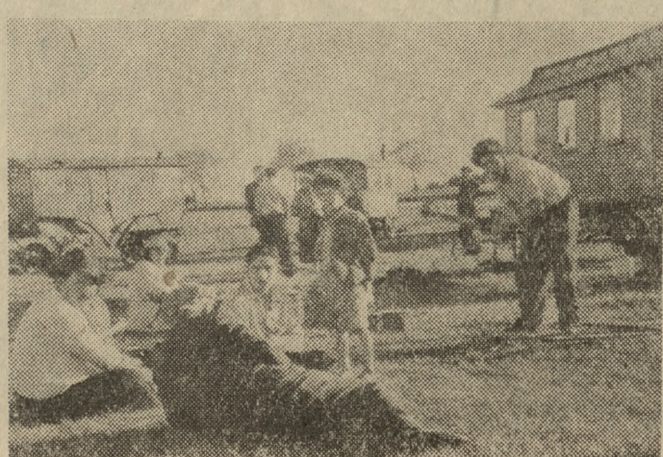
Nad jeziorem w malowniczej okolicy spotykamy tabor cygański. Cyganie przygotowują się właśnie do wieszery.