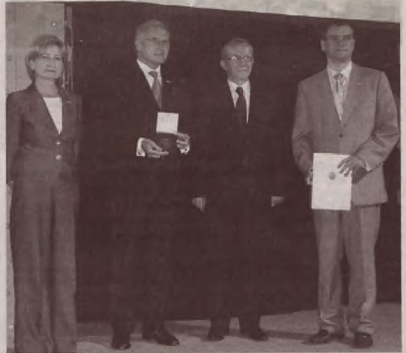
Nagrodę Prezesa Krajowej Izby Gospodarczej za doskonale wyniki w polityce eksportowej dla firmy Profim wręczono podczas Międzynarodowych Targów Mebli, Akcesoriów i Wyposażenia Wnętrza.

Celem Konkursu jest wyłonienie i promowanie najlepszych producentów i firm w branży meblarskiej, mających bardzo dobre osiągnięcia w eksporcie. Współorganizatorem Konkursu są Międzynarodowe Targi Poznańskie oraz tygodnik „Rynki Zagraniczne”. Aj