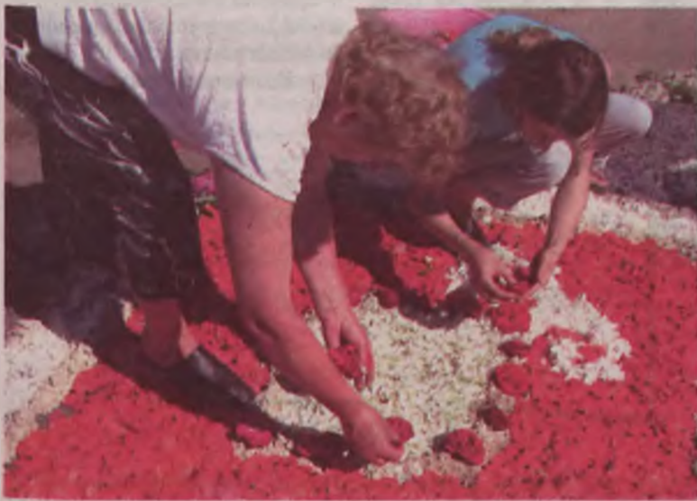
W czasie, gdy rozpoczęły się już obchody święta mieszkańcy wsi dopiero kończą układać kwietne dywany

nowym w Kitzbühel w 2006 roku. Podczas koncertu, wykonał przede wszystkim utwory Jana Sebastiana Bacha, które doskonale brzmią, a także pokazują niemalże wszystkie możliwości tego instrumentu.