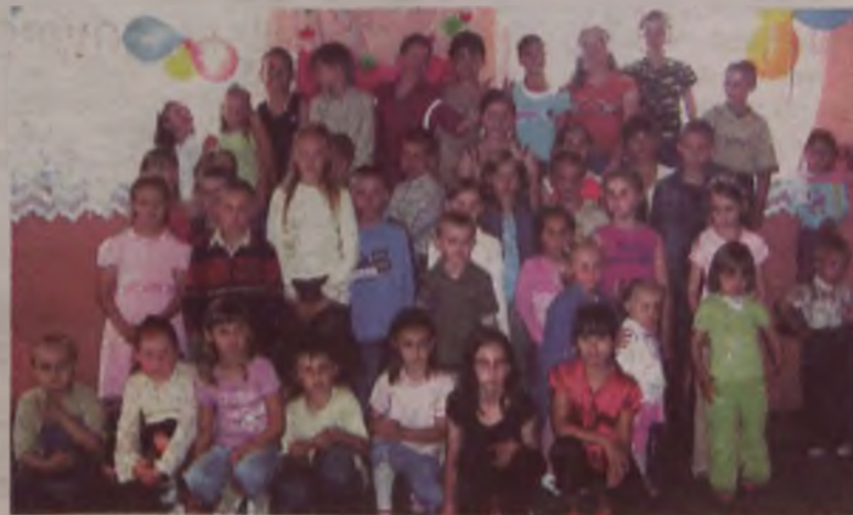
Dzieci biorące udział w zabawie w Czachulcu

Działacze czachuleckiego Stowarzyszenia są przekonani, że dzięki dużemu zainteresowaniu taką formą rozrywki ze strony mieszkańców sołectwa, uda im się zorganizować jeszcze wiele takich zabaw i festynów integracyjnych. (can)