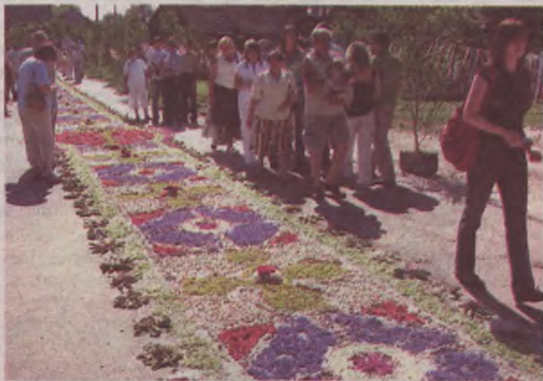
W dzień Bożego Ciała do Spycimierza od lat przybywają pielgrzymki z całego kraju i zagranicy. Takich dywanów kwietnych próżno szukać w najodleglejszych zakątkach świata.

Młodzi aktorzy wystąpili w strojach, które noszono w latach 1006-1008, na które datuje się początki parafii. W święcie wzięła udział także lokalna Orkiestra Ochotni-