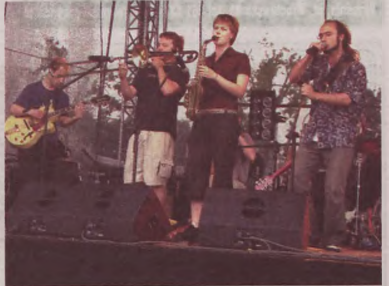
Występ zespołu „Pali się” ze Zgierza był muzyczną niespodzianką. Młodzi artyści zostali dobrze przyjęci przez publiczność.