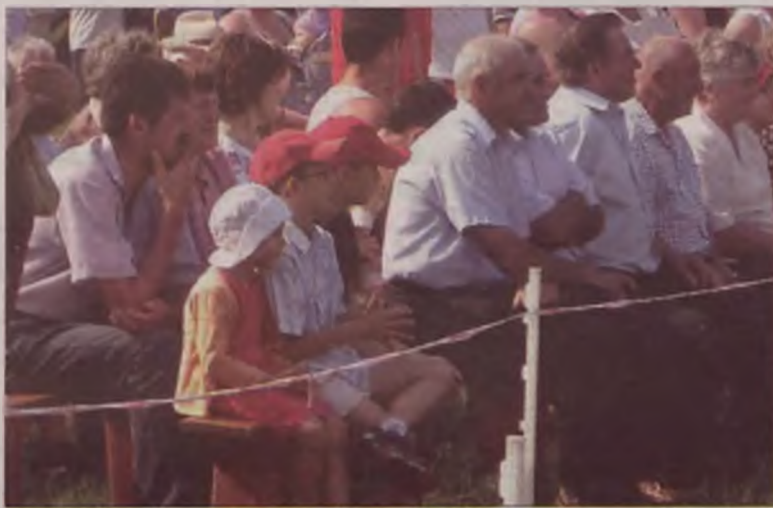
Zawody w Kawęczynie cieszą się niesłabnącą popularnością.

W przerwie zawodów obejrzeć można było pokaz kucia koni i wysłuchać koncertu orkiestry dętej Ochotniczej Straży Pożarnej w Tokarach. Orkiestrze towarzyszył oddział marzonetek, który popisywały się efektowną musztrą paradną.