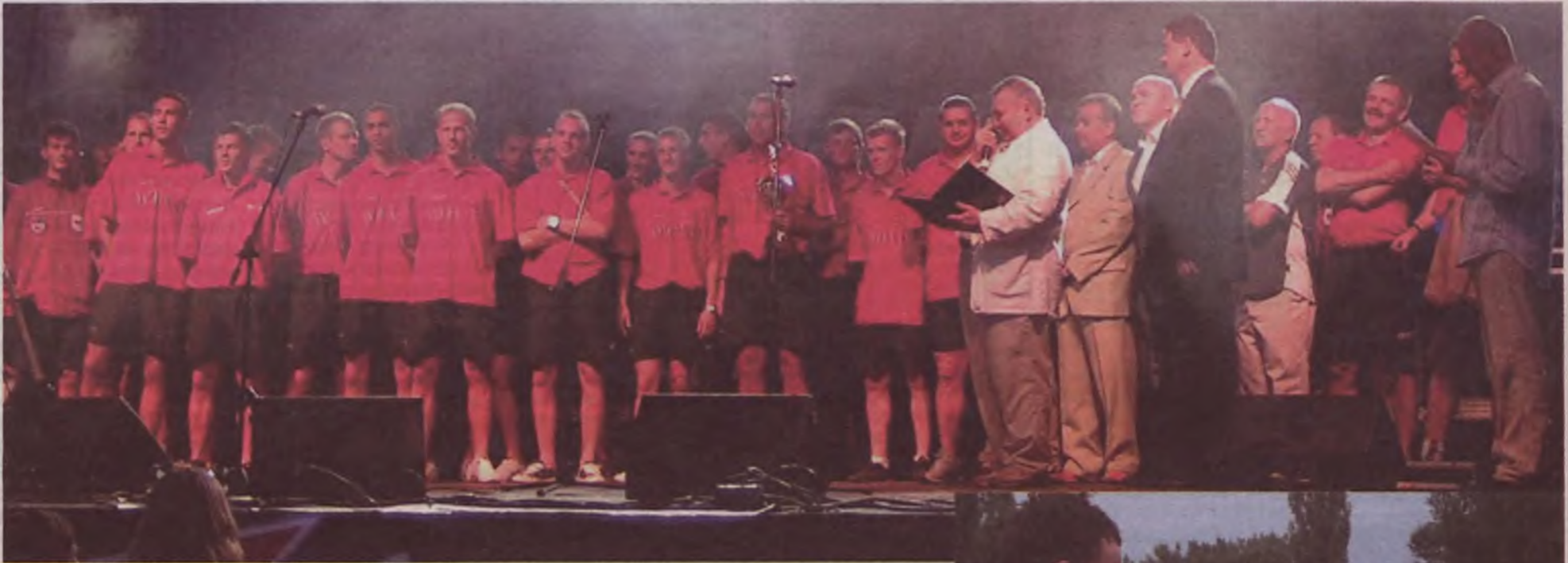
Pilkarze, trenerzy i działacze MKS Tur Turek byli gośćmi władz samorządowych miasta i powiatu podczas obchodów Dni Turku.

Nowo kreowany drugoligowiec swój ostatni mecz trzecioligowy rozegrał na wyjeździe w Gnieźnie, gdzie w minioną sobotę Tur podzielił się punktami z miejscowym Mieszkem. Było to 288 spotkanie Tura na boiskach III ligi. Ogólny bilans to 96 zwycięstw, 66 remisów, 126 porażek, 339 goli zdobytych i 459 straconych.