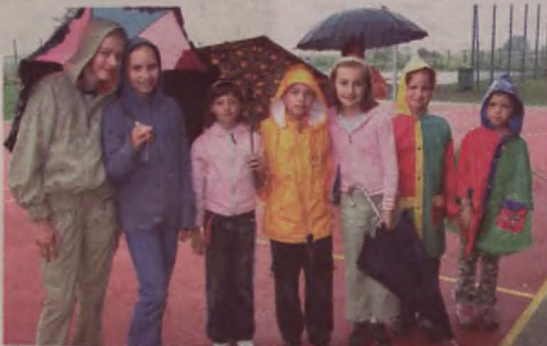
Dzieci z osiedla Muchlin długo czekały na plac do gier. Nic więc dziwnego, że na jego otwarcie przyszły mimo padającego deszczu.

go rozpocznie się kolejna podobna inwestycja. Tym razem będzie to plac zabaw na Osiedlu Wyzwolenia, budowany wspólnie ze Spółdzielnią Mieszkaniową „Tęcza”. AZ