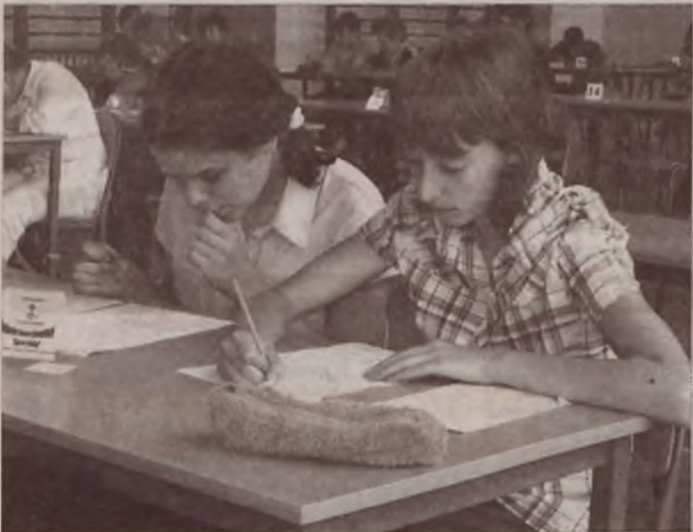
W Gimnazjum nr 1 spotkali się najlepsi matematycy z gimnazjów z rejonu konińskiego.

Ponad 50 gimnazjalistów z dwunastu miejscowości regionu konińskiego uczestniczyło w czwartym już Konkursie Matematycznym „Czas na szóstkę”, jaki w środę, 6 czerwca odbywał się w Gimnazjum nr 1 im. Lotnictwa Polskiego w Turku.