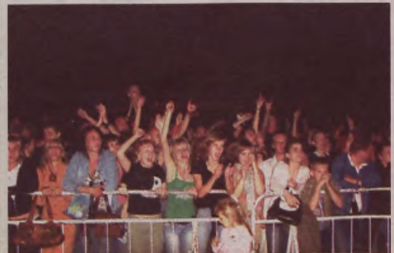
Na koncertach podczas Dni Turku bawilo się kilka tysięcy osób. Przyjechali z różnych stron kraju, a nawet z zagranicy.