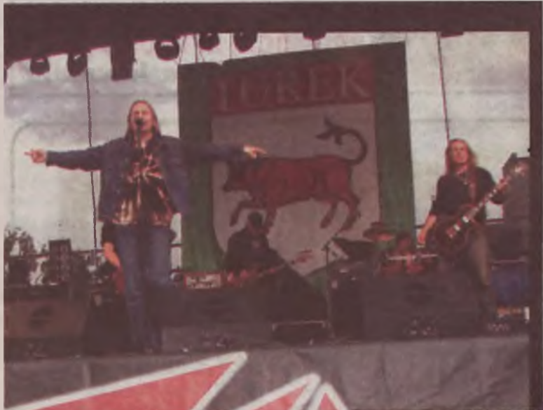
TSA to legenda muzyki rockowej. Mimo że zespół dobiega trzydziestki zagrał w sobotę świetny koncert.

– TSA jest doskonałym zespołem i poradzi sobie w każdej sytuacji, lecz uważam, że dwa lata temu koncert zrobił na mnie lepsze wrażenie. Być może felerem jest, że w trakcie dzisiejszego koncertu było jeszcze widno i w związku z tym nie było odpowiedniego nastroju. M i m o