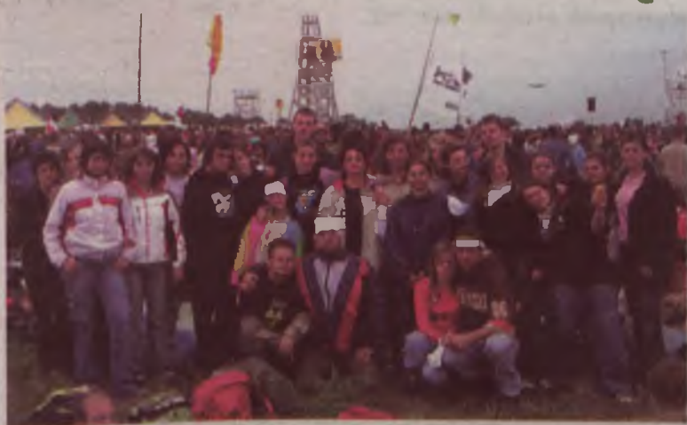
Grupa z Kaczek i Władysławowa z katechetami na lednickich polach

Nie sposób jest opisać klimatu zabawy, tańca i uwielbienia dla Boga połączonego z ciszą spoko-