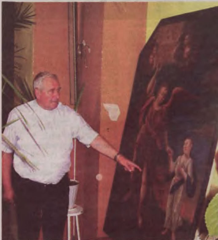
Ksiądz dziekan z dumą pokazuje znacznych rozmiarów obraz anioła z Tobiaszem

na drugiej święta Barbara i święta Rozalia. Zdaniem księdza dziekana, pochodzą one najprawdopodobniej z rozebranego przez Niemców kościółka świętej Barbary. Nie wyklucza jednak, że mogły być na wyposażeniu poprzedniego kościoła parafialnego, na którego miejscu stanął w 1912 roku obecny.