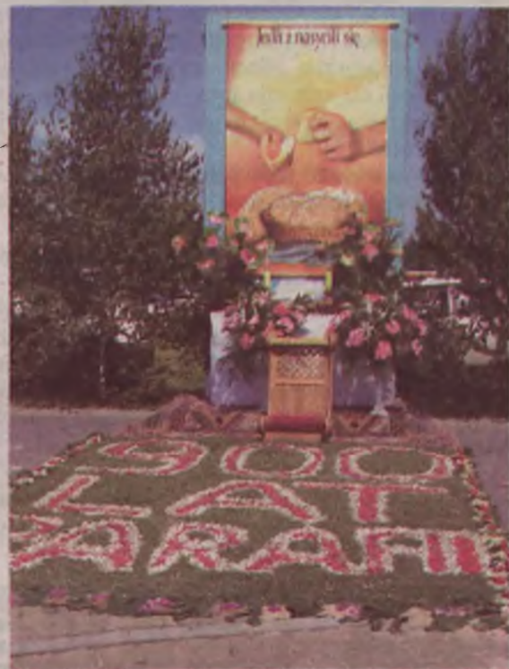
Jeden z ołtarzy na drodze procesji tematycznie nawiązywał do obchodów 900-lecia istnienia parafii