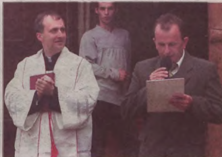
Sołtys powitał, a proboszcz pobłogosławił