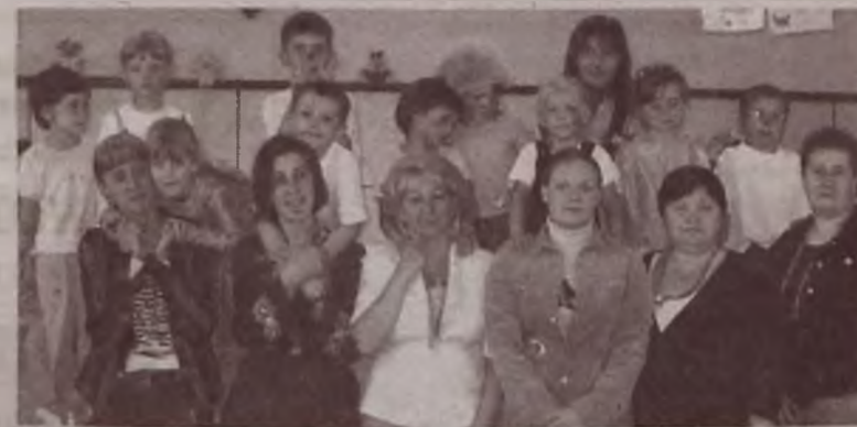
Dzieci z „Eureki” i ich kochane mamusie.