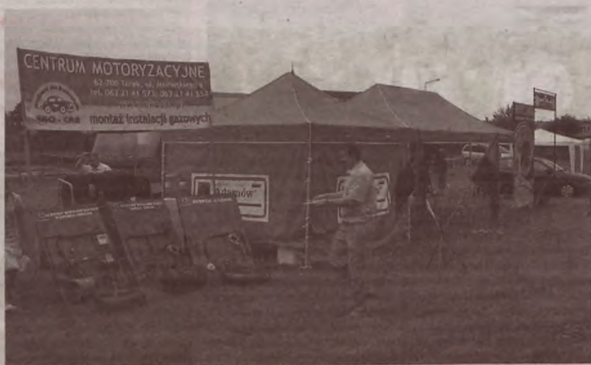
Ulewny deszcz i burza skutecznie odstraszyły turkowskich od udziału w Dniu Przedsiębiorcy.

Pomijając już nawet niezbyt obszerną listę firm, które zdecydowały się na zorganizowanie swoich stoisk na Dniu Przedsiębiorcy, to wydaje się, że najwyższy czas, aby w TIG poważnie przemyślano spr-