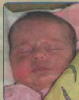
...Szcudrowska córka Małgorzaty i Grzegorza ur.4 czerwca, godz.10.35 waga 4100, długość 59cm