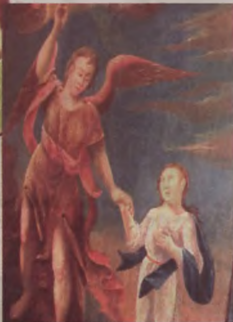
Anioł z Tobiaszem w całej okazałości