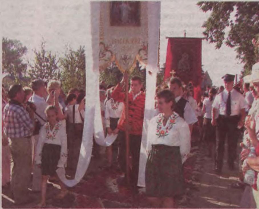
Niesione sztandary i obrazy rozpoczynały pochód procesji. Asystowała im młodzież w kolorowych, ludowych strojach.

Uroczystość poświęcenia organów, kwietne dywany, które układane są już od 200 lat, a także Msza Święta i uroczysta procesja, były doskonałą okazją do zakończenia obchodów 900-lecia istnienia parafii w Spycimierzu.