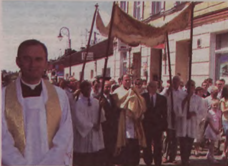
Procesja Bożego Ciała w Turku zmierza do czwartego ołtarza

Uczestniczącym w procesji mocno dawała się we znaki upalna w tym dniu pogoda. Szczególnie źle znosiły ją dzieci komunijne, które co jakiś czas słabły na trasie przemarszu. W jednym przypadku musiał interweniować zespół Pogotowia Ratunkowego, gdyż jeden z uczestników nabożeństwem dął i upadł na chodnik. Na zakończenie procesji ksiądz podziękował parafianom za aktywny udział w przygotowaniu ołtarzy. AZ