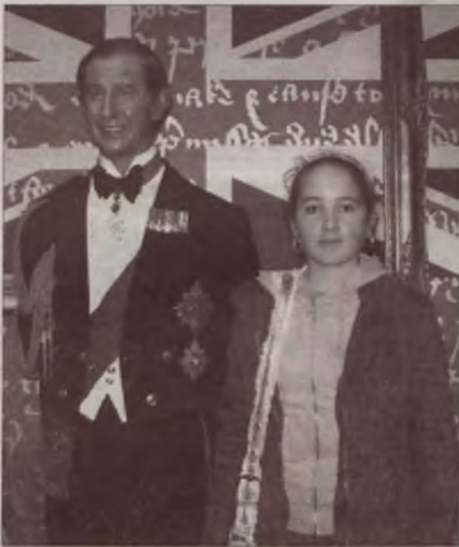
Wspólne zdjęcie z woskowym sobowtorem księcia Karola.

Nocnym markom najbardziej do gustu przypadło nocne zwiedzanie chińskiej dzielnicy na którą idzie się przez Trafalgar Square gdzie Admirał Nelson spogląda z kolumny na oka-