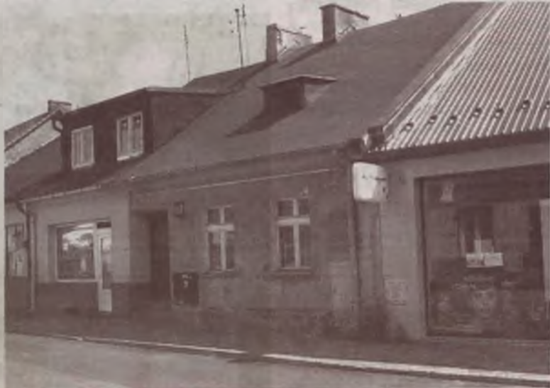
Pół kamienicy przy ul. Kaliskiej miasto sprzedało przedsiębiorcy z Warszawy za 218,16 tys. zł.