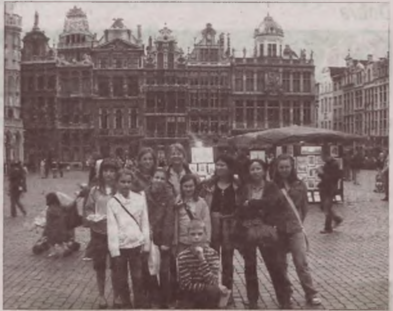
Podziwiając centrum Brukseli.

załę fontanny. Chińska dzielnica powitała gości dużą bramą ze smokiem i zapachami wschodniej kuchni.