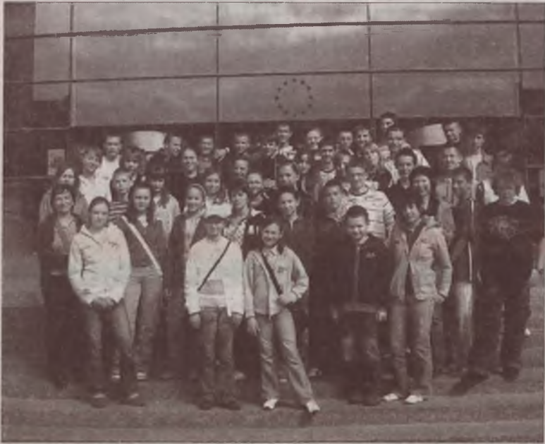
Przed siedzibą Parlamentu Europejskiego.

Ponad 40-osobowa grupa uczniów z turkowskich szkół uczestniczyła w wycieczce do Londynu - serca Wielkiej Brytanii. Organizatorem wyjazdu były Szkoła Języków Obcych Eureka oraz Gimnazjum nr 2 w Turku.