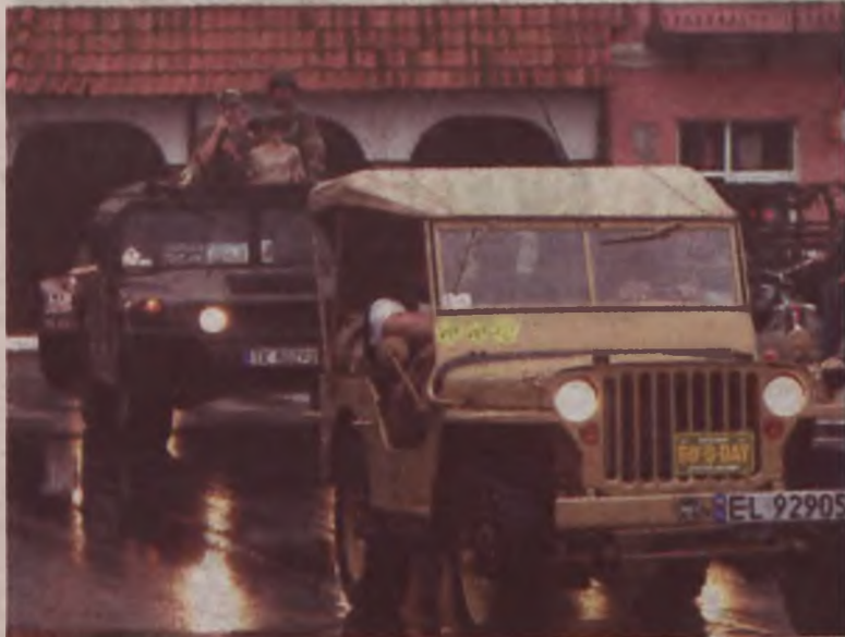
Wilys Military Cup to jedna z najbardziej widowiskowych imprez towarzyszących od kilku lat Dniom Turku. W tym roku miłośnicy militariów mogli zobaczyć wiele ciekawych pojazdów. Wśród nich pierwszy typ Wilysa - MA, Halftruck (opancerzony pojazd gąsienicowy), Dodge, Gazy 67, GMC, a także zabytkowe wojskowe motocykle.