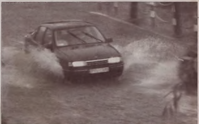
Ulewa szalała jedynie nad Turkiem. Kierowcom, którym nie udało się przed nią uciec, przyszło praktycznie pływać ulicami miasta.

W większości strażacy wypompowywali wodę z pozalewanych mieszkań oraz piwnic domów. Pompy niezbędne były również by ratować piwnicę Miejskiej i Powiatowej Biblioteki Publicznej im. Włodzimierza Pietrzaka. Ika, izi