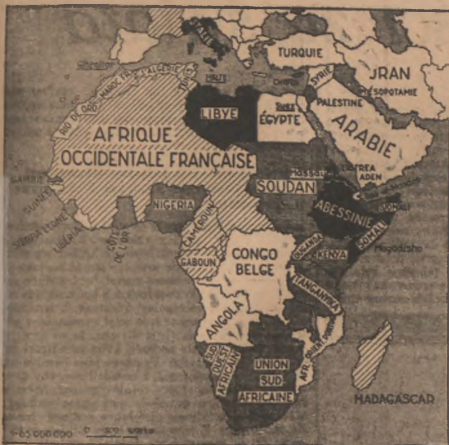
Po zdobyciu 'Abisynji, włoskie posiadłości kolonialne przewyższają obszarem sześciokrotnie kraj macierzysty. Powyżej załącza my mapkę orientacyjną, rysowaną przez francuskiego kartografa.