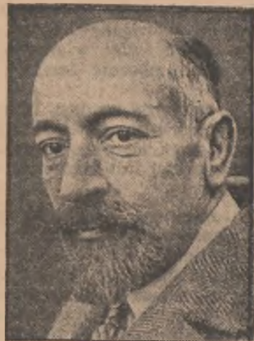
W wieku lat 61 zmarł b. minister francuski Dalimier. Swego czasu podczas wykrycia afery Stawiskiego był on zmuszony ustąpić ze swego stanowiska.