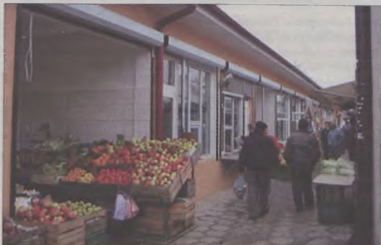
Teraz kupując jabłka na „zieleniak” turkowie nie będą stali po kostki w błocie

Marzeniem kupców jest jeszcze zadaszenie pasażu handlowego i wykonanie wysokich bram z dwóch stron przy wejściach na pasaż (tak, jak to jest przy sklepach koło Telekomunikacji). Mamy nadzieję, że i te pragnienia pracujących na tureckim zieleniak się spełnią. Tymczasem czekają nas tutaj przedświąteczne zakupy. A kupcy zapraszają swoich stałych klientów i nie tylko.