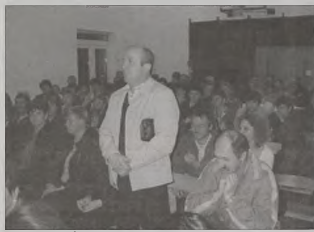
Rodzice w Żukach nie chcą prowizorycznych rozwiązań

Wydaje się, że obie strony dość zdecydowanie obstają przy swoich