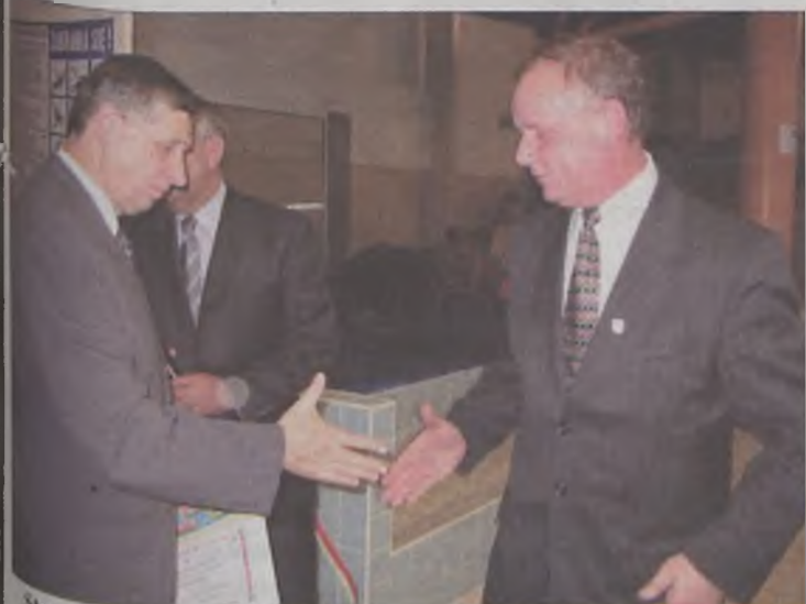
Starostwo przekazało czek na zakup wyposażenia dla pływalni w prezencie władze miasta z okazji przekazaniu w nieodpłatne użytkowanie basenu w godzinach popołudniowych dla dzieci i młodzieży z turkowskich szkół. Z informacji udzielonej przez kierownika