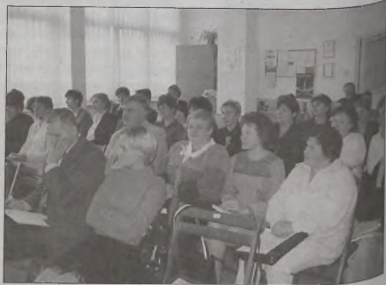
Pedagogzy dowiedzieli się, jak walczyć w narkomanią