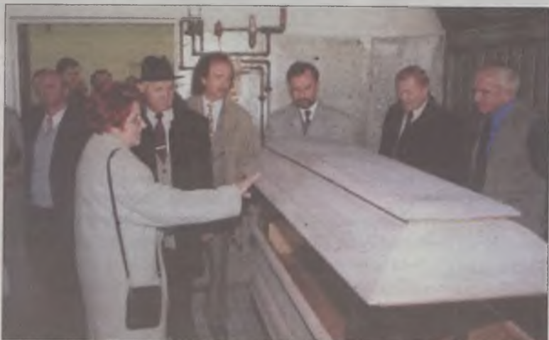
Turkowskie przedsiębiorcy mogli literalnie wręcz przekonać się, że produkcja takiego wyrobu jak trumna wymaga zarówno nowoczesnej technologii jak i stolarskich umiejętności.

członkom Izby zwiedzanie swojego zakładu. Doprawdy prezentacja wypadła nader imponująco. Efekt ten uległ jeszcze pogłębieniu po skonfrontowaniu obecnego stanu firmy z jej bogatą przeszłością zobrazowaną w postaci wystawy fotograficznej zaprezentowanej w klubie „Barbórka”, na drugiej części imprezy. Ekspozycję skomentował wygłoszeniem historycznego zarysu ponad stuletnich dziejów przedsiębiorstwa, młodszymi