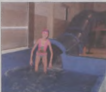
Ale fajnie – mówiły dzieci po wynurzeniu się z tunelu