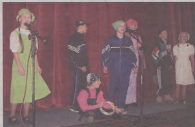
Klasa V ze Szkoły Podstawowej w Tokarach w piosence „Jezus ratownik”

Finale konkursu artystycznego pod hasłem „Wakacje z Panem Bogiem” zorganizowano w minioną sobotę w kinie „Tur”. Konkurs odbywał się w dwóch kategoriach artystycznych, tj. plastycznej i wokalne.