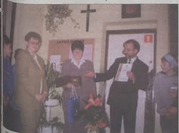
Wręczenie odznaki za zasługi w krzewieniu idei oszczędzania wśród młodzieży szkolnej

Ponadto w Gimnazjum nr 1 przeprowadza się także dwuetapowy Turniej Wiedzy Ekonomicznej, którego celem jest popularyzacja zagadnień i pojęć ekonomicznych, ze szczególnym uwzględnieniem działalności banku opiekującego się szkolnymi kasami oszczędności niemal od samego początku ich funkcjonowania. Dodatkowo PKO BP przekazało 300 zł na nagrody książkowe dla najlepiej i najsystematycznie oszczędzających uczniów. AZ, BG