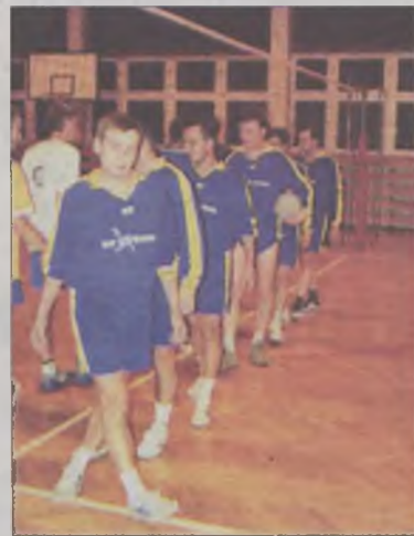
Sun Garden zaczął od porażki z MOS Kwadrat

W sezonie 2001/2002 do rozgrywek przystąpiło po 6 zespołów w I i II lidze. Rywalizacja trwać będzie w dwóch rundach (jesień i wiosna) systemem „każdy z każdym”. Ostatnia drużyna I ligi „spadnie” do II ligi, ustępując miejsca zwycięzcy drugoligowych zmagania. Zespół z piątego miejsca w pierwszej lidze rozegra mecz barażowy z zespołem, który w drugiej lidze uplasuje się na drugim miejscu. Zwycięzca tego pojedynku w następnej edycji grać będzie w pierwszoligowym towarzystwie. W sezonie 2001/2002 mogą brać udział zawodnicy, którzy czynną karierę zakończyli z dniem 31 grudnia 1998 roku (nie dotyczy młodzików, juniorów młodszych i juniorów). Zmagania pod siatką odbywają się w środy na parkietach sal gimnastycznych SP 5 i ZSZ w Turku. Jeśli chodzi o faworytów, to na razie trudno cokolwiek wyrokować. Początek pierwszoligowych zmagania pokazał, że nadal w decydującej rozgrywce będzie się liczyć KWB Adamów S.A. Mocna wydaje się być ekipa MOS Kwadrat oparta na młodzieży występującej w wielkopolskiej III lidze oraz Drawer, który w tym sezonie chciałby powrócić do czołowej trójki. Od porażek zaczęły drużyny Sun Garden i TKKF Tę-