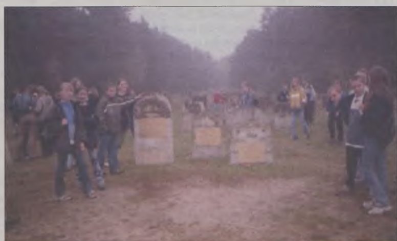
Lapidarium w Chelmie

Przejdźcie przez wiejskie podwórze i wzbudziło we mnie pewną refleksję. Jak bardzo „zmieszczała” są nasze dzieci, skoro widok krowy i świni wywołał w nich co najmniej tyle entuzjazmu, jak gdyby zobaczyły wiewiórkę czy kaczuszkę. Z Wyszyny przejechaliśmy do Koła, tam oczekiwać miały na nas ruiny pamiętające czasy Kazimierza Wielkiego. Wałami Warty ruszyliśmy w nieznaną. Po około 30 minutach dotarliśmy do celu. Ruiny zamku gotyckiego wzniesionego przez Kazimierza Wielkiego w 2 poł. XIV w. na wzgórzu, w zakolu Warty przedstawiają się całkiem imponująco. Jeśli zamknie się oczy łatwo wyobrazić sobie życie, jakie toczyło się na nim do 1656r., kiedy to został zniszczony przez Szwedów.