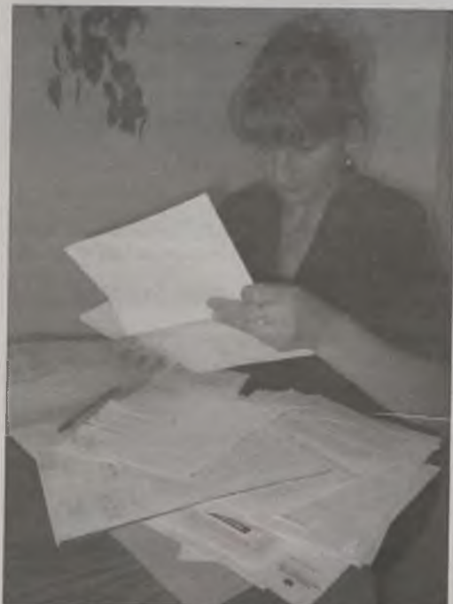
Poszkodowani już od ponad roku domagają się wskazania winnego, co potwierdzają zebrane przez nich dokumenty

W środę, 24 października około godz. 8.40 w Krępie (gmina Tuliszków) kierujący polonezem oślepiiony przez silne promienie słoneczne, potrafił jadąc w tym samym kierunku rowerzystę. Mężczyznę z obrażeniami ciała odwieziono do szpitala w Turku.