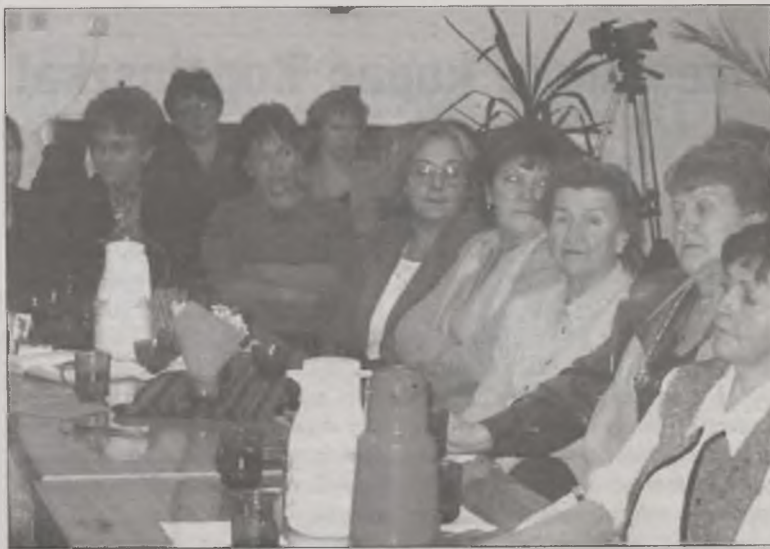
Czy Forum będzie w stanie wypromować młode, wykształcone i inteligentne turkowianki

I w tym momencie jest już jasne, że w przypadku Forum nie można mówić o autonomiczności i niezależności. Niemniej jednym z celów organizacji jest m.in. wprowadzenie zapisu, aby na listach wyborczych do różnych organów było co najmniej 30 proc. kobiet. Ponadto w programie jest również wdrażanie obowiązujących zasad równych praw dla kobiet i mężczyzn w życiu politycznym, gospodarczym miasta i regionu, w szczególności poprzez aktywizację zawodową, społeczną i polityczną kobiet (przez umożliwienie dostępu do informacji,