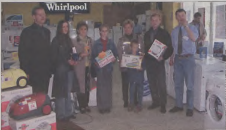
Klienci i uczestnicy festynu „Domatora” prezentują swoje nagrody