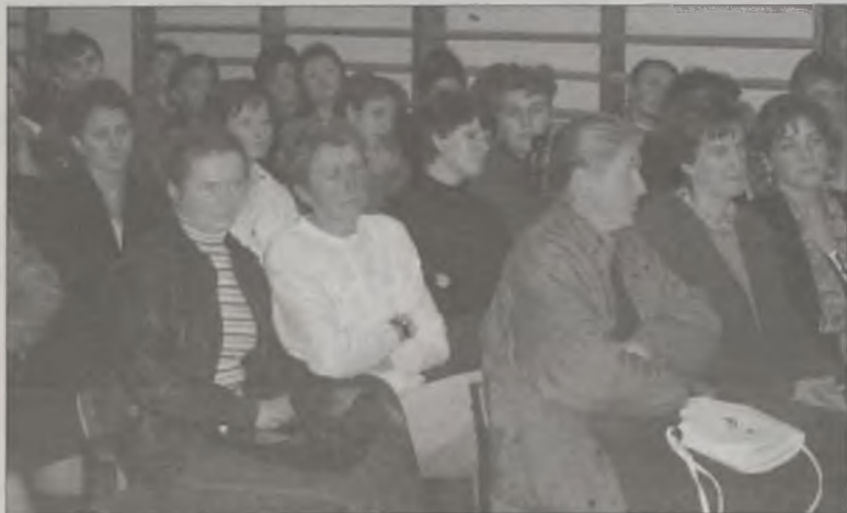
Blisko stu rodziców nie zgadza się na jakiegokolwiek zmiany