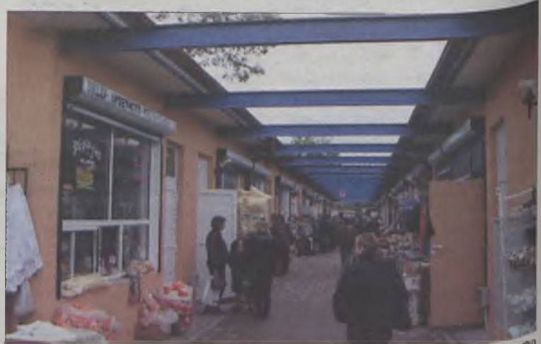
Zakupy na „zieleniak” będą całkowicie niezależne od pogody po planowanym wybudowaniu zadaszenia pasażu

Sklepiki są ładnie i estetycznie. Wszystkie są oświetlone, zabezpieczone roletami. Mieszkańcy szybko zauważyli, że handel wrócił na stare miejsce i znów zaopatrują się tu w pieczywo, mięso, warzywa, owoce i inne artykuły.