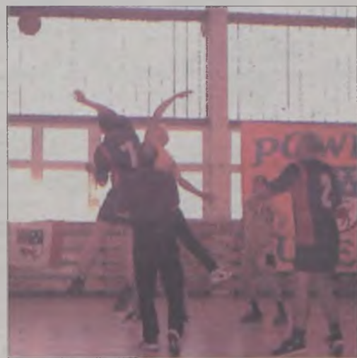
Niektórzy samorządowcy mogą podskoczyć tylko na boisku

MOS Jedyńka Turek – ZSZ Turek 2:0 (13, 21); TKKF Elektron Turek – Gimnazjum Malanów 2:0 (11, 23); Mleczarnia Turek – Urzędy PS Turek przelozony na 30 października.