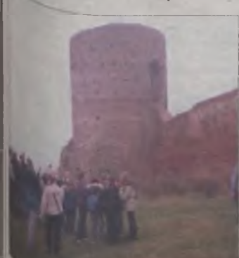
W ruinach kolskiego zamku 16 października 2001 r.

Wyprawę wyruszone rano, 16 października. Pierwszym etapem autokarowej wędrowki była wycieczka do Władysławowa. Chcieliśmy zwiedzić drewniany kościółek z 1782r., o którym nie było głośno w związku z odwołaniem, jakie w nim dokonano. Władysławów, budynek obwarowany kamiennymi zamkniętymi na wszystkie strony „ruszycami” i „ruszycami spustymi”. Ruszyliśmy więc z bliska wyłaniając się z murów, które kiedyś stanowiły fasadę frontową renesansowego zamku wzniesionego w XVII w. Niewiele dziś wie, że w XVI w. to jedna z najbardziej okazałych budowli reprezentacyjnych w Wielkopolsce. Do resztek zamku też nie jest łatwo dotrzeć, ruiny usytuowane są bowiem na terenie prywatnym. Dzięki uprzejmości gospodarzy, którzy wyznaczyli nam drogę, w końcu mogliśmy dotknąć murów.