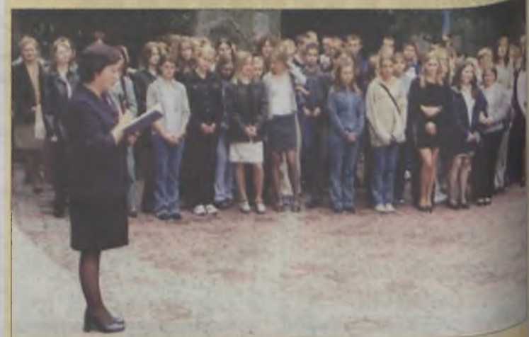
Gimnazjum nr 2 w Turku