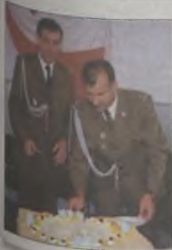
45 lat WKU – str. 4