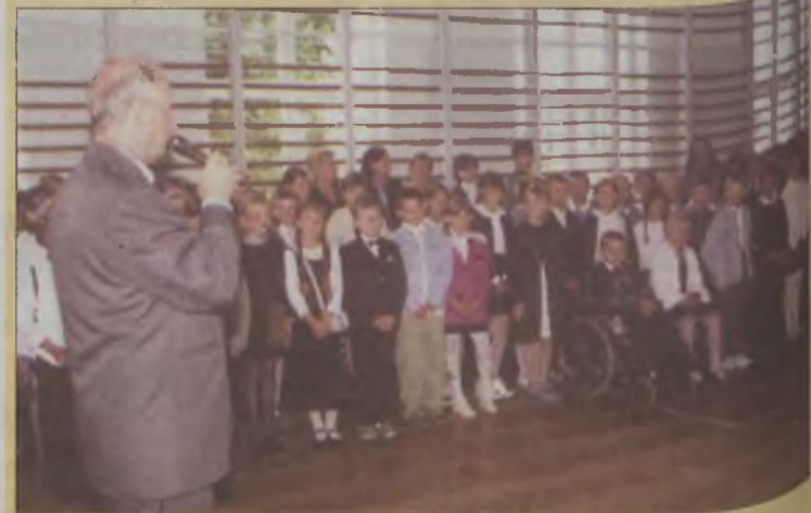
Szkoła Podstawowa nr 2 w Turku