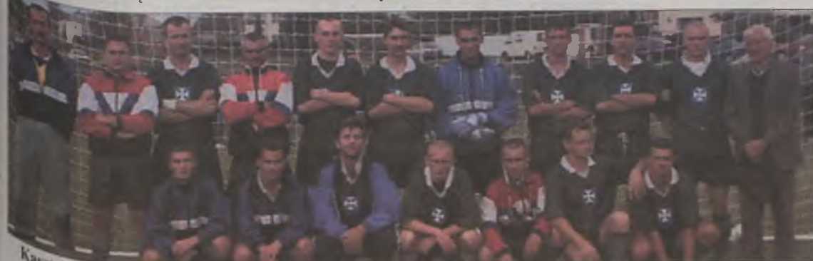
Kasztelania Brudzew (na zdjęciu) zagra w Pucharze Polskim z Orłem Kawęczyn