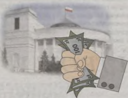
Majątki kandydatów – str. 6