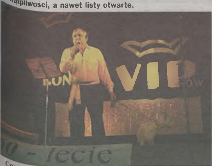
Czy to była koza wyborcza dla Turku