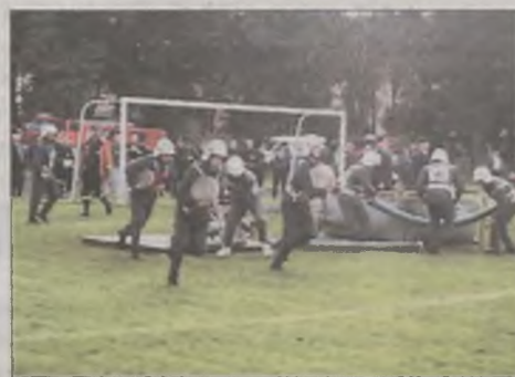
Strażackie zmagania – str. 6 i 8