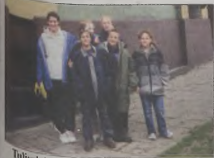
Tuliszków I na trasie

W Miłkovicach, zakwaterowano ich w budynku po zlikwidowanej szkole podstawowej. Po zjedzeniu obiadu, spacerze nad pobliski zbiornik Jezioro i zwiedzeniu zabudowanego w okresie międzywojennym dworku, rozpalono ognisko. Oprócz nieodzownego w takich przypadkach pieczenia kiełbasek, przeprowadzono konkursy wiedzy o mieście i gminie Dobra, powiecie tureckim, profilaktyce alkoholowej. Odbył się także mini festiwal piosen-