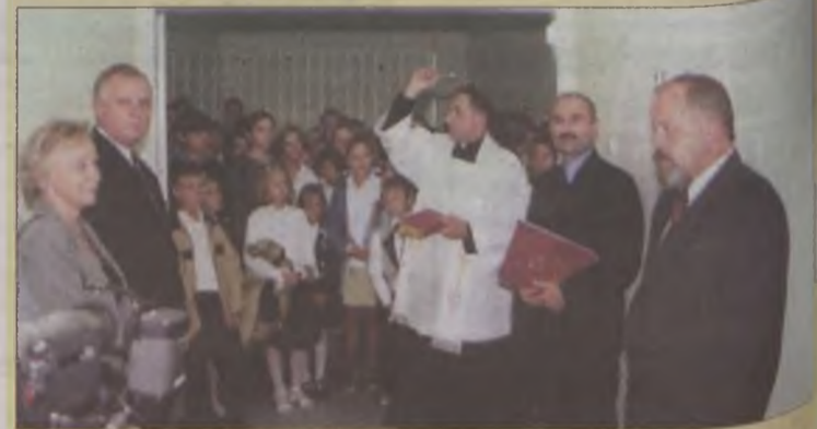
Państwowa Szkoła Muzyczna w Turku