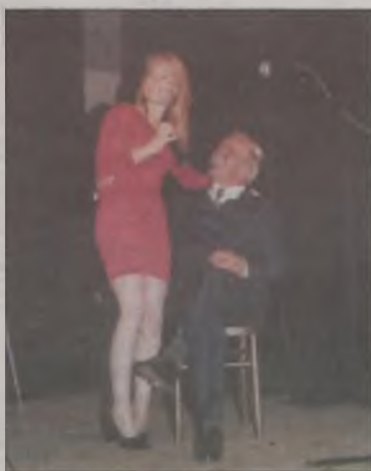
Sekretarka dla burmistrza Poturality musi być utalentowana