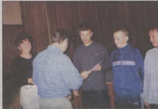
Najlepszym wręczono nagrody

Nagrody i dyplomy najlepszym oraz ich opiekunom wręczali przed-