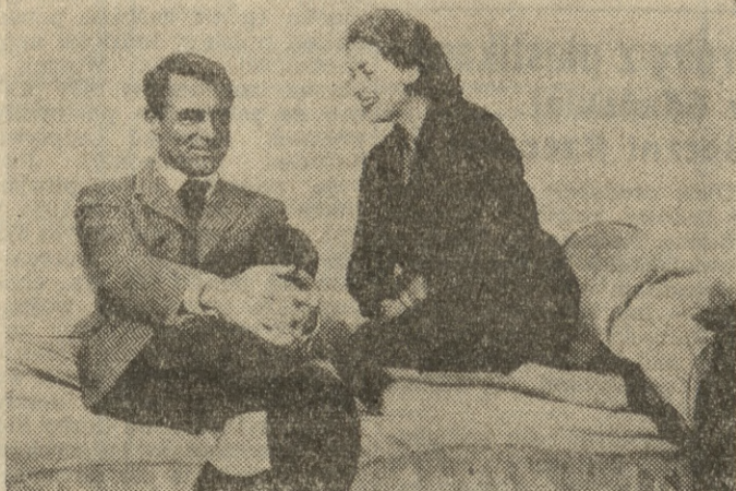
Nowym partnerem Ingrid Bergman jest Gary Grant w filmie — nakręcanym obecnie w londyńskim studio Elstree.