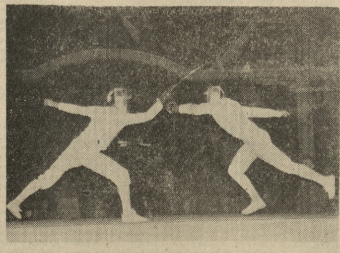
W Międzynarodowym Turnieju Szermierczym w szabli, w Warszawie, (22—24 bm.) reprezentacja nasza zajęła drugie miejsce, za Węgrami.

Wstawił się on swym wspaniałym malarstwem ściennym nawiązującym do starożytności sztuki Majów i Azteków. Wszelkimi sposobami przynosił mu freski o tematyce historycznej, którymi ozdobił mury wielu gmachów w stolicy Meksyku. Rivera znany był również ze swych poglądów lewicowych.