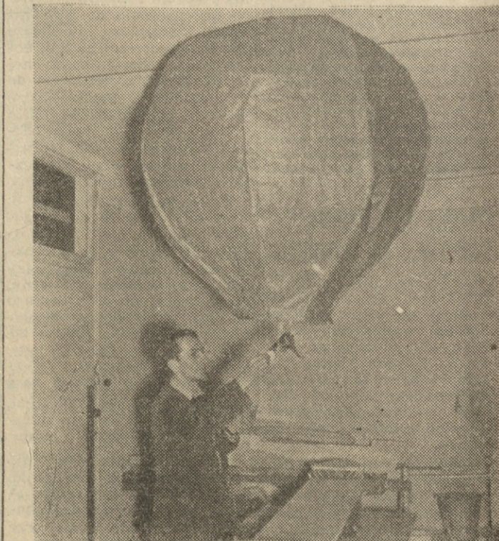
„LATAJĄCE TALERZE” NAD... KRAKOWEM

W przyszłym roku pochylnie jej opuści 20-osobowy motorowiec płaskodenny, którego kadłub w dużej części będzie składał się z elementów plastikowych. Statek ten będzie napędzany silnikiem spalinowym. (of)