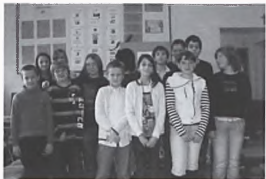
Zwycięzcy obu etapów konkursu polonistycznego

W tym roku nasza szkoła przystąpiła do ogólnopolskiego konkursu polonistycznego „Słowo