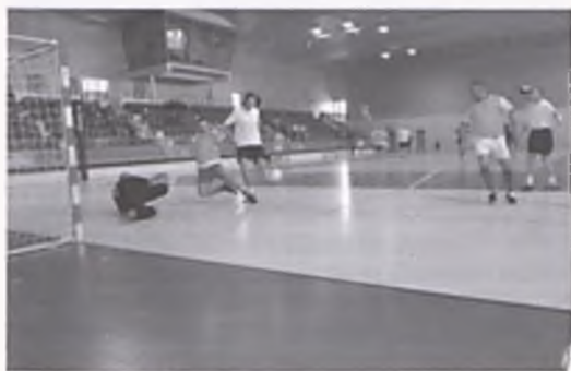
Piłkarska liga halowa toczy swoje rozgrywki w hali LOSiR