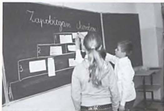
Zajęcia poświęcone zapobieganiu grypie

W Szkole Podstawowej nr 4 co miesiąc odbywają się spotkania w ramach Klubu Małego Muzyka, organizowanego przez firmę Art And Music. Zapoznajemy dzieci z różnymi instrumentami oraz ich brzmieniem. W listopadzie poznaliśmy saksofon na spotkaniu pt: