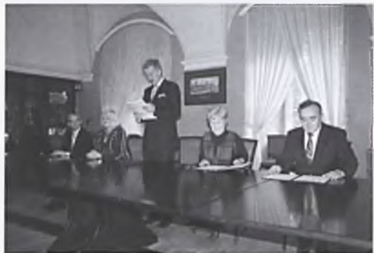
Spotkanie w Urzędzie Miasta Poznania

Dla mieszkańców Lubonia utworzenie Poznańskiego Związku Komunikacyjnego bę-