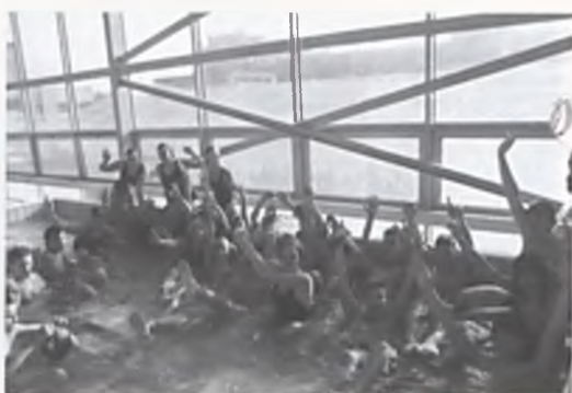
Pływacka reprezentacja z Gimnazjum nr 2

tę dziewcząt i chłopców, która będzie reprezentować Luboń w Powiatowych Mistrzostwa w Śremie. 3 listopada braliśmy udział w Powiatowych Mistrzostwach w Sztafecie Pływackiej 10 x 25m w Śremie. Nasze drużyny awansowały do finałów wojewódzkich mistrzostw w sztafecie pływackiej. Zawodnikom serdecznie gratulujemy.