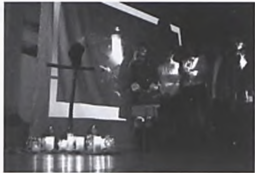
Zaduszki Muzealne w Muzeum Martyrologicznym