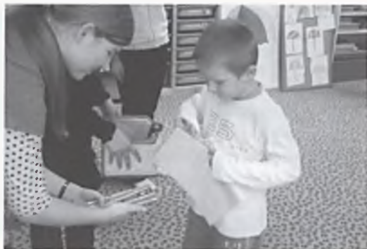
Odwiedziny w przedszkolu Tip-Topka

31 października reprezentacja Gimnazjum nr 2 zwyciężyła z reprezentacją Gimnazjum nr 1 w Mistrzostwach Miasta w Sztafecie Pływackiej 10x25m. Zawody miały wyłonić zwycięską sztafe-