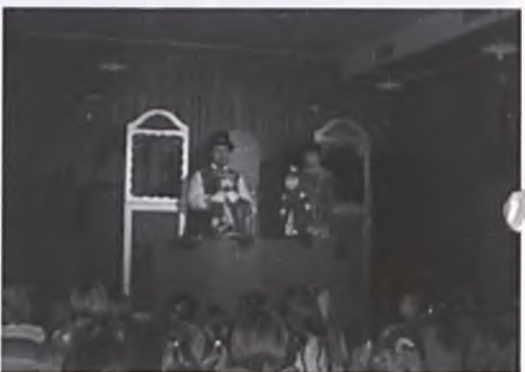
Spektakl 3xKrólewna, 3xSmok