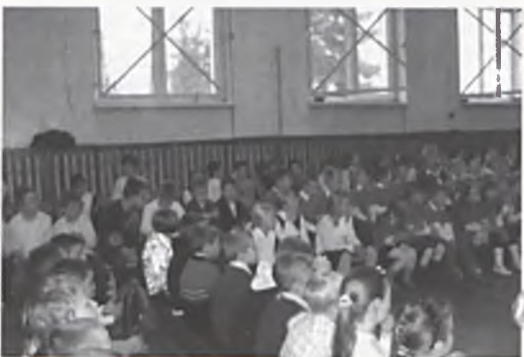
Spotkanie Klubu Małego Muzyka

„Pan saksofonik i zaczarowany świat dźwięków”.