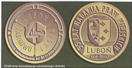
Graficzna wizualizacja lubońskiego dukata