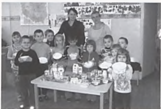
klasa 0A podczas zajęć o zaletach mleka i jego przetworów