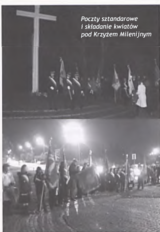
Poczty sztandarowe i składanie kwiatów pod Krzyżem Milenijnym