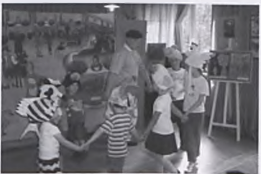
Jaś i fasola

29 maja o godz. 18.00 w Bibliotece Miejskiej odbyło się przedstawienie pt. „Opowieści starego kredensu” w wykonaniu Teatru Pod Orzelkiem. Przed spektaklem rozdano jeszcze nagrody dla zwycięzców XV Konkursu Recytatorskiego, VII Konkursu Pięknego Czytania oraz XV Konkursu Plastycznego.