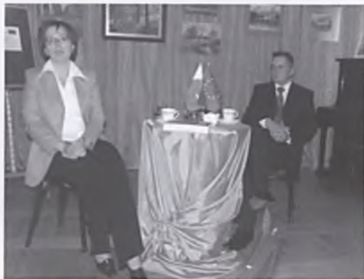
Minister Sidonia Jędrzejewska

O pięcioletniej drodze Polski w Unii Europejskiej dyskutowano podczas spotkania z ministrem Sidonią Jędrzejewską, podsekretarzem stanu w Urzędzie Komitetu Integracji Europejskiej, zorganizowanym 1 czerwca 2009 roku