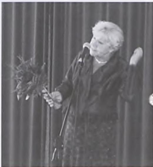
Teresa Lipowska w Ośrodku Kultury w Luboniu

Znana i lubiana aktorka opowiadała lubonianom nie tylko o swoim życiu prywatnym, ale również o pracy w teatrze. Wszyscy mogli także wysłuchać anegdot dotyczących pracy na planie filmowym popularnego serialu „M jak Miłość”, w którym Teresa Lipowska wciela się w rolę Barbary Mostowiak, głowy wielopokoleniowej rodziny. Podczas spotkania można było wysłuchać też wierszy Juliana Tuwima i ks. Jana Twardowskiego w wykonaniu aktorki. ■