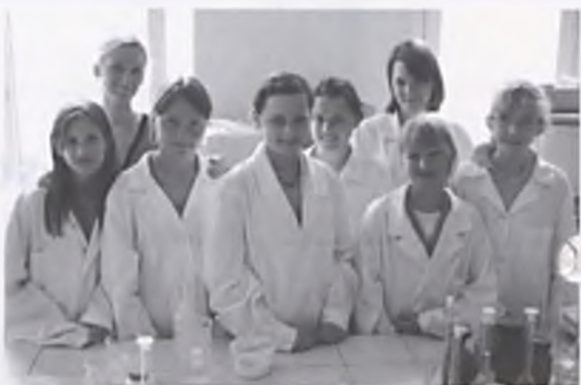
Wizyta w laboratorium Politechniki Poznańskiej