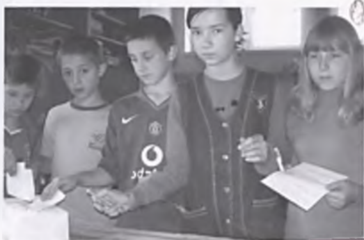
Uczniowie głoszą na nowych przedstawicieli RSU