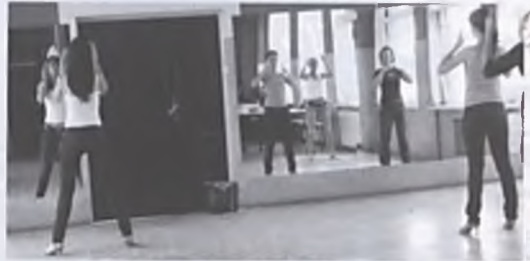
Amatorzy gorących rytmów na zajęciach w Ośrodku