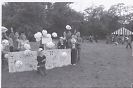
Prezentacja pracy uczniów Trójki na Biennale sztuki

6. Radac Samorządu Uczniowskiego Trójki dokonała podsumowań konkursów: