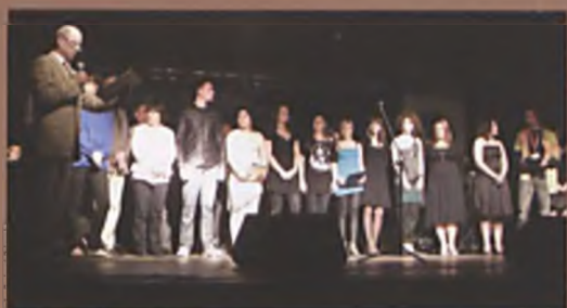
Laureaci festiwalowego konkursu

boniu był Michał Bajor, który podczas recitalu wykonał utwory ze swojej nowej płyty „Inna Bajka” oraz te nieco starsze „Nie chcę więcej” czy „Moja droga”.