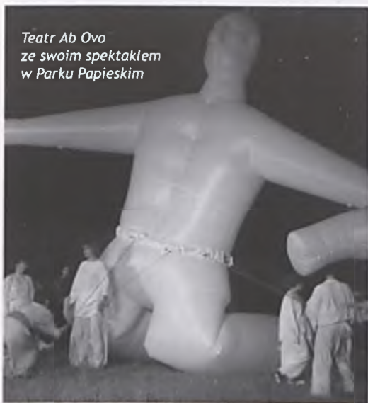
Teatr Ab Ovo ze swoim spektaklem w Parku Papieskim

Dwudziestoosobowa obsada aktorska, trzynaście obrazów scenicznych, siedem wielkich pompowanych figur zachwyliło publiczność, czego wyrazem były gromkie brawa.