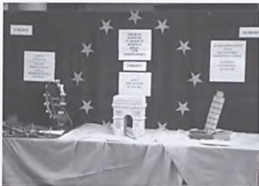
Prace z konkursu plastycznego w Gimnazjum nr 2