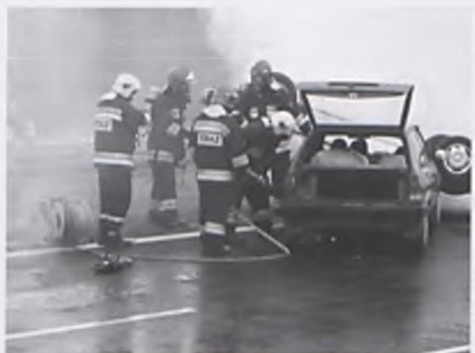
Ćwiczenia służb ratowniczych w Luboniu

02. 06. 2009 r. na odcinku autostrady A2, przebiegającej w granicach administracyjnych Lubonia, na wysokości Muzeum Martyrologicznego w Żabikowie, zostały przeprowadzone ćwiczenia służb ratowniczych. W akcji ratowniczej brały udział: policja, straż pożarna i pogotowie. Ćwiczenia miały na celu sprawdzenie systemu współdziałania służb podczas wystąpienia katastrofy drogowej.