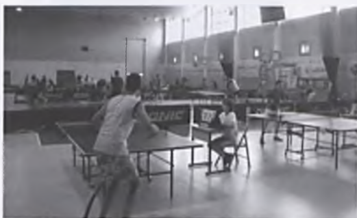
Mecze tenisa stołowego

6 czerwca, w hali sportowej, odbył się turniej tenisa stołowego z okazji 55-lecia nadania praw miejskich miastu Luboń. Przy społecznym zaangażowaniu wielu osób przeprowadzono wspaniałe zawody gromadząc przy tym rekordową liczbę uczestników. Pojedyunki rozegrano w czterech kategoriach, a oprócz licznych upominków z Urzędu Miasta i słodczy najlepszych zawodnicy otrzymali medale, dyplomy, puchary i bony rabatowe od firmy Riccardo. 96 uczestników przybyło z wielu stron Wielkopolski by zobaczyć nasze aktywne miasto. ■