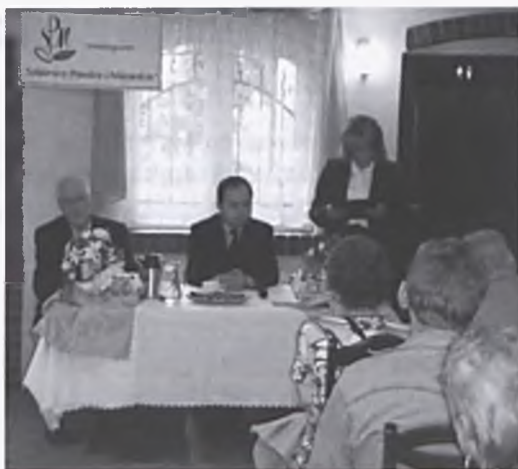
Spotkanie z europosełem Konradem Szymańskim

W drugiej części spotkania głos zabrali goście. Nie zabrakło pytań, które przygotowali zebrani uczestnicy spotkania. Dotyczyły one upadających stoczni, problemów z którymi boryka się HCP Cegielski, dopłat rolniczych, wykupu