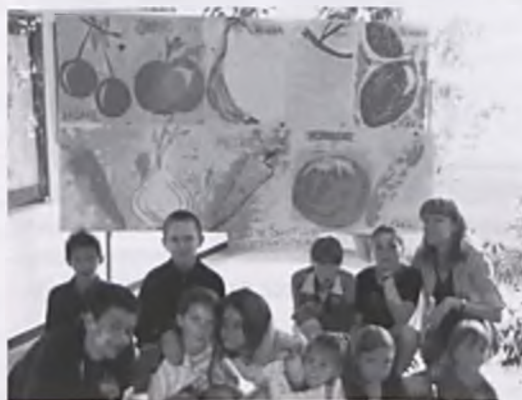
Uczniowie z SP 4 promują zasady zdrowego żywienia

20.05. nasza szkoła przystąpiła do programu „Owoce, warzywa i soki są na 5”. Jego organizatorami są Instytut Żywności i Żywienia – ogólnopolska niezależna instytucja naukowa, której celem jest promowanie zasad zdrowego żywienia oraz Firma „Tymbark” – lider na rynku soków, nektarów i napojów w Polsce. Honorowy patronat nad programem objęło Ministerstwo Zdrowia. Program ten wpisuje się w działania prowadzone w ramach ogólnoświatowej inicjatywy propagującej spożywanie warzyw i owoców 5 razy dziennie. Głównym celem programu jest wzrost świadomości wśród dzieci odnośnie zdrowotnych