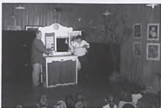
Opowieści starego kredensu