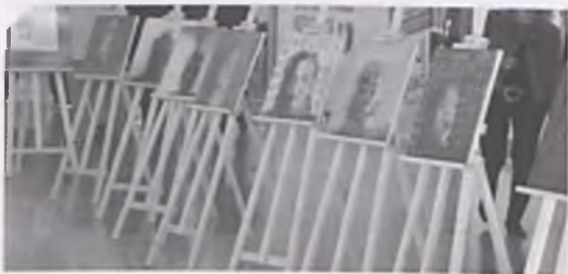
Wystawa prac malarskich w Outlet Factory

„Szybki” to cykl portretów autorstwa Jagody Szymańskiej, które od 1 do 13 czerwca można było podziwiać w galerii Outlet Factory w Luboniu w związku z cyklem wystaw promujących Festiwal Piosenki Luboń 2009 „Dziwny jest ten świat”. W połowie czerwca prace artystki zostały przeniesione do „Galerii na piętrze” Biblioteki Miejskiej. ■