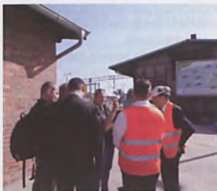
Konferencja prasowa na lubońskim dworcu PKP

W czwartek 4.09.2014 roku z inicjatywy Urzędu Miasta Luboń na dworcu PKP w Luboniu odbyło się spotkanie informacyjne dziennikarzy lokalnych mediów z przedstawicielami Konsorcjum: FCC, AZVI, DCM, Przedsiębiorstwa Transportowego Translub Sp. z o.o i zastępcą Burmistrza Miasta Luboń. Spotkanie miało charakter informacyjny, dotyczyło modernizacji linii kolejowej E59 etap III. Przed spotkaniem z dziennikarzami jak co tydzień Zastępca Burmistrza i przedstawiciel wykonawcy na placu budowy omówili jej przebieg i przedstawiony harmonogram prac.