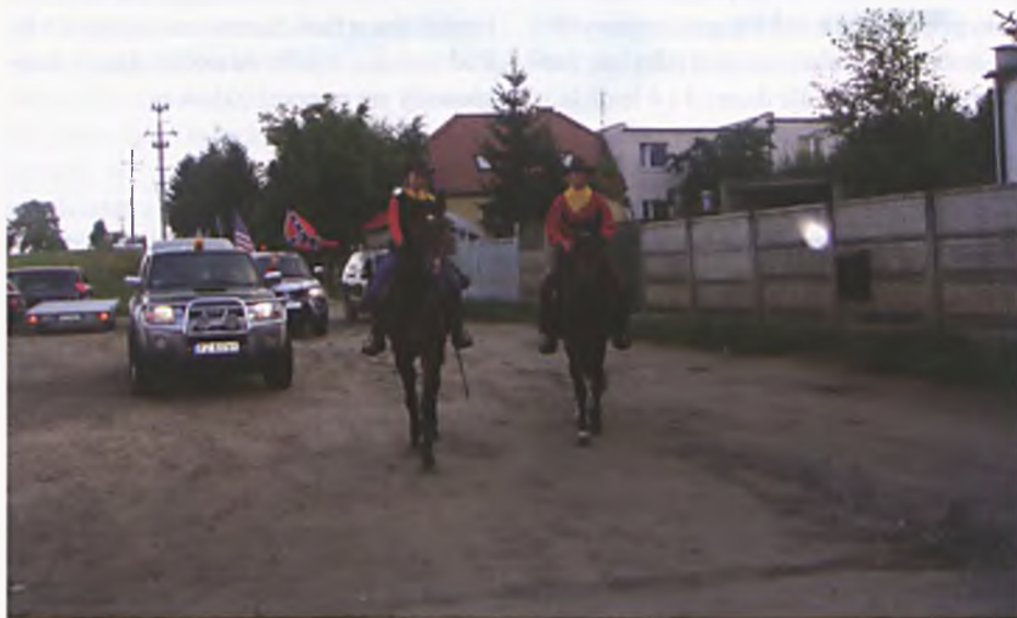
Pony Express w Luboniu

Pony Express to szybka poczta konna działająca na obszarze Wielkich Równin i Gór Skalistych. Była to najbardziej bezpośrednia i najprostsza droga łączności z Zachodem przed wprowadzeniem telegrafu. W dzisiejszych czasach kraje Europejskie biorące udział w Pony Expressie,