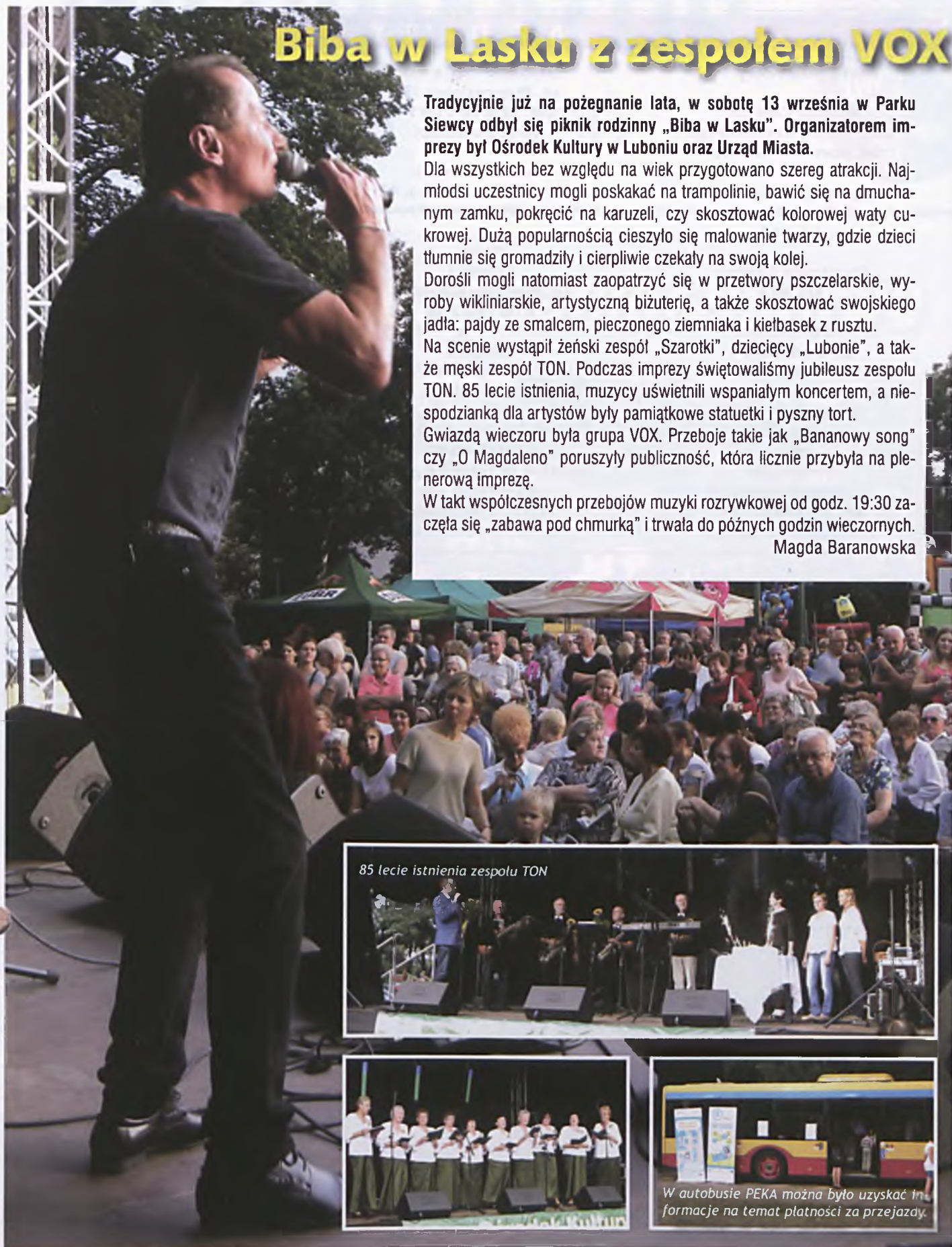
85 lecie istnienia zespołu TON