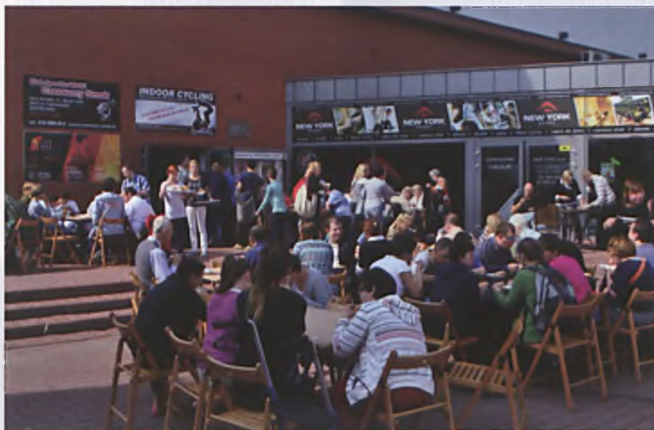
Drugi Powiatowy Przegląd Twórczości Osób Niepełnosprawnych