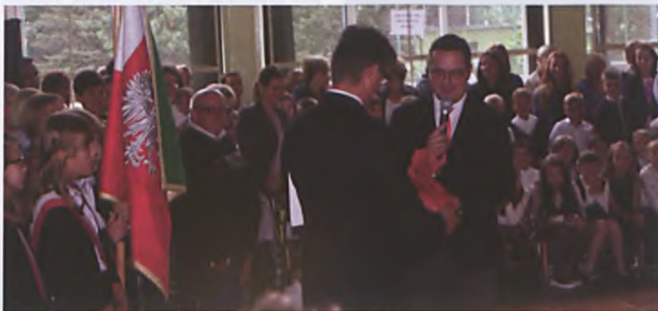
Zastępca Burmistrza wręcza kask ochronny