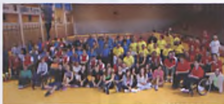
Uczestnicy zawodów w Bocci

Również w starszej grupie zawodnicy z „Dwójki” byli bezkonkurencyjni. Z kompletem zwycięstw zajęli pierwszą lokatę oraz prawo startu w eliminacjach powiatowych.