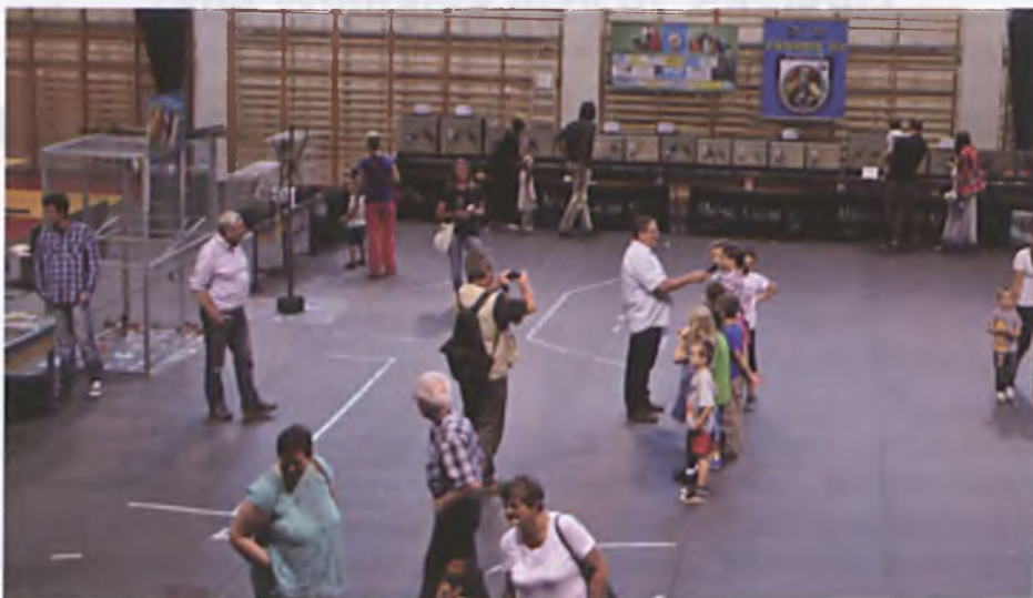
Na wystawie zaprezentowano ponad sto bardzo ciekawych okazów ptaków

W sobotnie przedpołudnie 6. września w hali LOSIR Sp. z o.o. pojawili się bardzo kolorowi i niewytkie oryginalni goście. We współpracy ze Stowarzyszeniem Hodowców Ptaków Egzotycznych "Canaria" zorganizowana została wystawa, w której udział wzięli hodowcy m.in. z Poznania, Lubonia i Tarnowa Podgórnego. Zaprezentowano ponad sto bardzo ciekawych okazów ptaków, które występują w Azji, obu Amerykach, Afryce i Australii.