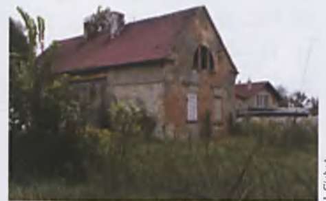
Pracownia architektoniczna zajmie się koncepcją przebudowy obiektu

Przy okazji spotkania w tak szanownym gronie poruszono również ważny dla nas temat identyfikacji obiektów wpisanych do rejestru zabytków. W miesiącu sierpniu dzięki współ-