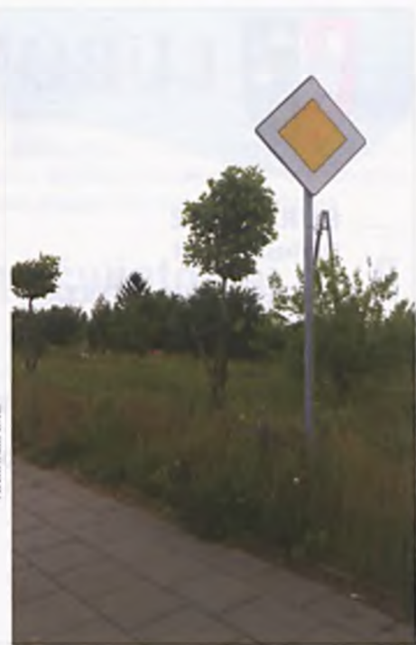
Miasto zwraca uwagę na niewłaściwy stan pielęgnacji zieleni wzdłuż autostrady

W miesiącu październiku przedstawimy listę zwycięzców oraz dokumentację fotograficzną najpiękniejszych balkonów, ogrodów i relację z uroczystości wręczenia nagród oraz wyróżnień.