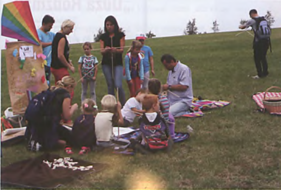
W trakcie pikniku można było także spróbować swoich sił i zbudować wyjątkowy latawiec

LUBOŃSKA POZYTYWKA – Strefa Aktywnych Rodziców zorganizowała 30 sierpnia 2014 r. (w sobotę) akcję lokalną dla mieszkańców Lubonia, w szczególności dla rodzin z dziećmi. Akcja lokalna pt. "Kręcimy z Pozytywką rodzinne chwile" realizowana była w ramach II Ogólnopolskiego Tygodnia Work-Life Balance 2014, którego inicjatorem jest Fundacja Aktywności Lokalnej. O akcji lokalnej można było przeczytać nie tylko na fanpage'u Pozytywki na facebook'u, lecz znalazła się ona również na ogólnopolskiej mapie inicjatyw pod adresem www.wlb.org.pl .