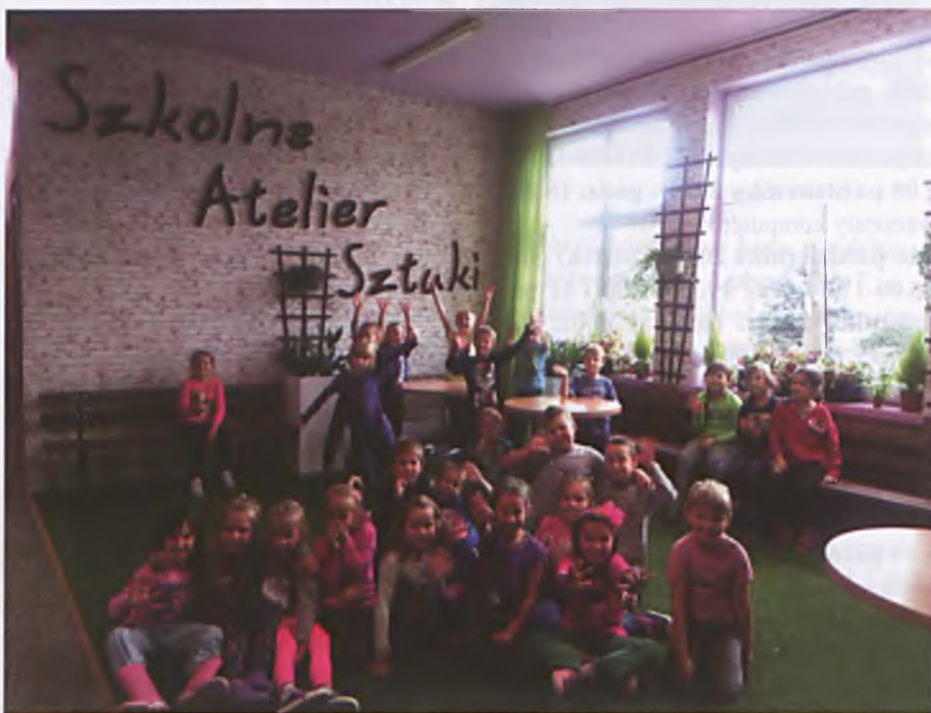
Celem powstania "atelier sztuki" jest doskonalenie umiejętności poruszania się w świecie kultury, technologii informacyjnej, sumiennego i solidnego odbioru słowa, muzyki, obrazu oraz rozwijanie umiejętności społecznych ucznia