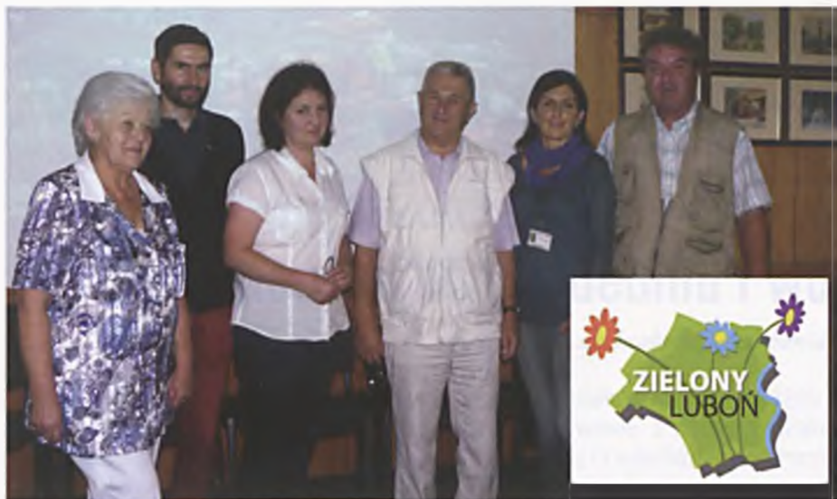
Komisja Konkursowa Miejskiego Konkursu "Zielony Luboń."