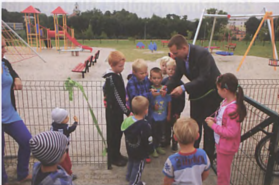
W trosce o najmłodszych plac zabaw został przy odbiorze dodatkowo zweryfikowany pod kątem bezpieczeństwa przez Instytut Nadzoru Technicznego z Wrocławia

Przy okazji festynu "Kręcimy z Pozytywką rodzinne chwile" zorganizowanego przez nieformalną grupę Lubońska Pozytywka w Parku Papieskim oficjalnie otwarto największy w Luboniu plac zabaw.