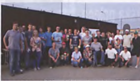
Uczestnicy turnieju „Intermarché Lubon Cup”