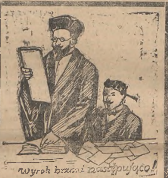
Wyrok brzmi następująco!

Ponieważ „Sapon“ jest najlepszym, Ponieważ nie niszczy bielizny, Ponieważ użycie mydła czyni zbytecznym, Ponieważ usuwa niszczące tarcie, Zatem jako środek do prania Jest niezbędnym w każdym domu — „Sapon“ ze znakiem ochronnym koszulką. Chem. Fabr. „Ergasta“ C. Nagórski, Starogard Pom.