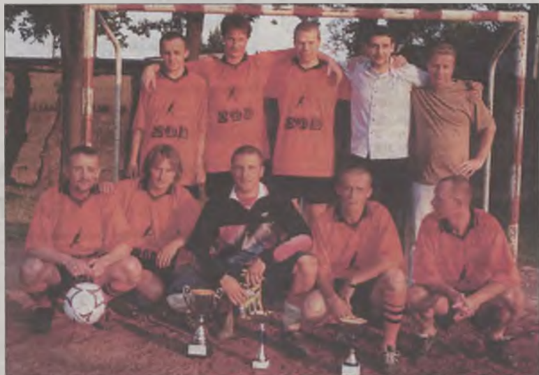
W turnieju piłki nożnej drużyn osiedlowo-zakładowych najlepsi okazali się piłkarze SOD