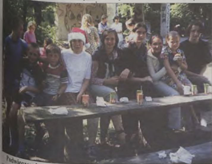
Podwieczorek na wyspie