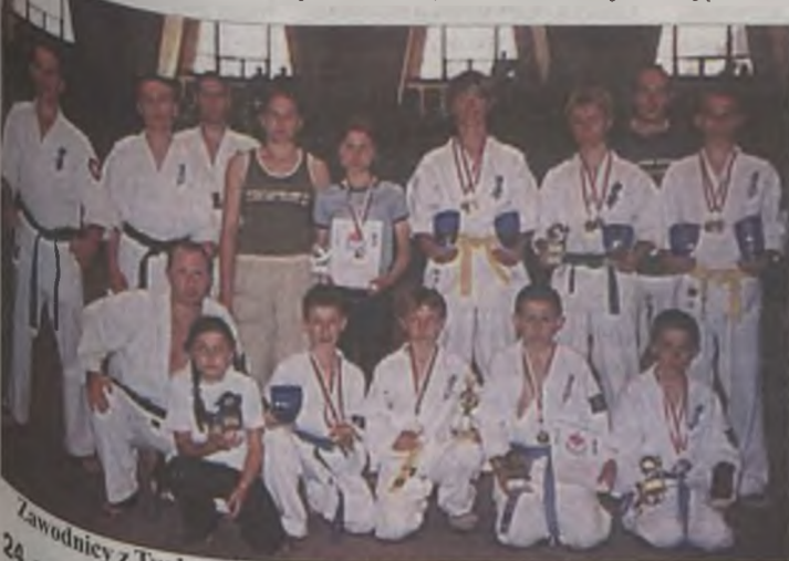
Zawodnicy z Turku w Inowrocławiu 24 czerwca 2003 r.

Zdobyciem Pucharu Wielkopolski karatecy KSISW zakończyli swój sezon sportowy 2002/20003. AZ