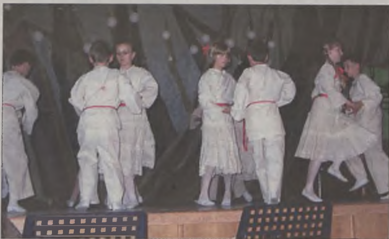
Sobotnie występy dzieciaków