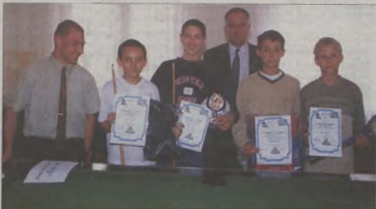
Zwycięzcy turnieju bilardowego

powitało w Przykonie uczestników V Wielkopolskiego Przeglądu Artystycznych Zespołów Strażackich. Powiat turecki reprezentowały zespoły: „Zgoda” ze Smulsk (gm. Przykona), „Retro” z Malanowa, „Gryffis” z Przykony, „Wrzos” z Tuliszkowa i „Malanowianie” z Malanowa. Szczególnie korzystne wrażenie pozostawił po sobie kwintet wokalny „Retro”, złożony z czterech dziewcząt. Wyróżniły się dobrym przygotowaniem wokalnym i choreograficznym. Dni Przykony zakończyła zabawa taneczna, która trwała do późnych godzin nocnych. (can)