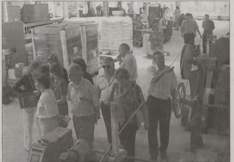
Goście z Ukrainy zwiedzali turkowskie firmy

W dalszej części pobytu na terenie naszego powiatu grupa dziennikarzy została podzielona. Część odwiedziła miejscowe przedsiębiorstwa, inni pojechali do Cekowa, by zobaczyć sposoby rozwiązywania kwestii składowania odpadków komunalnych. Pozostali najpierw odwiedzili turkowskie kościół p.w. NSPJ, po którym oprowadził ich ks. prałat Kazimierz Tartanus. W dalszej części odwiedzili turkowskie mu-