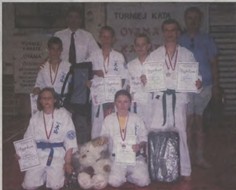
Drużyna Turkowskiego Klubu Karate OYAMA na Turnieju w Bydgoszczy