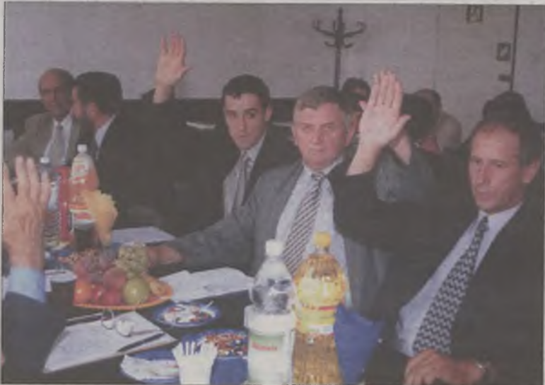
Sesja Rady Gminy

Popołudniowy festyn ograniczony został do występów na sali OSP. Rozpoczął je mini koncert tutejszej orkiestry dętej. Po niej swój dorobek artystyczny prezentowały gminne placówki oświatowe. Duże wrażenie na pu-