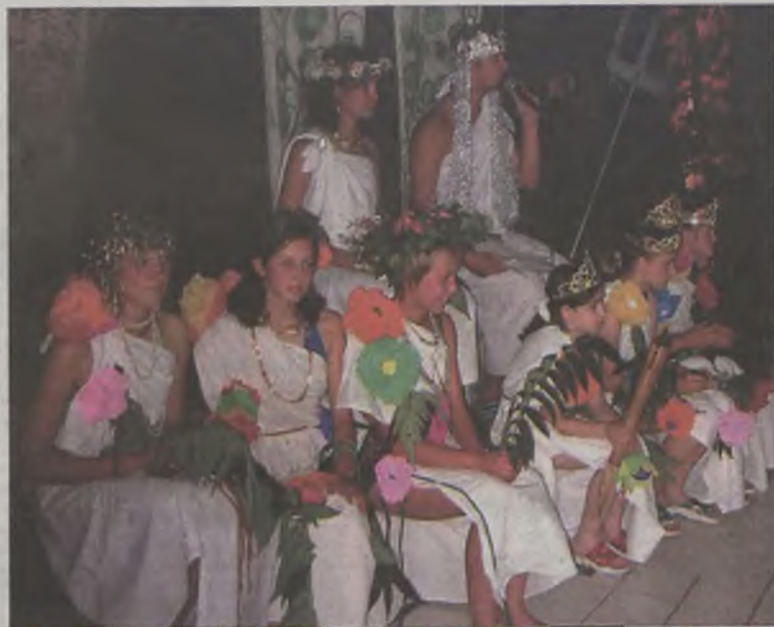
Świta boga Neptuna

la im strzec bezpieczeństwa w renowacjach otwartych, takich jak kąpiele przyjeżdżających turystów. Świeżo upieczeni ratownicy WOPR licznie zebrani w sali bankietowej zaprezentowali swoje pływacką sztafetę.