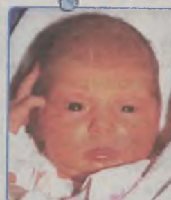
... RAKOCIŃSKA córka Bożeny ur. 7 czerwca, godz. 9.25 wżyła 3250g, mierzyła 52cm