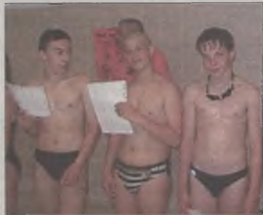
Nowi adepci ratownictwa wodnego

Oprócz nich kurs drugi stopnia ukończyło sześć osób, którzy otrzymali tytuły i legitymacje ratowników WOPR. Zdobyty dokum-