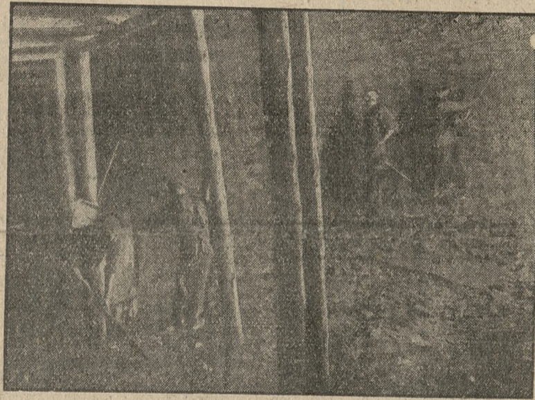
Pożar na kopalni „Reden” w Dąbrowie tłumy się obecnie drogą, t. zw. kneblowania szybów. Na rycinie: jeden z szybów kopalni „Reden”.