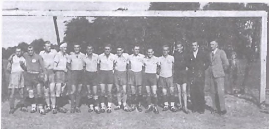
zdjęcie 8 - w Olszynchach.