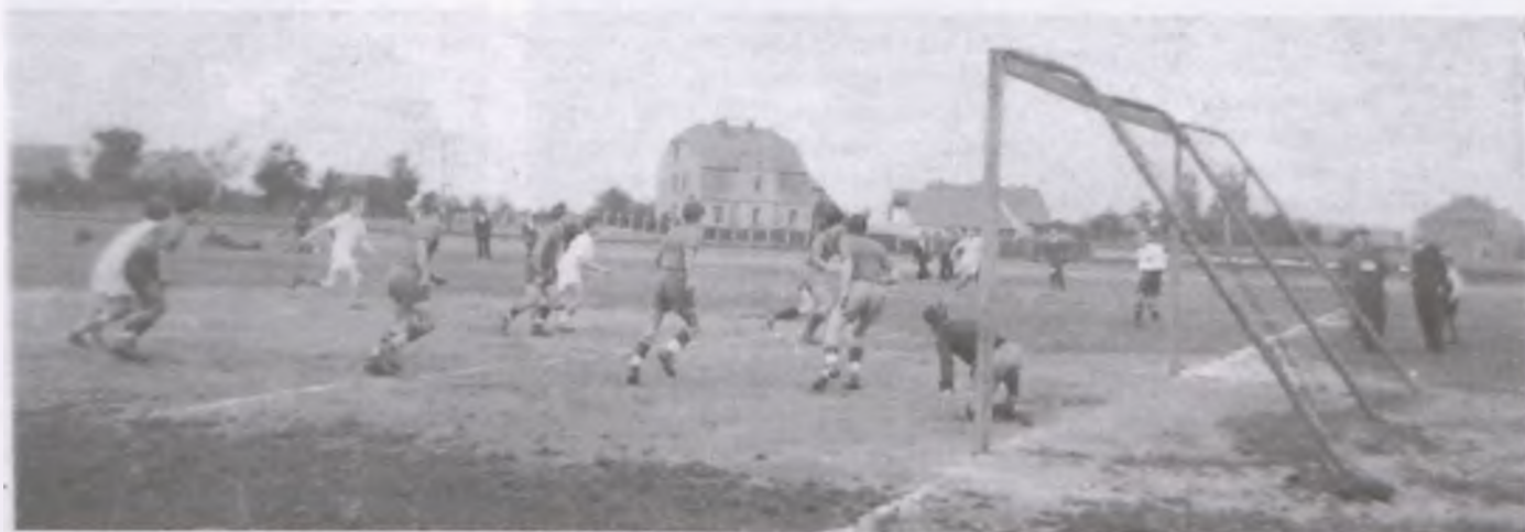
Zdjęcie 10 - przedstawia mecz rozegrany na Trynce pomiędzy Kolejarzem Wronki a Brytanią Poznań. Gopsodarze wygrali 3:0