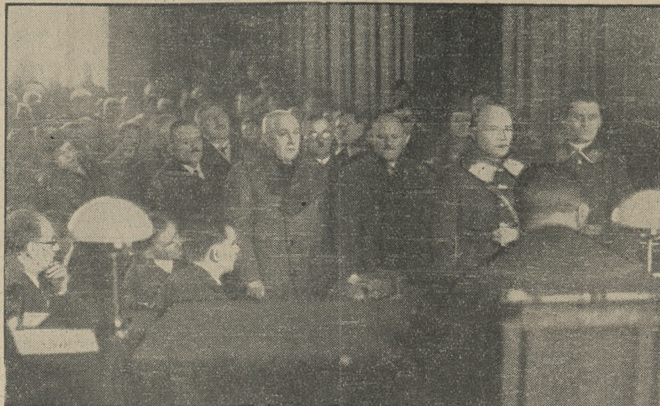
Przed trybunałem sądzącym zgromadzili się wszyscy świadkowie, którzy zeznają w dzisiejszym procesie.

Informacje zasięgnięte u osób, któreby mogły naprowadzić władze śledcze na właściwy krok, nie dały po dłuższym czasie żadnych wyników. Uspiona czujność