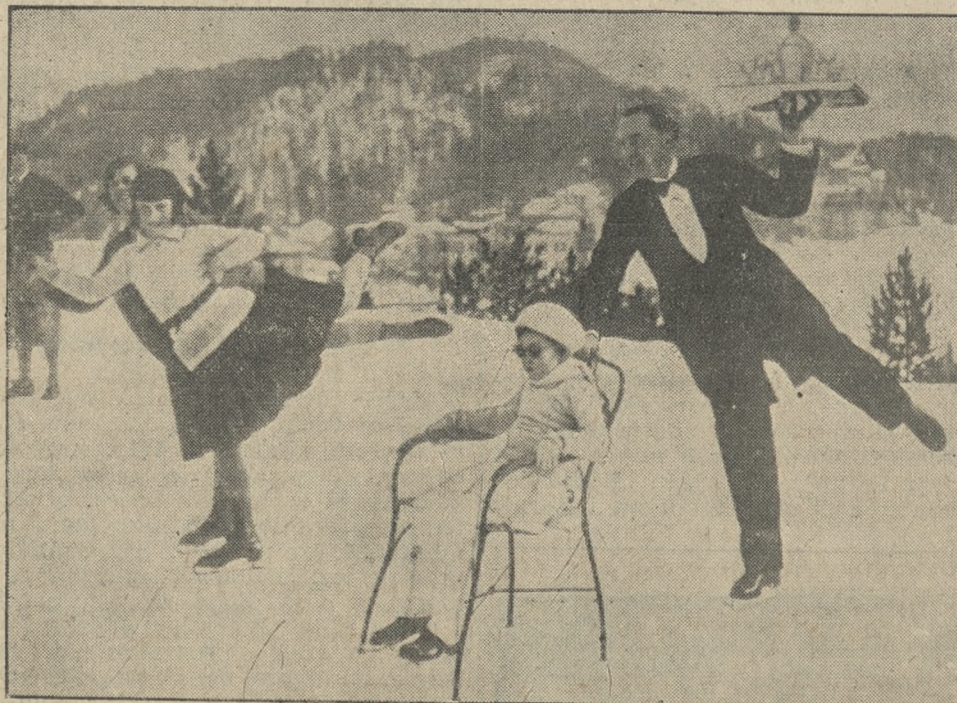
W St. Moritz zwraca powszechną uwagę główny kelner jako znakomity jednocześnie łyżwiarz. Na łyżwach obsługuje gości, a równocześnie popycha krzesło niżej saneczki.