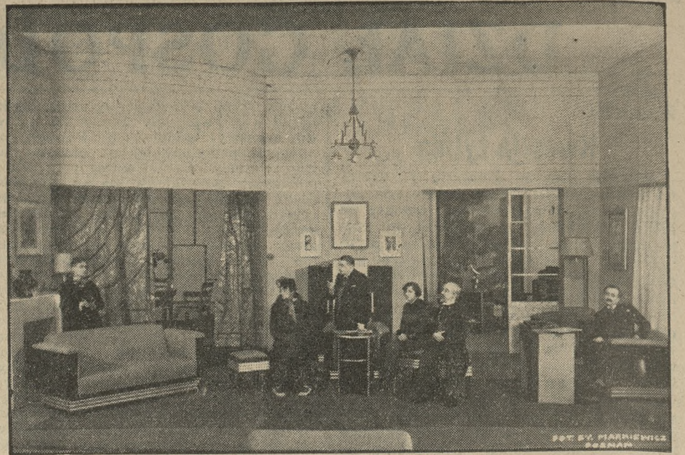
Scena zespółowa z komedji Devala „Stefek”, która w Teatrze Polskim cieszy się obecnie dużym powodzeniem.

Zastanowić należy się przede wszystkim nad pytaniem, czy sól kuchenna, będąca związkami sodu i kwasu solnego, jest środkiem żywnościowym, czy też przyprawą, jak n. p. pieprz lub cynamon. Pewnym jest, że sól kuchenna jest normalnym składnikiem naszego organizmu. Wynika z tego, że jest ona nam do normalnego życia potrzebna, pytanie tylko w jakiej ilości. Nauka odpowiada na to, że wystarcza dziennie jeden do dwóch gramów. Nie ulega wątpliwości, że człowiek spożywa daleko więcej soli, i że ilość ta