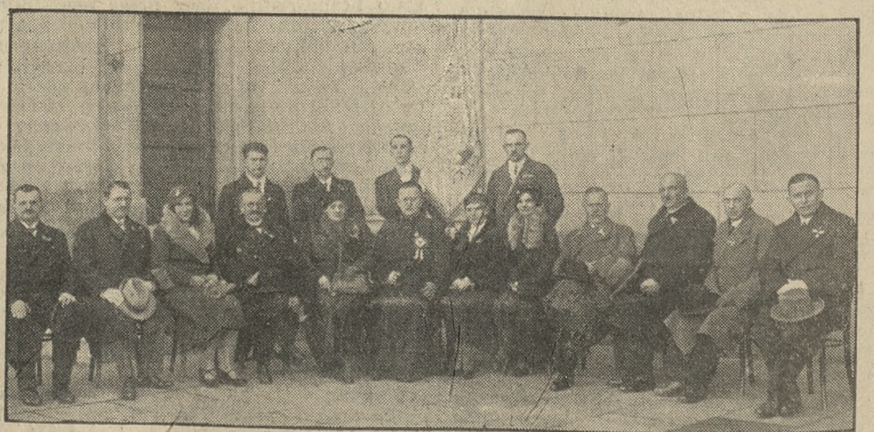
10-lecie chóru Zmartwychwstania na Wildzie. Rodzice chrzestni poświęconego w niedzielę sztandaru chóru Zmartwychwstania na Wildzie z ks. prob. Woźkiem patronem chóru w środku.

Prowadzone od kilku miesięcy w Kielcach roboty nad rozbiórką prawosławnego soboru zostały już doprowadzone do fundamentów, czyli ukończone, ponieważ piwnice cerkiewne zachowane zostaną jako schrony dla obrony przeciwgazowej. Obecnie na terenie dawnej cerkwi i cmentarza, stanowiącym dziś plac Żeromskiego, przeprowadza się prace ogrodnicze.