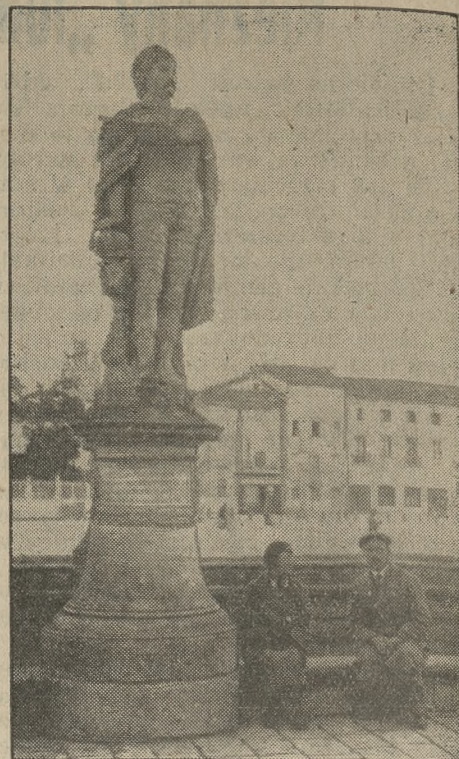
Pomnik Jana Sobieskiego w Padwie, na placu Wiktora Emanuela, ufundowany przez Stanisława Augusta.