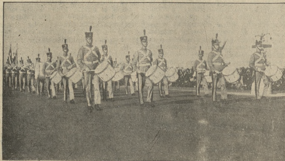
W Chicago odbył się doroczny zjazd b. uczestników wojny światowej. Jak zwykle odbyła się wielka defilada, w której wzięło udział 120 tysięcy chłopca z wszystkich stron Stanów Zjednoczonych. Na zjeździe był obecny również prezydent Roosevelt.