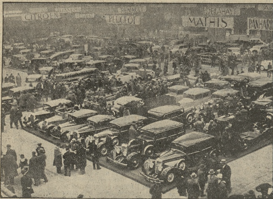
Główna hala na wystawie samochodów w Paryżu

Auto stało się dzisiaj środkiem komunikacji w miastach, po wsiach, w kraju, na małe i duże dystanse. Salon paryski jest naocznym przykładem znaczenia automobilizmu w życiu współczesnym. M. K.