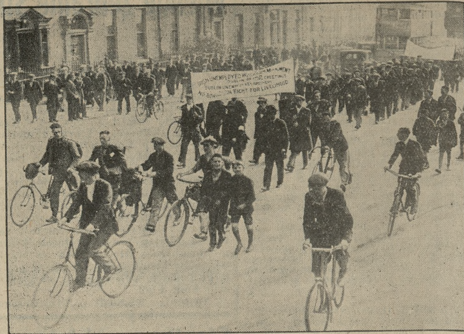
Demonstracyjny marsz bezrobotnych odbył się w tych dniach z Dublina do Belfastu.

Z nieoczekiwanego tego rezultatu wysnuto wnioski, że zastrzyki hormonu żeńskiego w ciało mężczyzny wywołują rege-