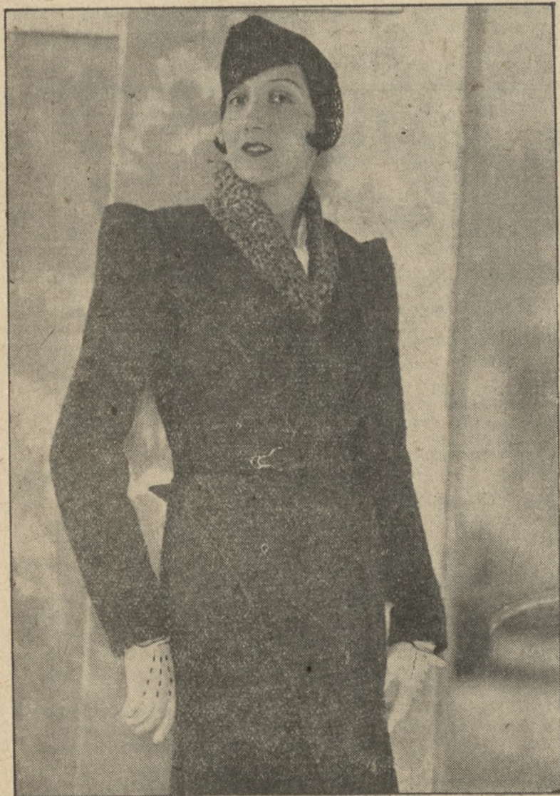
Jesienny płaszcz o bardzo szykownej, nowej linii, z angielskiej wełny. Nowością jest kieszeń z jednego boku, dość odstająca na biodrze, oraz odstające szerokie ramiona. Krótki kołnierzyk z popielatych karakulów

nabywać można „Kurjer Poznański” w kioskach „Ruchu” już od godz. 15.00. Z dogodności tej korzystać winni wszyscy wyjeżdżający z Poznania popołudniowymi pociągami. Cena za egzemplarz 20 gr.