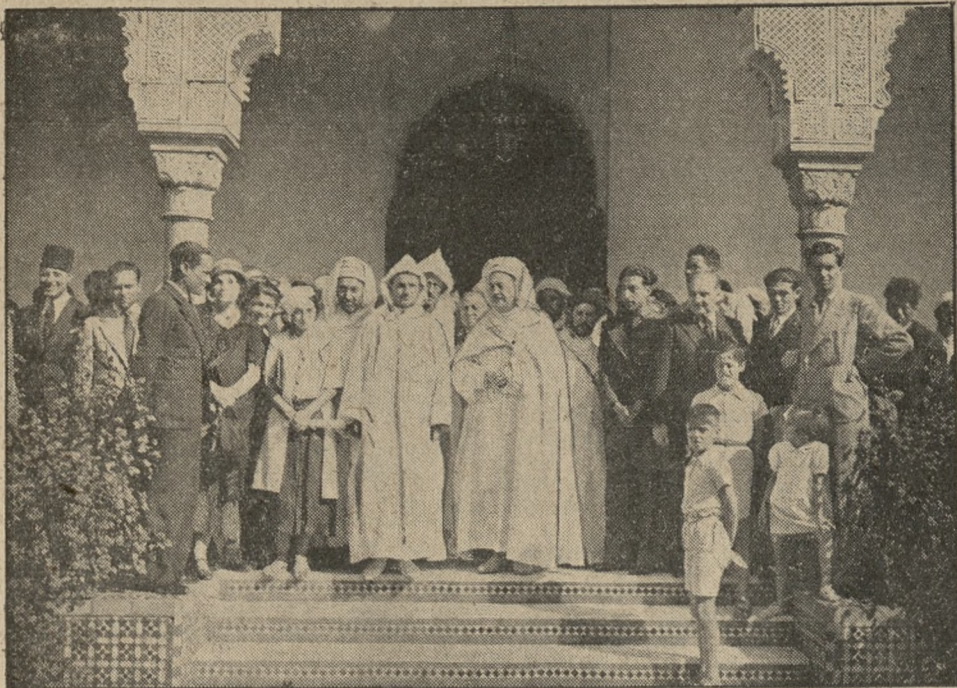
Sułtan marokański na rocznym zjeździe związku Habousów (miejsce pielgrzymkowych mahometańskich), odbytym w tych dniach w Paryżu w jednej z sal meczetu paryskiego.