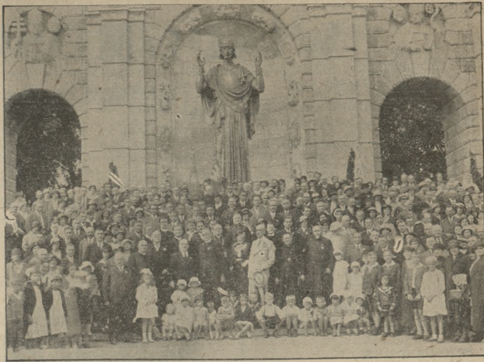
Wycieczka katolików francuskich, która przybyła wczoraj do Poznania, udała się z dworca pod pomnik Najśw. Serca Jezusowego. Dzisiaj uczestniczyli goście w mszy św w złotej kaplicy katedry, poczem przyjęci zostali przez J. Em. Ks. Kardynała-Prymasa na specjalnej audjencji. Po południu o godz. 15 udali się goście w dalszą drogę do Francji via Zbąszyń—Berlin.

r. 1932 należy dla przedsiębiorstw, opłacających zaliczki na podatek obrotowy za rok 1933 na podstawie obrotów z r. 1932 odpowiednio ograniczyć wysokość zaliczek. (fr.)