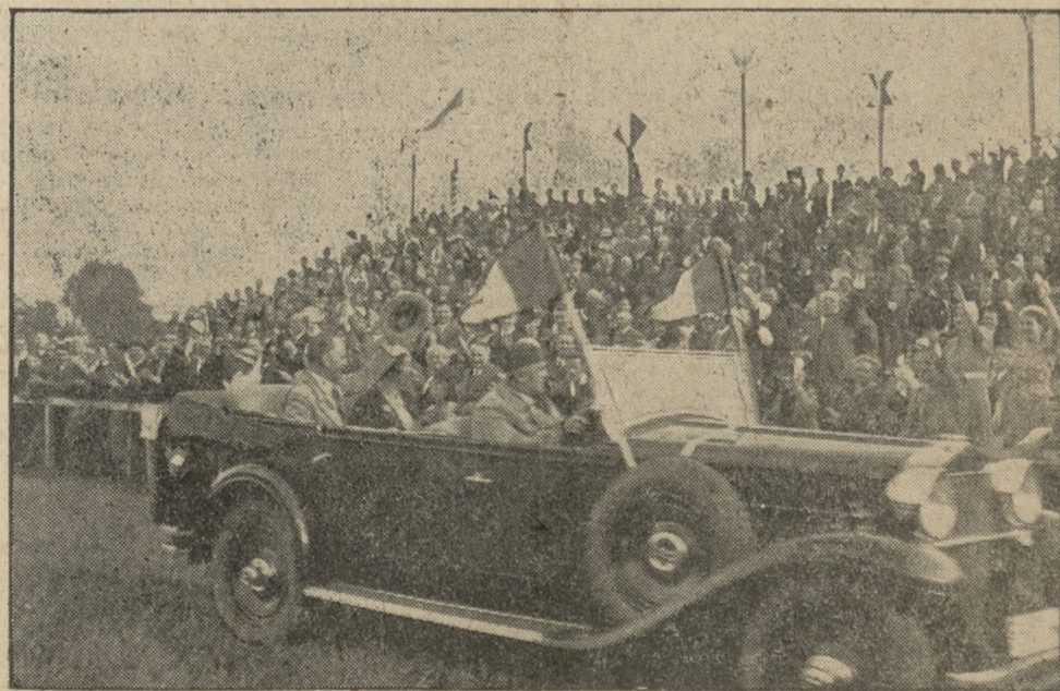
Zdjęcie nasze przedstawia scenę z wczorajszego owacyjnego powitania kpt. Skarżyńskiego na lotnisku w Warszawie.