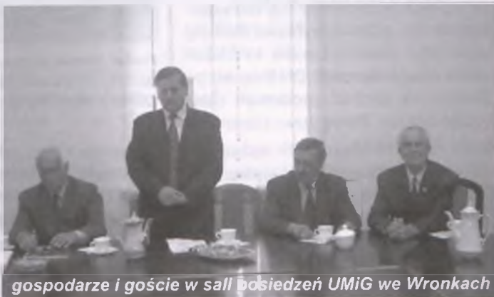
gospodarze i goście w sali posiedzeń UMIG we Wronkach

15 września 2002 w sali posiedzeń Urzędu Miasta i Gminy we Wronkach odbyło się spotkanie organizatorów V Ogólnopolskiego Zjazdu Więźniów Politycznych Reżimu Komunistycznego lat 1945 – 1956 z tymi, którzy zjazd pomagali organizować.