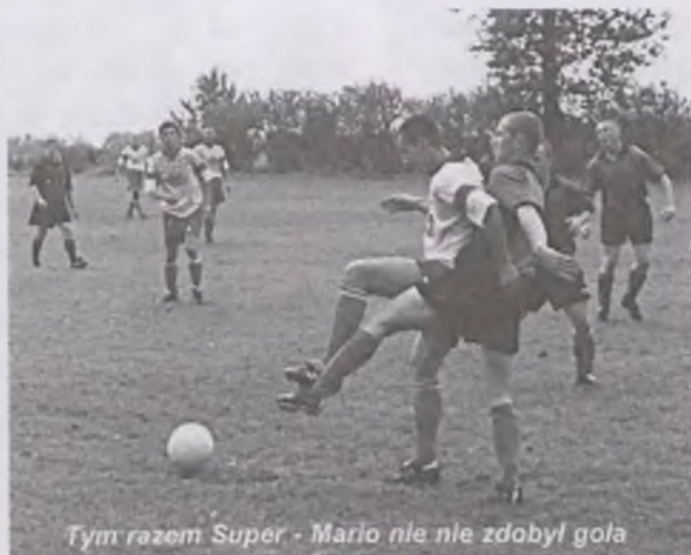
Tym razem Super - Mario nie zdobył gola