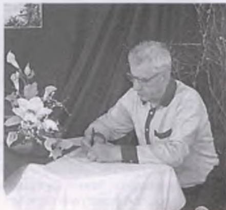
fol. P. Bugaj

Ziemia Szamotulska w walce, cierpieniu - i wolności. 1IX1939 - 27I1945. Opracował W. Próchnicki. Nakładem K.K.O. w Szamotułach - wyd. P.R.N. w Szamotułach. Drukarnia Nakładowa J. Kawalera w Szamotułach - własność Wiesław Michalak.