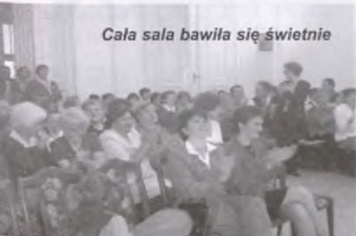
Cała sala bawiła się świetnie

24 września mieszkańcy DPS z Chojna, Gębic, Trzcianki, Wielenia oraz Domu Dziennego Pobytu w Chrzypsku spotkali