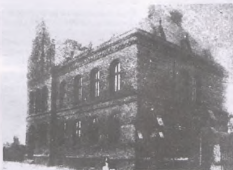
Gmach starej poczty, spalonej w 1939 roku, po wybuchu wojny.

z radością i otuchą dopatrywali się w tym widocznym znaku bliskiej godziny wyzwolenia. Nie obeszło się i tu bez ofiar.