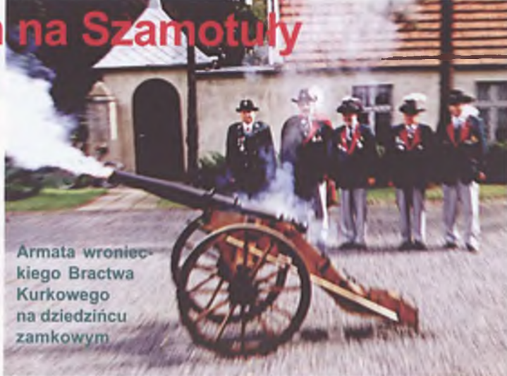
Armata wronieckiego Bractwa Kurkowego na dziedzińcu zamkowym