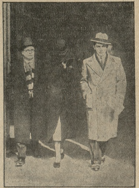
Afera oszusta żydowskiego we Francji, Stawiskiego, stała się ostatnio jeszcze bardziej sensacyjna wskutek aresztowania jego żony, który to moment widzimy na powyższym zdjęciu.

W każdym razie wchodzimy w nowy okres nieznanego i ryzykownego pod względem gospodarczym. (w)