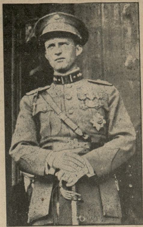
Król belgijski Leopold III.