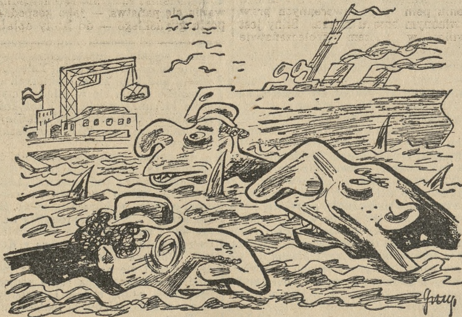
Polski Bałtyk zaroził się w ostatnich czasach drapieżnymi żarłaczami.