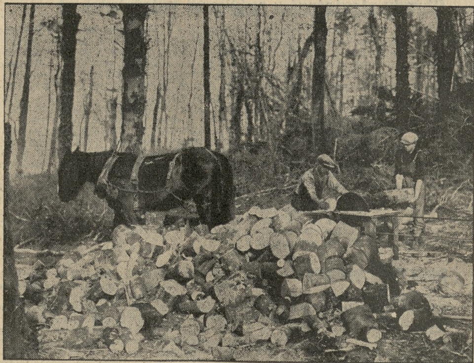
W konserwatywnej Anglii hołduje się jeszcze modzie kominków. W kominkach angielskich więc dużo się spala drzewa, które dla tem szybszej „produkcji” i dla wygody odbiorców ciwartuje się już w lasach przy pomocy udoskonalonej pily z elektrycznym zapędem, jak to widzimy na powyższym zdjęciu.